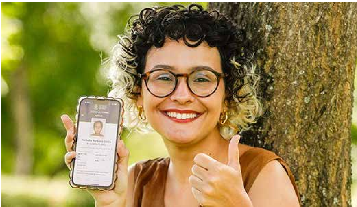
Em Mato Grosso, 107.411 eleitores, o equivalente a 4,13% do eleitorado apto, tiveram o título cancelado

Os cancelamentos foram realizados entre os dias 30 de maio e 2 de junho de 2025, conforme prevê o Provimento Corregedoria-Geral Eleitoral nº 1/2025, mas quem teve o título cancelado pode procurar a Justiça Eleitoral para iniciar o processo de regularização. Regularizar é fácil e seguro, seja presencialmente, no cartório eleitoral, ou pela internet.