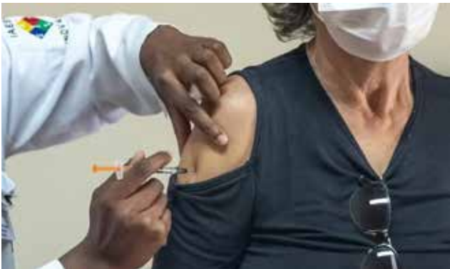
As vacinas permanecem disponíveis em todas as unidades de saúde da cidade. Basta apresentar um documento com foto e, se possível, a caderneta de vacinação

Enquanto isso, as vacinas permanecem disponíveis em todas as unidades de saúde da cidade. Basta apresentar um documento com foto e, se possível, a caderneta de vacinação.