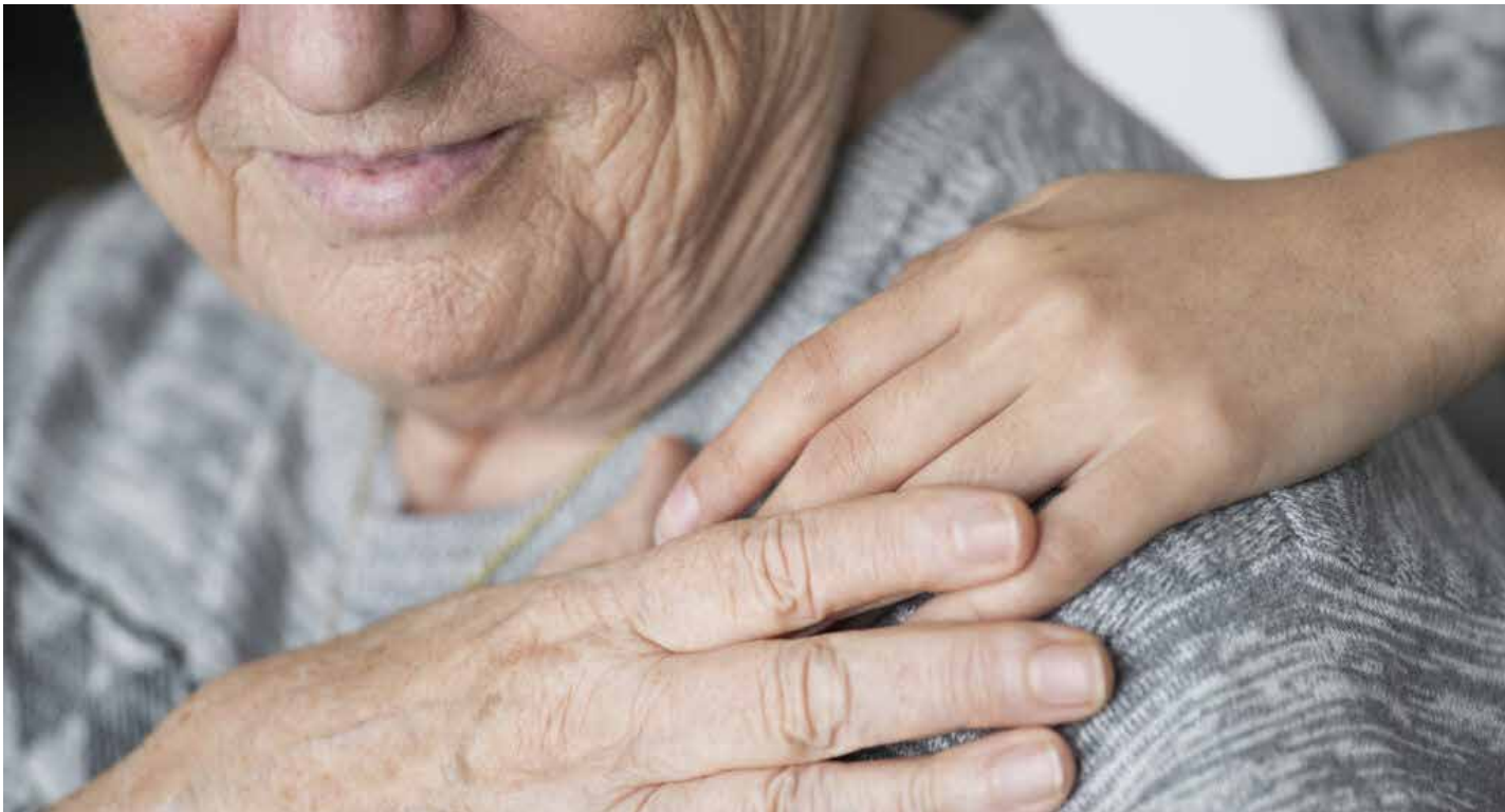
Os casos suspeitos ou confirmados de violência contra a pessoa idosa são objetos de notificação compulsória pelos profissionais de saúde pública ou privada

Os casos suspeitos ou confirmados de violência contra a pessoa idosa são objetos de notificação compulsória pelos profissionais de saúde pública ou privada em todo o território nacional. Fazendo parte do cuidado integral, o encaminhamento destas pessoas idosas em situação de violência para os órgãos responsáveis pela proteção e responsabilização: Delegacia Especial de Repressão aos Crimes por Discriminação Racial, Religiosa ou por Orientação Sexual ou Contra a Pessoa Idosa ou com Deficiência (Decrin) e Central Judicial do Idoso.