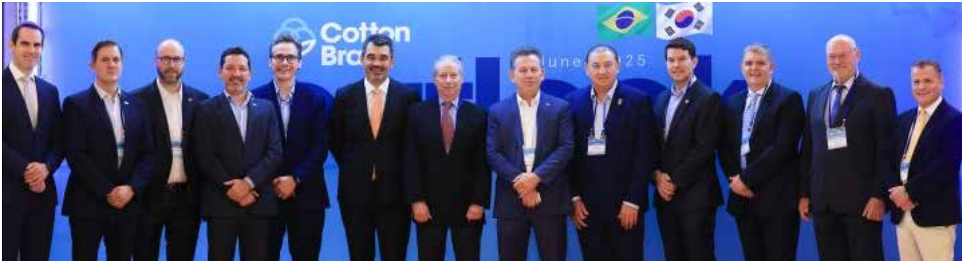
O evento reuniu o setor produtivo do algodão e compradores da Coreia do Sul e foi uma iniciativa para promover o algodão brasileiro no mercado internacional