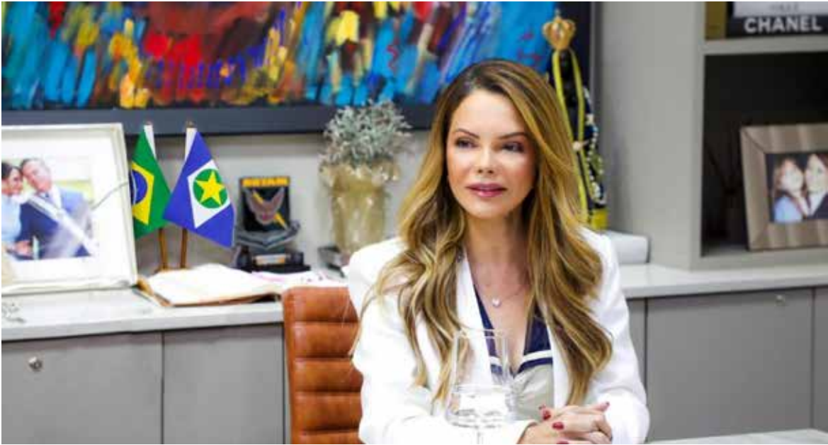
Primeira-dama, Virginia Mendes