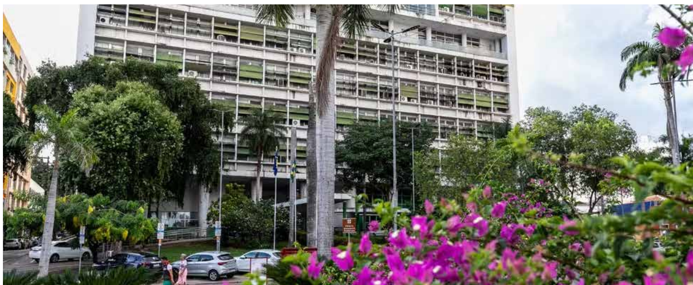
O documento institui o Cadastro Municipal para os Programas Habitacionais “Casa Cuiabana”, que servirá de base para a seleção de famílias em novos empreendimentos de habitação

Para se inscrever, o cidadão deverá apresentar o CPF e criar uma senha pessoal, além de aceitar a Política de Privacidade, em conformidade com a Lei Geral de Proteção de Dados (LGPD – Lei nº 13.709/2018).