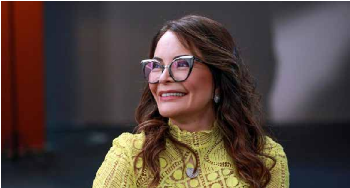
Primeira-dama, Virginia Mendes