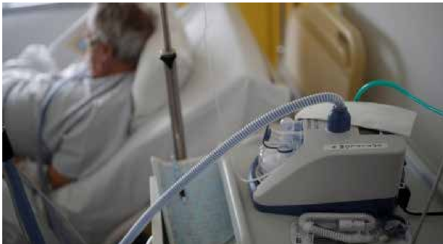
A SRAG é um quadro clínico grave caracterizado por febre, tosse e dificuldade respiratória que pode evoluir para insuficiência respiratória e óbito

“A vacina contra a gripe é gratuita e eficaz, especialmente para os grupos de risco, e está disponível nas Unidades Básicas de Saúde