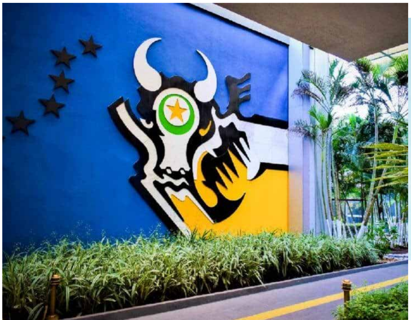
Governo de MT impulsiona desenvolvimento do Estado com redução de impostos para cidadão