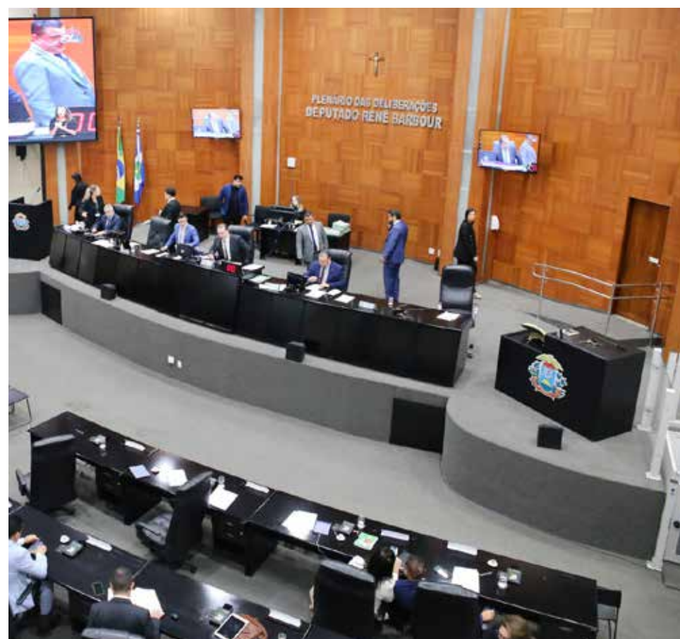
Com foco em resultados, os deputados estaduais vêm consolidando o papel do Parlamento como agente ativo no desenvolvimento do estado

Na área previdenciária, a Assembleia foi o primeiro Poder do Estado a aderir integralmente ao novo modelo de gestão do MT Prev, garantindo sustentabilidade fiscal e valorização dos servidores.