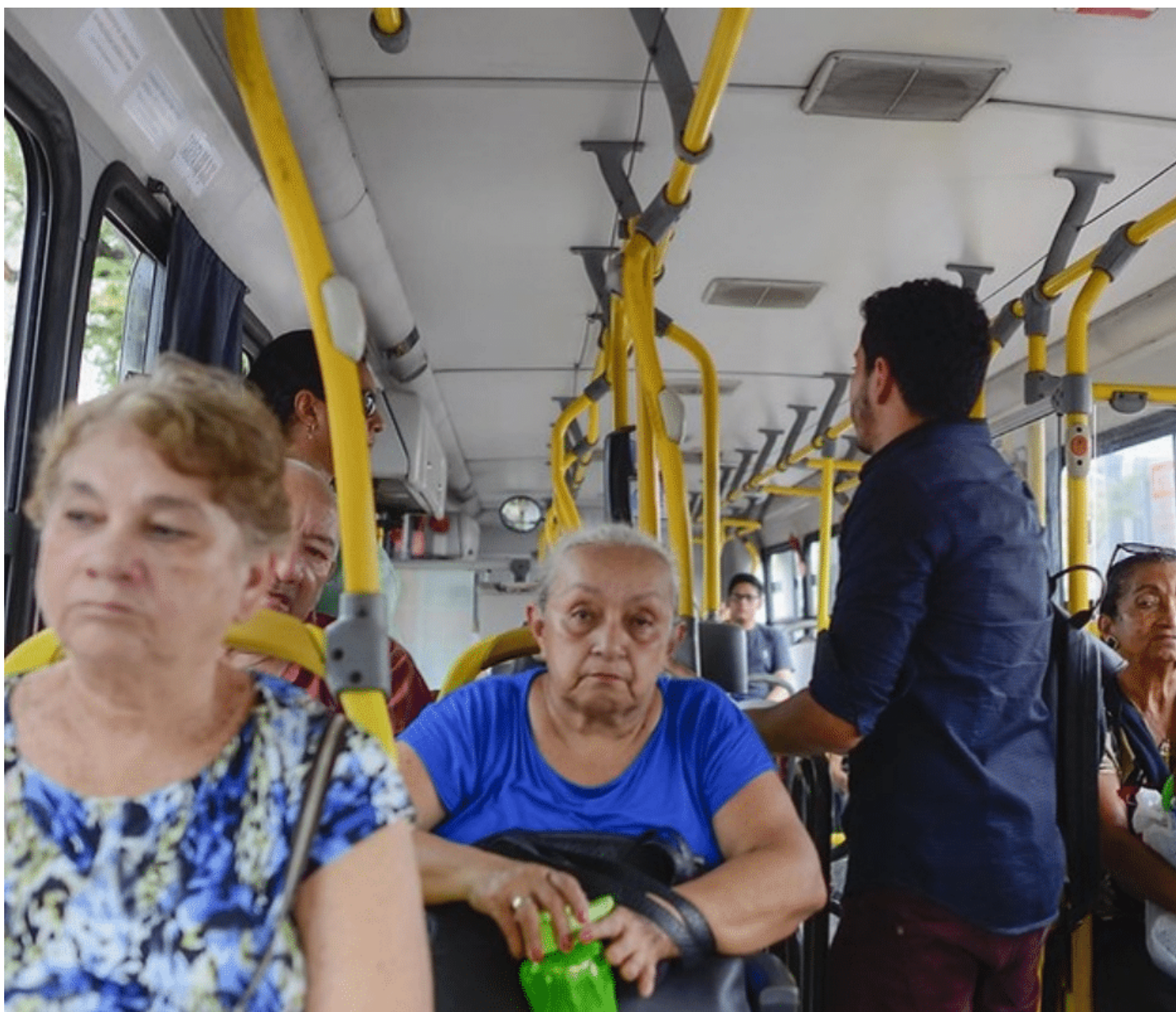
A decisão afirmou que o Estatuto do idoso e a Lei nº 8.899/1994 garantem expressamente o direito ao transporte gratuito para idosos e pessoas com deficiência

“A hierarquia das normas impõe que um decreto não pode restringir direitos estabelecidos em leis federais, sob pena de violação ao princípio da legalidade”, destacou o voto.