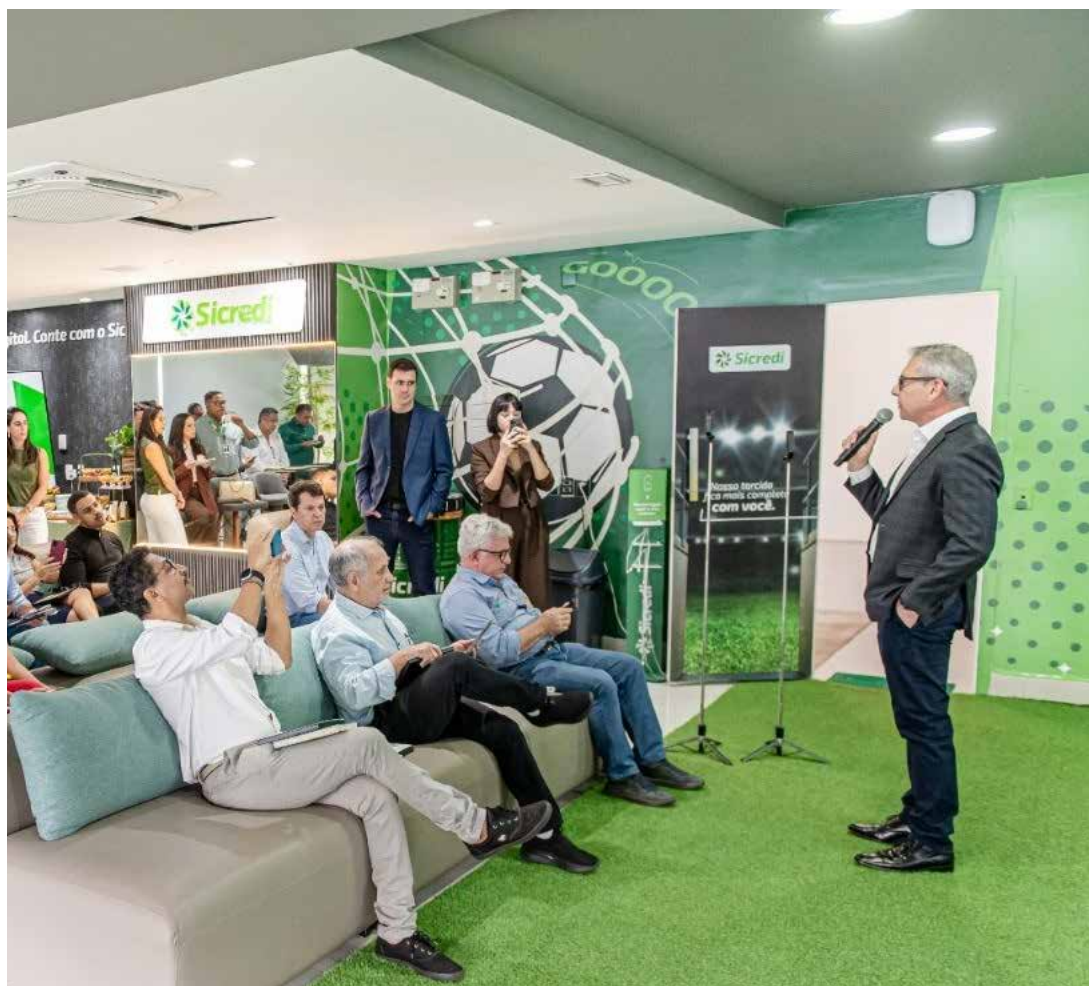
Sicredi promoveu o tradicional “Café com Pauta”, evento com profissionais da imprensa para apresentar os resultados e o impacto de suas ações em MT

Programa voltado para a comunidade escolar, o Programa A União Faz a Vida é uma das principais iniciativas de responsabilidade social do Sicredi, que este ano completa 30 anos. Visa construir e vivenciar atitudes e valores de cooperação e cidadania, por meio de práticas de educação cooperativa contribuindo para a educação integral de crianças e adolescentes. Em solo mato-grossense, o programa é desenvolvido em 72 municípios, atendendo 556 escolas, com a participação de 9,1 mil educadores e mais de 149 mil crianças e adolescentes atendidos.