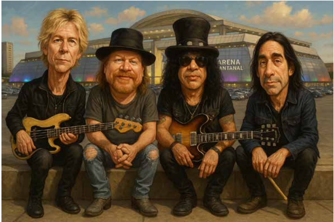
Depto. Arte| NM

A infraestrutura e o histórico da Arena Pantanal foram fatores determinantes para que Cuiabá entrasse na rota do Guns N’ Roses. A confirmação foi feita pelo secretário de Estado de Esporte, Cultura e Lazer (Secel), David Moura, em entrevista ao Primeira Página. A banda Guns N’ Roses deve se apresentar na capital mato-grossense em uma das duas datas prováveis: 31 de outubro ou 2 de novembro de 2025.