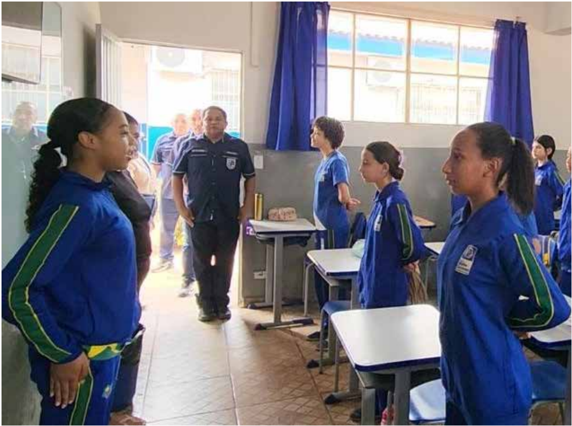
A meta do governo é que até o final de 2025, o estado tenha 100 escolas cívico-militares

A Secretaria Estadual de Educação (Seduc) publicou na semana passada um edital de chamamento de consulta pública para votação que pode converter 28 escolas estaduais para o modelo cívico-militar.