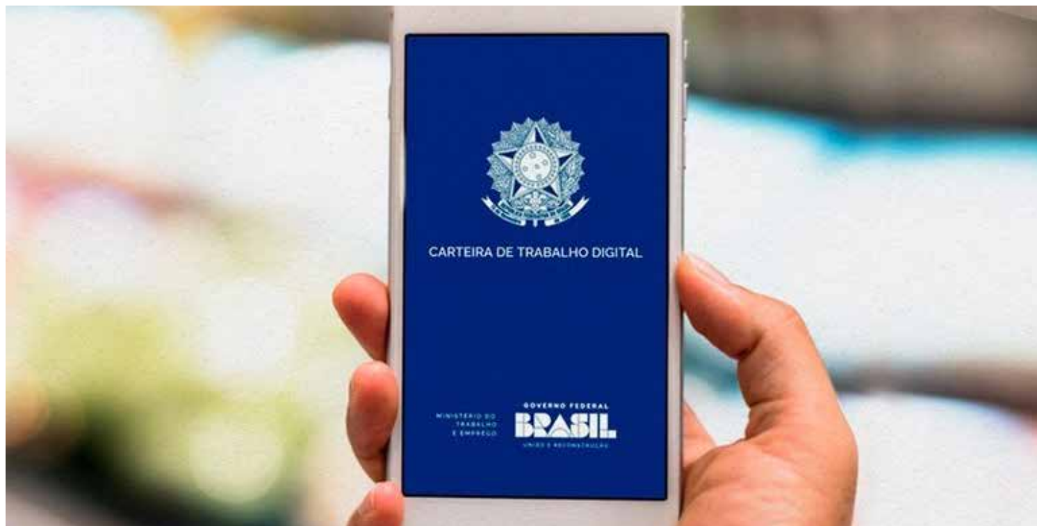
As novas vagas com carteira assinada geradas em março em Mato Grosso foram ocupadas, em sua maioria, por pessoas do sexo feminino (1.110)

Apesar do saldo negativo em março, três setores da economia em Mato Grosso apresentaram resultados positivos.