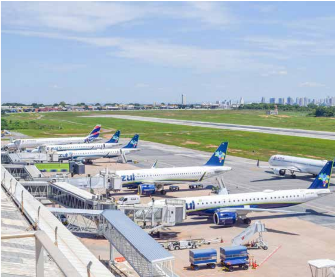
Mais de 5.200 voos regulares foram registrados no maior aeroporto de Mato Grosso