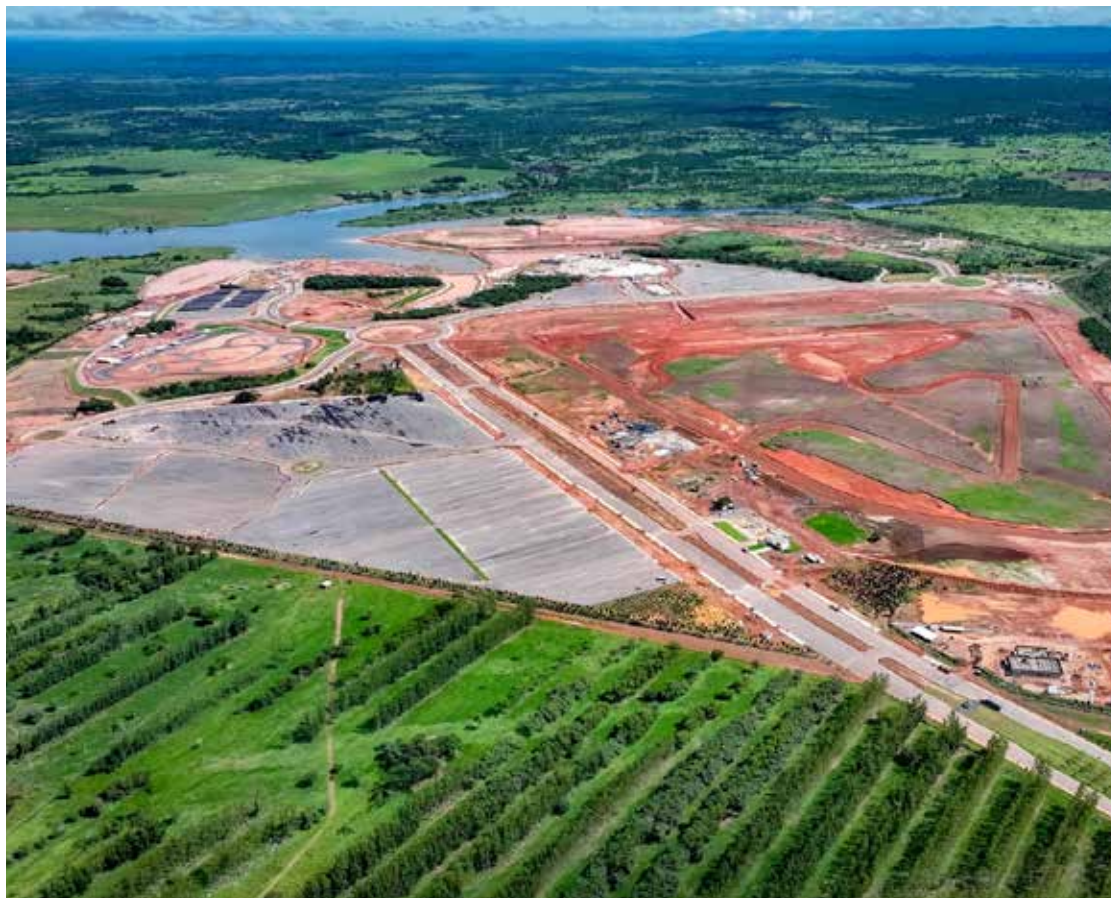
O espaço promete ser a maior arena multieventos da América Latina, às margens da MT-251