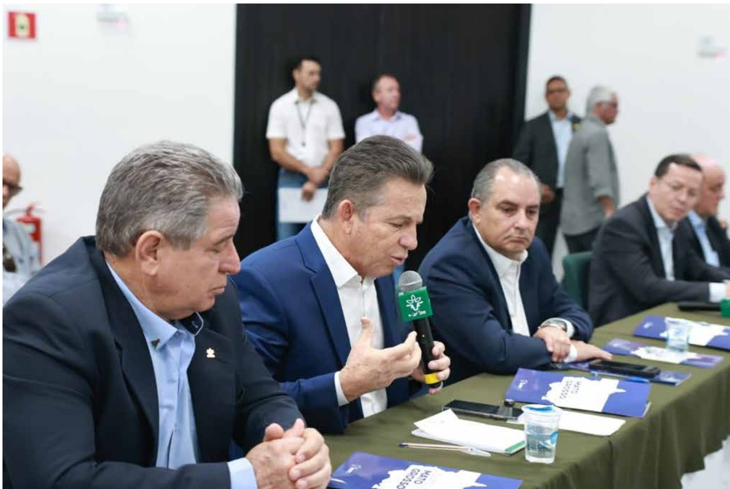
O governador Mauro Mendes destacou que o cenário econômico para os próximos anos é desafiador tanto para Mato Grosso, quanto para o Brasil

“Não estamos aqui para criticar. Este estudo não é um documento de reclamação. Pelo contrário: é um instrumento de construção. Mato Grosso se desenvolveu muito nas últimas décadas e, por isso, acreditamos no potencial de torná-lo ainda mais forte, competitivo e sustentável”, destacou.