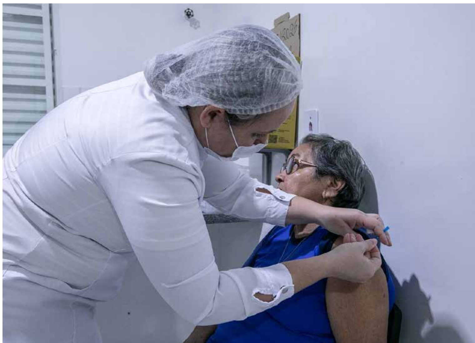
A vacina protege contra três tipos do vírus da influenza: H1N1, H3N2 e influenza B

Fazem parte do grupo prioritário: crianças de 6 meses a menores de 6 anos (5 anos, 11 meses e 29 dias); gestantes; puérperas; idosos (60 anos ou mais); povos indígenas e quilombolas; pessoas em situação de rua; trabalhadores da saúde, professores e profissionais das forças de segurança e salvamento; caminhoneiros, trabalhadores do transporte coletivo e portuários; trabalhadores dos