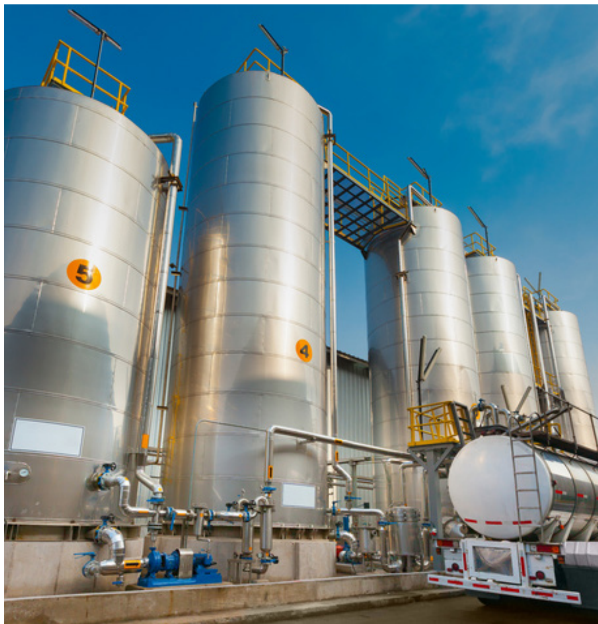
As 16.072 mil indústrias instaladas no estado são responsáveis por empregar mais de 191.119 mil trabalhadores

“A baixa disponibilidade de profissionais qualificados é um indicativo claro de que precisamos investir fortemente na capacitação da força de trabalho local. O Sistema Fiemt, por meio do Sesi, Senai e IEL, está comprometido em oferecer formação e requalificação, além de processos de inovação para as indústrias, garantindo que o mercado continue a crescer de forma sustentável”, destaca o presidente da Fiemt, Sílvio Rangel.