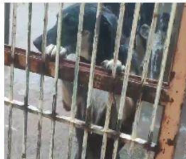
Segundo Rosalina Nunes, responsável pelo local, além da estrutura, eles perderam tudo: potes, rações, medicamentos, produtos de limpeza, higiene e as camas dos pets

Fortes chuvas destruíram o abrigo de animais Lar dos Sonhos, em Várzea Grande, deixando mais de 100 cães e gatos em situação de vulnerabilidade. A água invadiu o local no último dia 10 após um trator desviar o curso da estrada de acesso ao abrigo, redirecionando o fluxo diretamente para o espaço. Após perder tudo que tinha, a organização pede a ajuda da população para arrecadar ração, remédios e outros itens essenciais para os bichinhos.