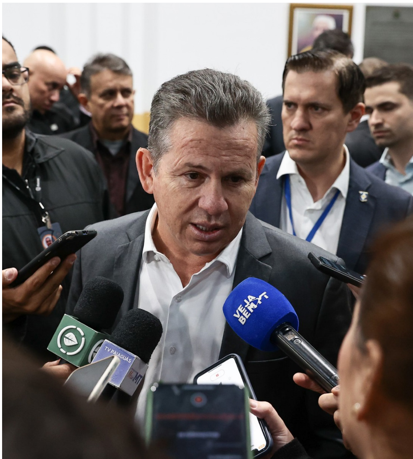
O governador Mauro Mendes determinou que a Defesa Civil do Estado preste o auxílio necessário aos municípios atingidos por enchentes e alagamentos

Entre as medidas está a reconstrução de 35 casas que foram destruídas. Segundo o Governo do Estado, também será cobrada a documentação para retomar e finalizar algumas casas antigas, da Caixa Econômica, que estão com obras paradas. Enquanto isso, as famílias desabrigadas vão receber o aluguel social.