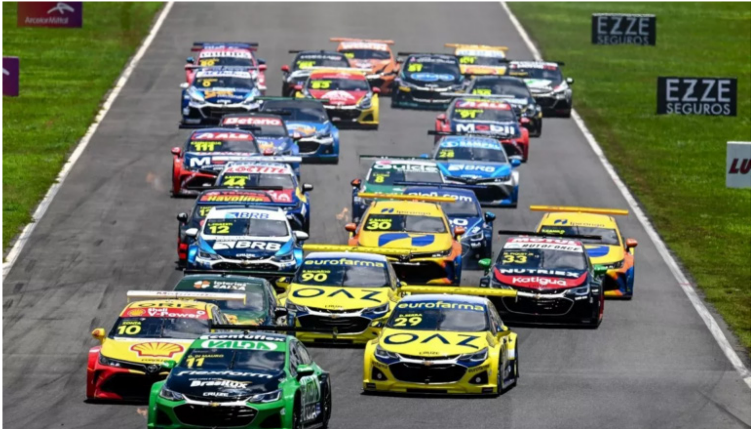
Prova da Stock Car Brasil