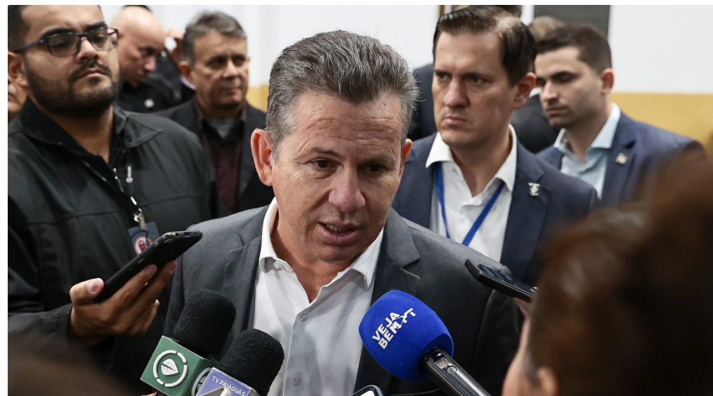
Mauro Mendes determinou que a Defesa Civil do Estado preste o auxílio necessário aos municípios atingidos por enchentes e alagamentos