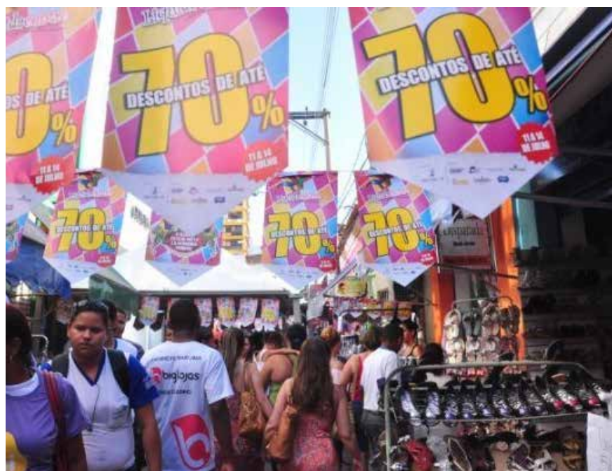
Liquida Grande Cuiabá será a maior campanha de vendas com descontos realizada em Mato Grosso