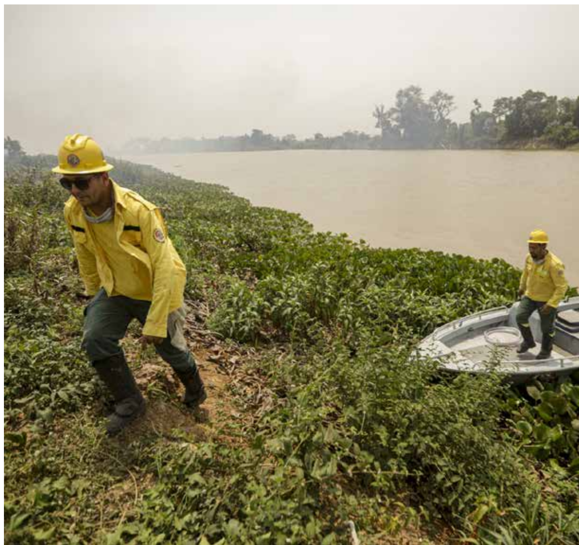
As projeções indicam que, neste ano, podem ser registradas cotas negativas em municípios de Mato Grosso, onde o cenário já é grave

É importante ressaltar que as cotas indicadas nos gráficos e tabelas são valores associados a uma referência de nível local e arbitrária, válida para as régua linimétricas específicas de cada estação.