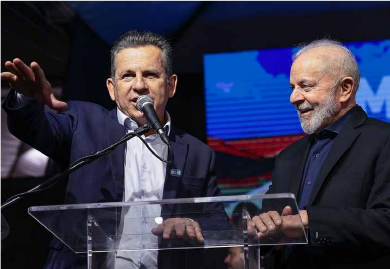
Governador Mauro Mendes e presidente Lula entregaram as casas dos residenciais Colinas Douradas I e II, em Várzea Grande

Judiciário de MT intensifica reconhecimento de paternidade