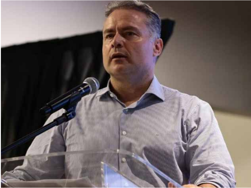
Ministro dos Transportes, Renan Filho