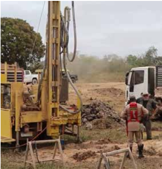
Esses poços artesianos são essenciais para o abastecimento de caminhões do Corpo de Bombeiros