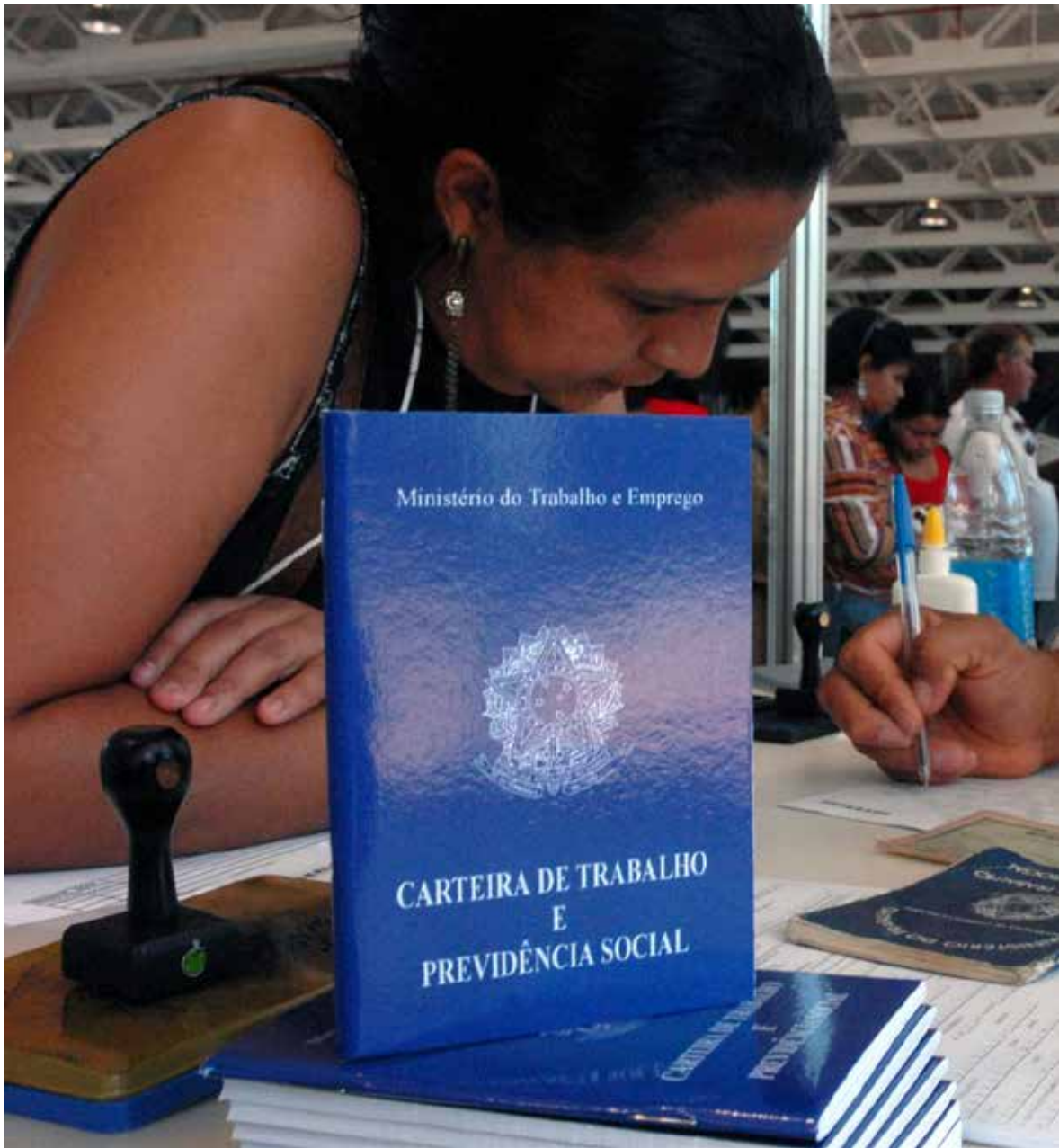
Os dados do Caged, levam em consideração apenas o número de trabalhadores com carteira assinada e não incluem os trabalhadores informais