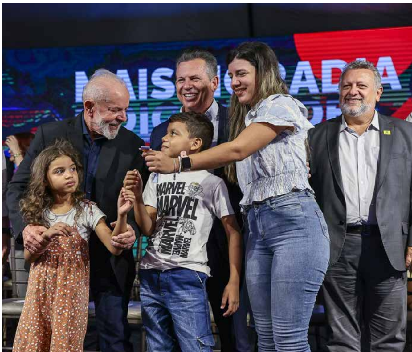
Governador Mauro Mendes e presidente Lula entregam as casas dos residenciais Colinas Douradas I e II, em Várzea Grande

Do total, R$ 35,5 milhões foram investidos desde 2019 e outros R$ 13 milhões, nas gestões passadas.