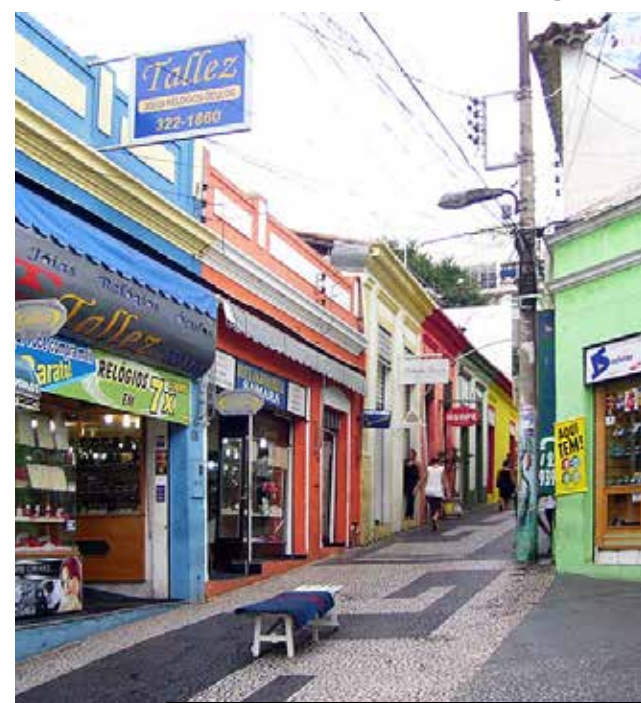
Algumas ruas do Centro Histórico ficaram de fora das obras de requalificação