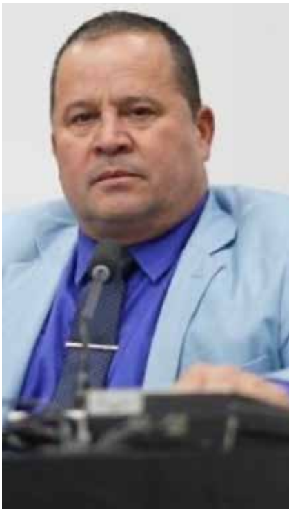
Sargento Vidal é policial militar aposentado e vereador por Cuiabá