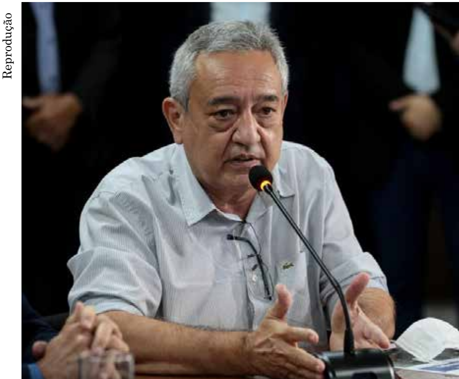
Secretário de Estado de Infraestrutura e Logística de Mato Grosso, Marcelo Oliveira