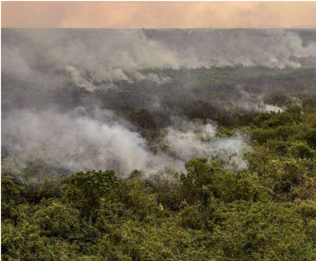
Por meio das imagens do satélite Planet os pesquisadores observaram que pulso de cheias não aconteceu neste ano, sem o transbordamento dos rios

Na Bacia do Alto Rio Paraguai, onde se situa o Pantanal, a estação chuvosa ocorre entre os meses de outubro e abril, e a estação seca, entre maio e setembro. De acordo com o estudo, entre janeiro e abril de 2024, a média da área coberta por água foi de 400 mil hectares, em pleno período de cheias, abaixo da média de 440 mil hectares registrada na estação seca de 2023.