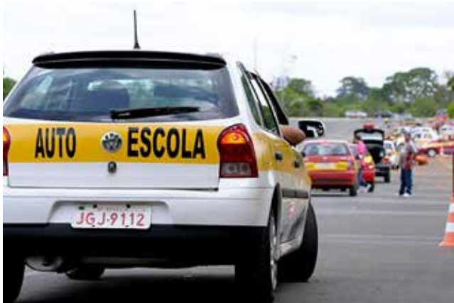
O Detran-MT recomenda que os candidatos procurem seus CFCs para finalizar os processos ao longo do ano