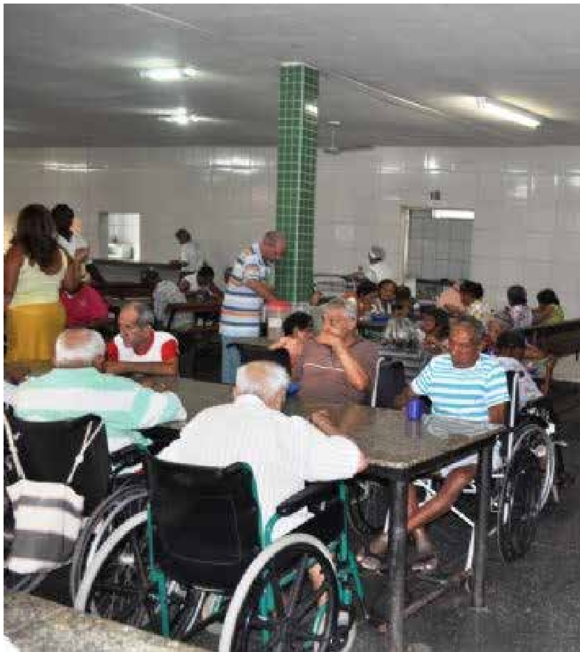
O abrigo é uma instituição de longa permanência que se mantém com doações da iniciativa privada e com recursos oriundos de convênios firmados com o poder público municipal