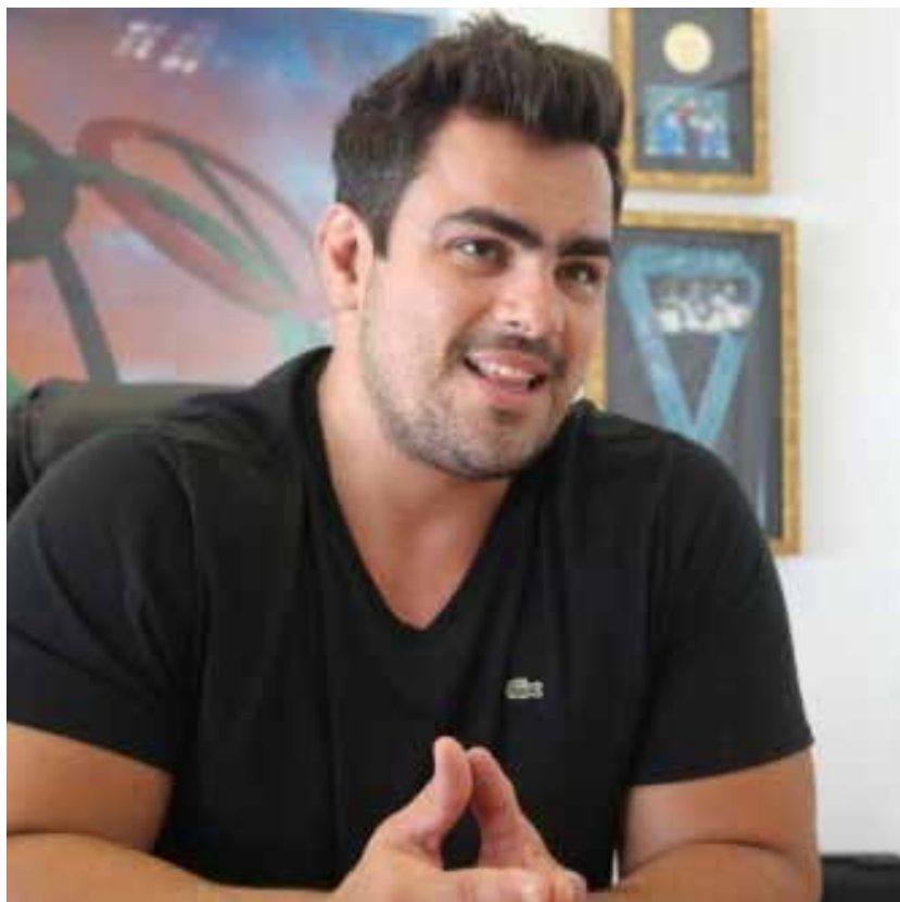
David Moura, secretário de Esporte, Cultura e Lazer de MT