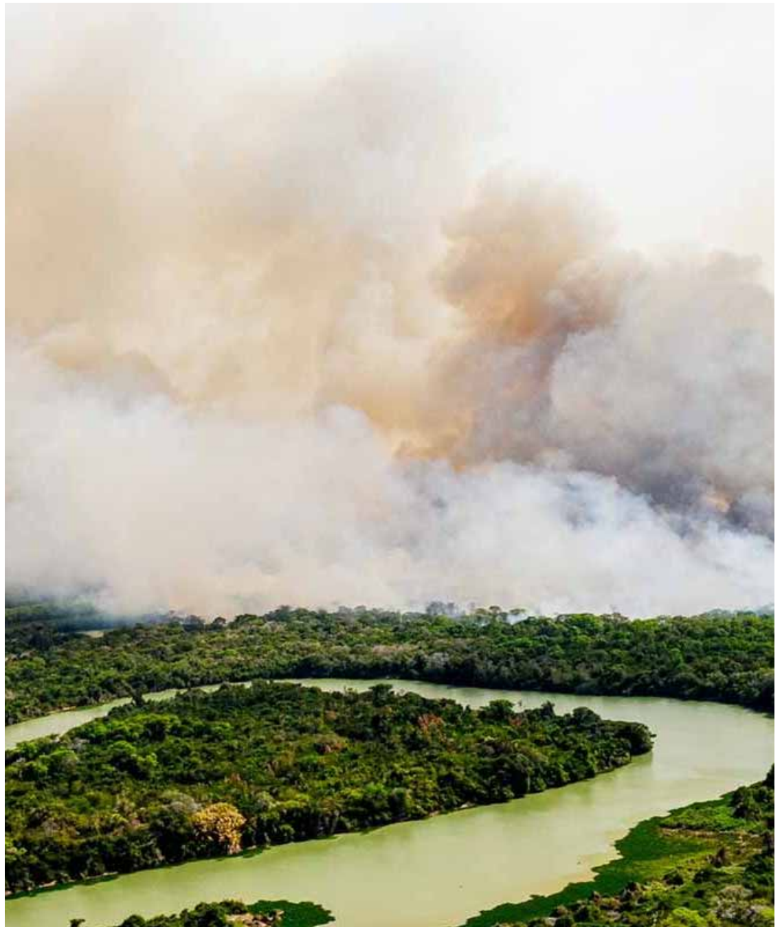
De acordo com o Instituto Nacional de Pesquisas Espaciais (Inpe), Mato Grosso registrou 682 focos de calor entre os meses de janeiro a junho de 2024

O Pantanal também funciona como um reservatório de água doce com altitudes que alcançam 150 metros. Seus recursos hidrológicos são importantes para o abastecimento das cidades, onde vivem aproximadamente 3 milhões de pessoas, no Brasil, Bolívia e Paraguai.