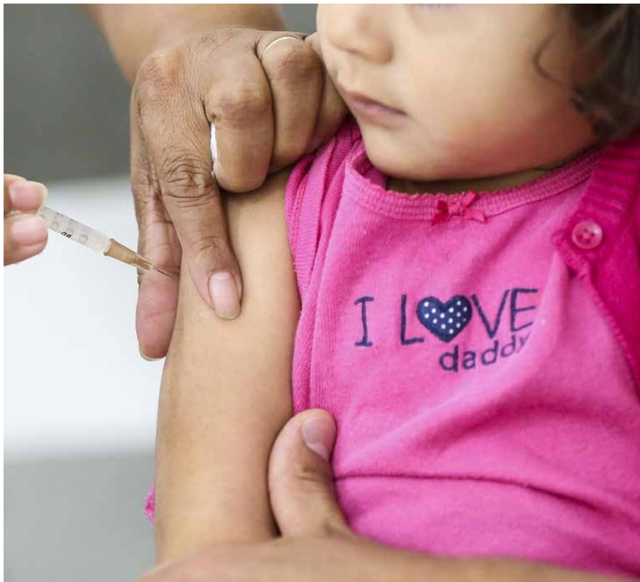
A pesquisa mostra que das pessoas que estão mais em dia com o protocolo vacinal, são as mulheres com 52,9%, enquanto que os homens totalizam 50,8%

Dentre as pessoas que foram diagnosticadas com a doença, 943 mil (36,6%) eram maiores de 18 anos (jovens, adultos e idosos). Já as pessoas entre 5 a 17 anos (adolescentes e crianças), foram um total de 105 mil (14,8%).