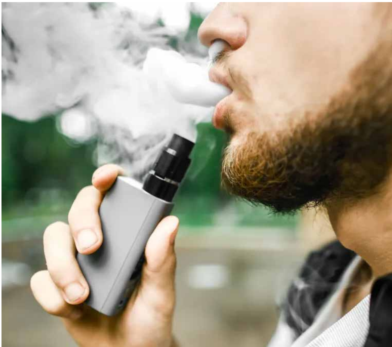
Cerca de 2,2 milhões de adultos (1,4%) afirmaram ter consumido os dispositivos eletrônicos para fumar até 30 dias antes da pesquisa

Os vaporizadores ou produtos de tabaco aquecido não são produtos inofensivos ao organismo humano, apesar da premissa de que eles não contêm substâncias como monóxido de carbono, alcatrão, entre outros compostos provenientes da degradação e combustão do tabaco.