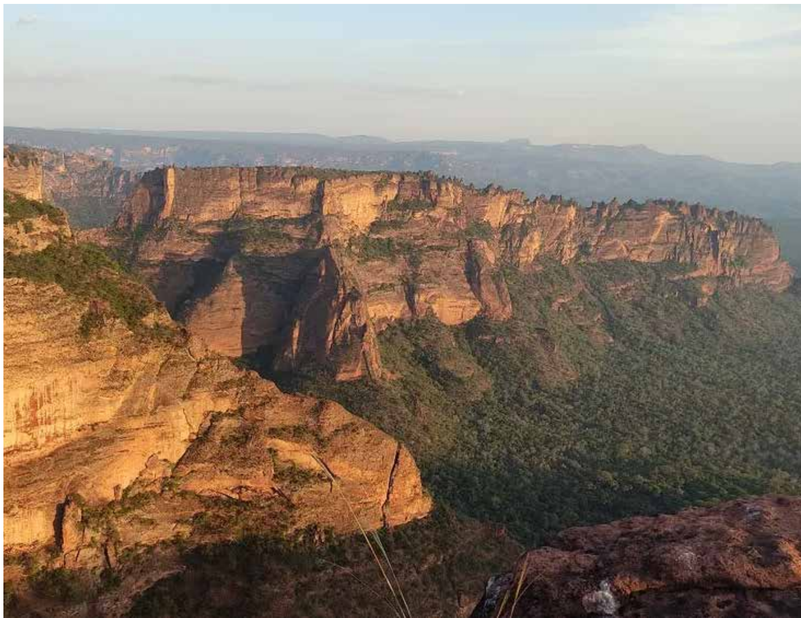
O Parque terá investimentos de cerca de R$ 218 milhões nos próximos 30 anos, entre infraestrutura e operações

Um dos parques nacionais mais procurados do país, tendo recebido 132 mil pessoas em 2022, o espaço é referência entre as unidades de conservação federais no Brasil. O Parque da Chapada dos Guimarães ocupa uma área natural de Cerrado, o segundo maior bioma brasileiro, e abriga nascentes de rios que formam o Pantanal.