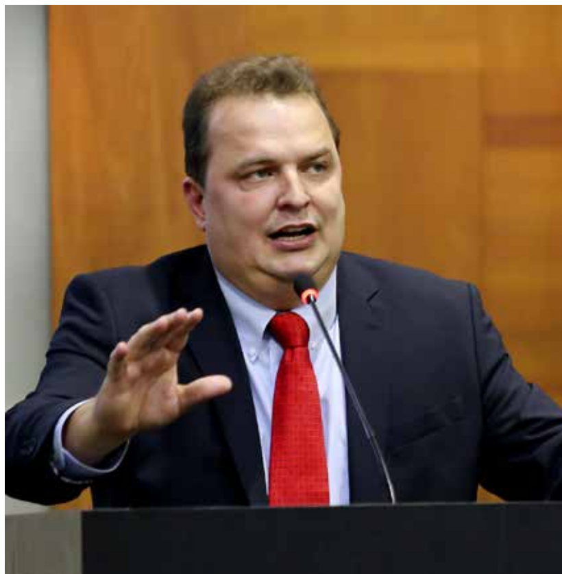
Presidente do PSB em MT e deputado estadual, Max Russi