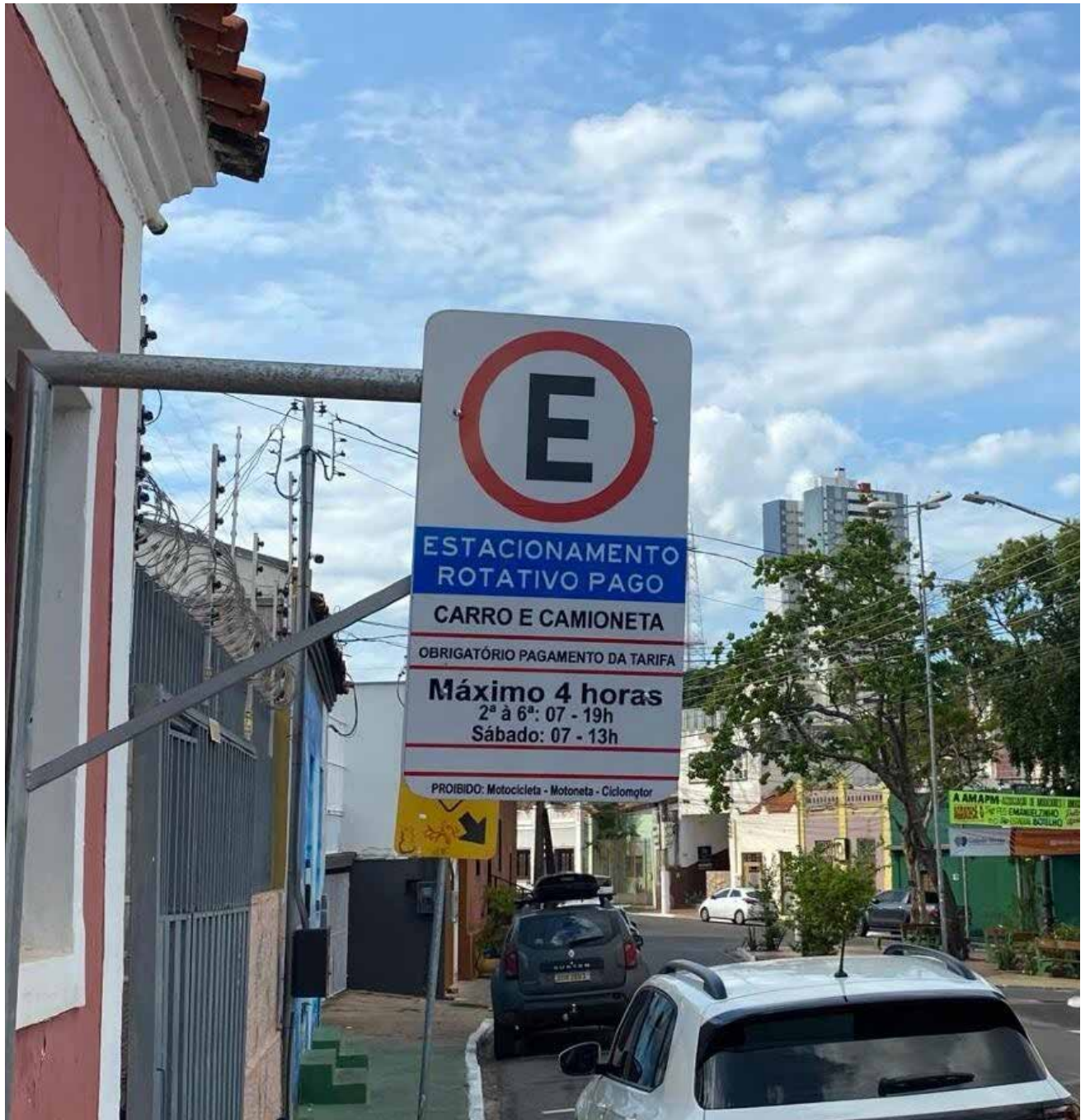
Há 100 parquímetros instalados em Cuiabá. O horário de funcionamento é de segunda a sexta-feira, das 07h às 19h, e aos sábados, das 07h às 13h