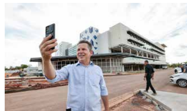
Governo do Estado vai entregar ainda esta ano o Hospital Central de Cuiabá e constrói outros cinco hospitais em Mato Grosso

“Muito não sabem, mas para uma escola ser contabilizada na nota do IDEB, pelo menos 80% dos alunos matriculados ali precisam fazer a prova do SAEB, a cada dois anos, e não pode zerar. E antes, das mais de 700 escolas que nós tínhamos, pouco mais de 40 escolas tinham atingido essa meta. Olha o descompromisso que a nossa rede tinha com o processo de avaliação! Mas sabe quantos por cento das escolas estaduais fizeram essa prova este ano? 92% das escolas. Então isso mostra que a nossa rede já está num outro momento, em uma outra vibe”, destacou.