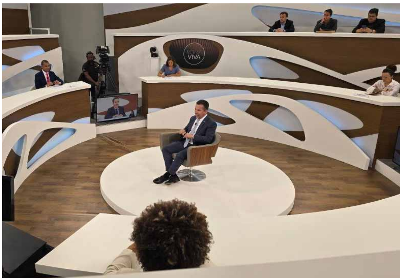
“Eu tenho defendido que a lei brasileira tem que mudar e quem faça desmatamento ilegal perca a sua terra”, destacou o governador