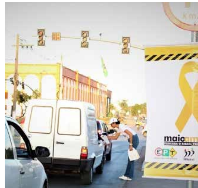
A campanha começou com ações de conscientização e de orientações e palestras