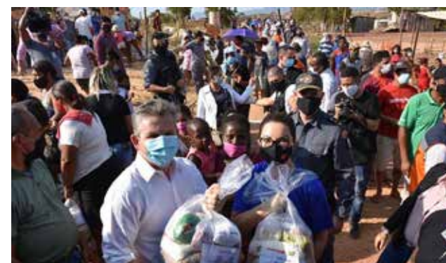
Primeira-dama Virginia Mendes lidera ações sociais voltadas à população carente e vulnerável de Mato Grosso