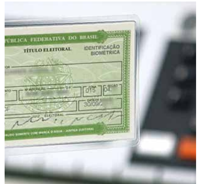
Para facilitar o atendimento, o horário de atendimento ao público nos Cartórios Eleitorais e nas Centrais de Atendimento ao Eleitor foi ampliado para 8h às 18h.

Além de não poder votar, o eleitor que não estiver em dia com as obrigações eleitorais pode ter dificuldades para emitir documentos como passaporte, fazer matrículas em universidades, tomar posse em cargos públicos ou receber benefícios sociais do governo.