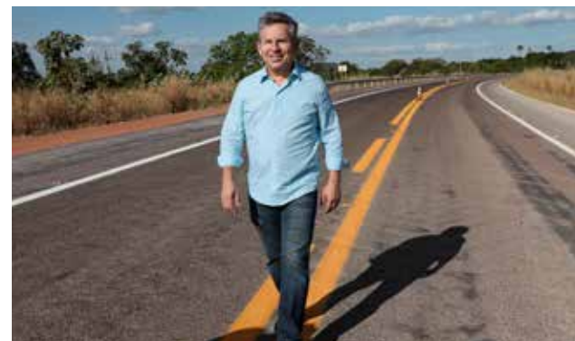
Governador garante que o Estado irá atingir a meta de 5,5 mil quilômetros de asfalto novo até o final da gestão