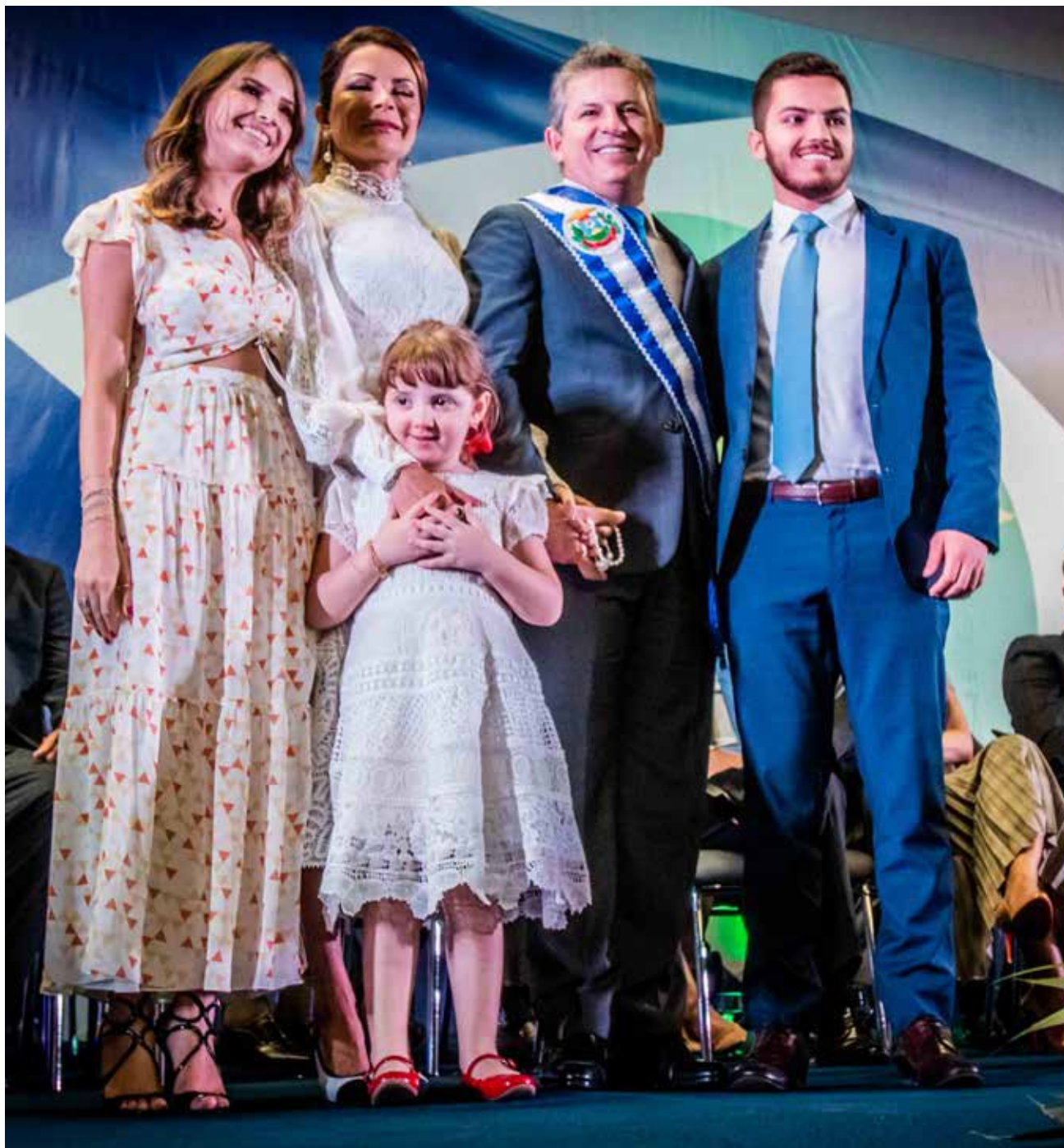
Governador Mauro Mendes assumiu Mato Grosso em dificuldades financeiras e com auxílio de sua equipe recobrou o equilíbrio fiscal do Estado

uidade de fortes investimentos em obras em todos os municípios do Estado, mudando a realidade da população