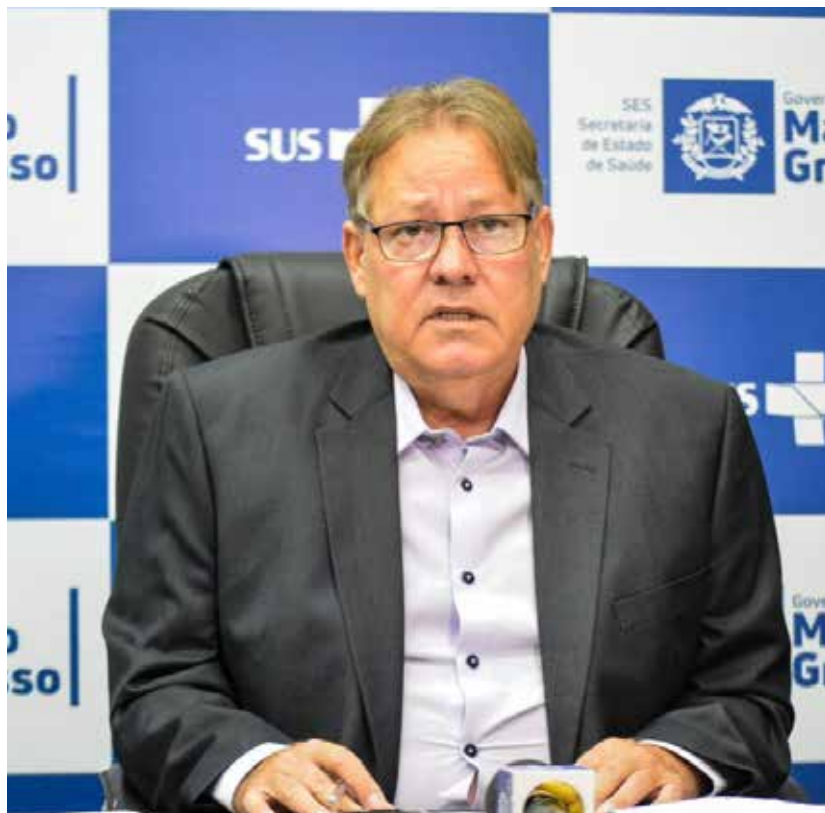
Secretário de Estado de Saúde Gilberto Figueiredo