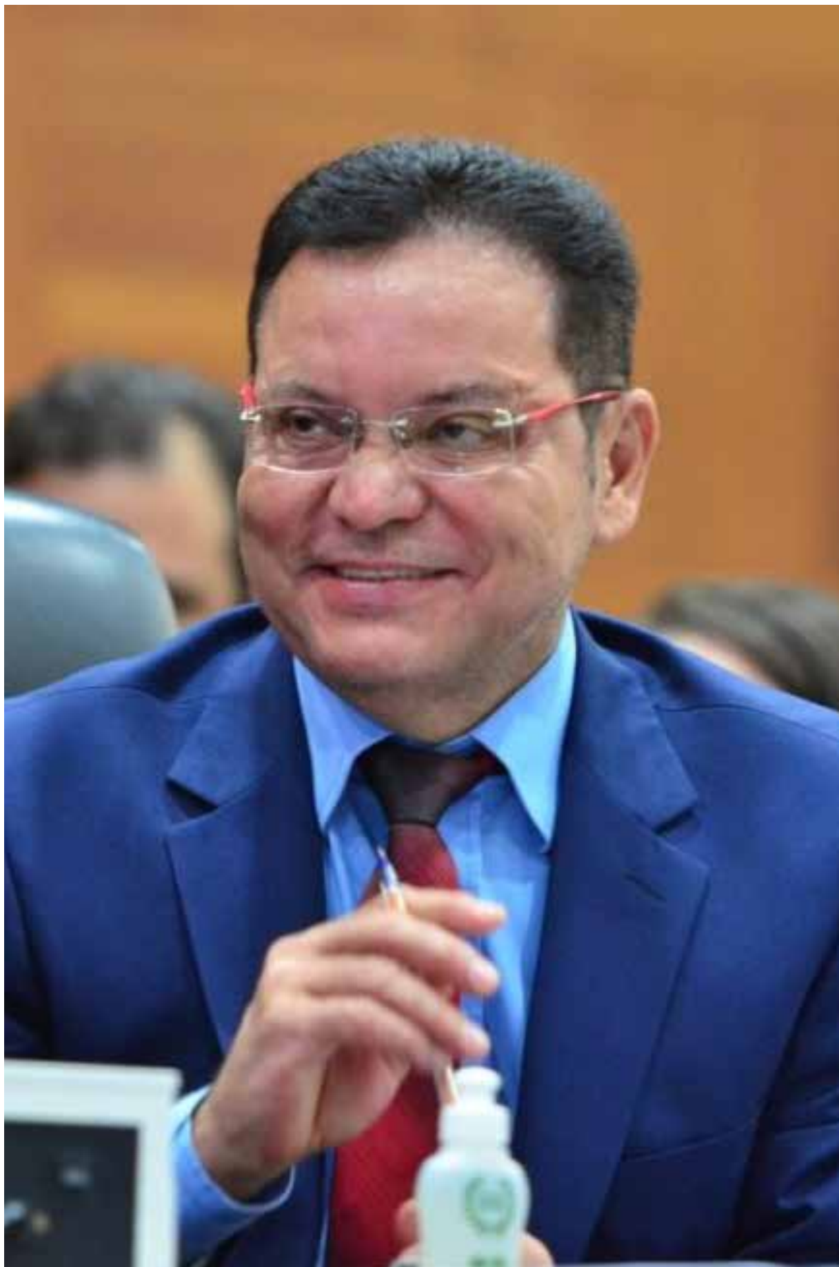
Deputado Eduardo Botelho é pré-candidato a prefeito de Cuiabá e vem liderando todas as pesquisas de intenção de voto