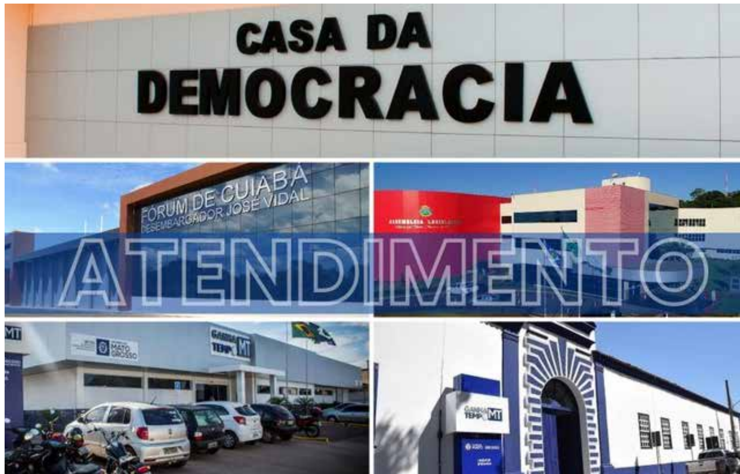
Durante o atendimento, o eleitor deve apresentar um documento oficial de identidade e um comprovante de residência

Durante o atendimento, o eleitor deve apresentar um documento oficial de identidade (RG, CNH, Carteira de Trabalho, Carteira Profissional, dentre outros definidos em lei), e um comprovante de residência (conta de luz, água, telefone, boleto de IPTU, contrato de aluguel, dentre outros definidos pelo Juiz Eleitoral). No caso de homens com mais de 18 anos que irão requerer a primeira via do título (alistamento) é necessário também apresentar o comprovante de quitação com o serviço militar.