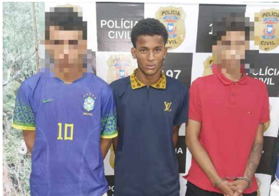
Os acusados pelo crime foram presos na noite de segunda-feira (15) e confessaram os homicídios

Farias disse ainda que o 'desejo de matar' foi atribuído por um dos responsáveis após um assalto cometido por ele, no ano passado, junto com um irmão, que acabou morto na ocorrência e o menor atingido com um disparo no tórax que o deixou com lesões.