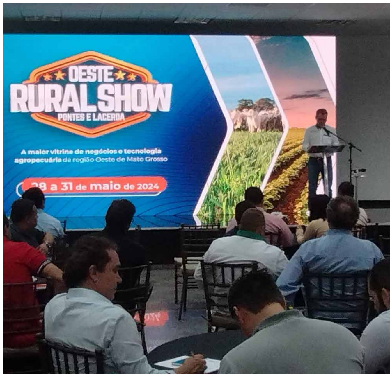
Lançamento da feira de tecnologia e negócios agropecuários foi realizada na semana passada na Famato