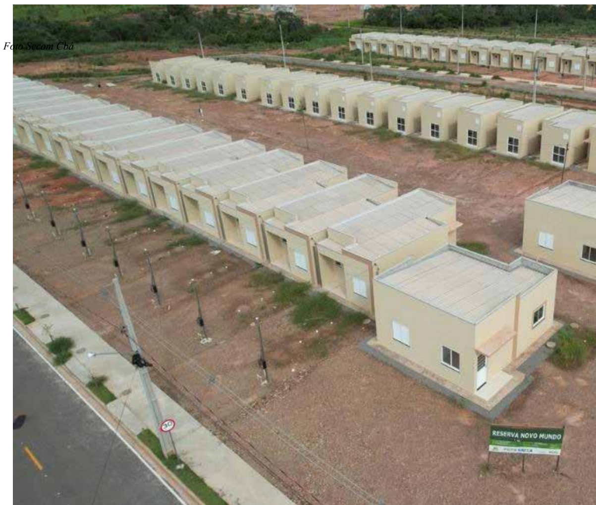
As moradias são em Cuiabá e Várzea Grande e fazem parte do Programa SER Família Habitação, que oferece aos interessados o subsídio de até R$ 20 mil para ser aplicado na entrada no imóvel