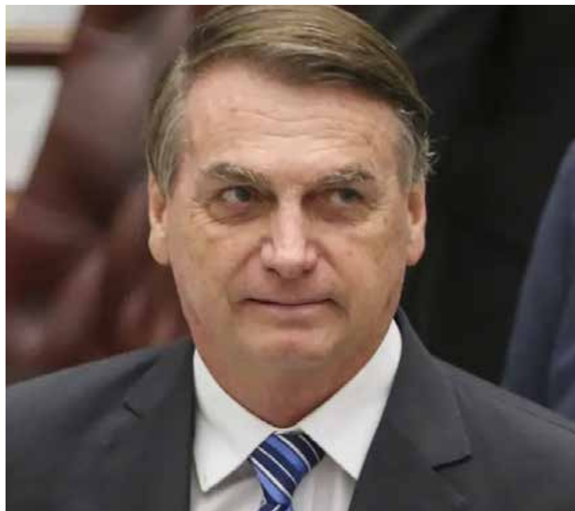
Ex-presidente Jair Bolsonaro