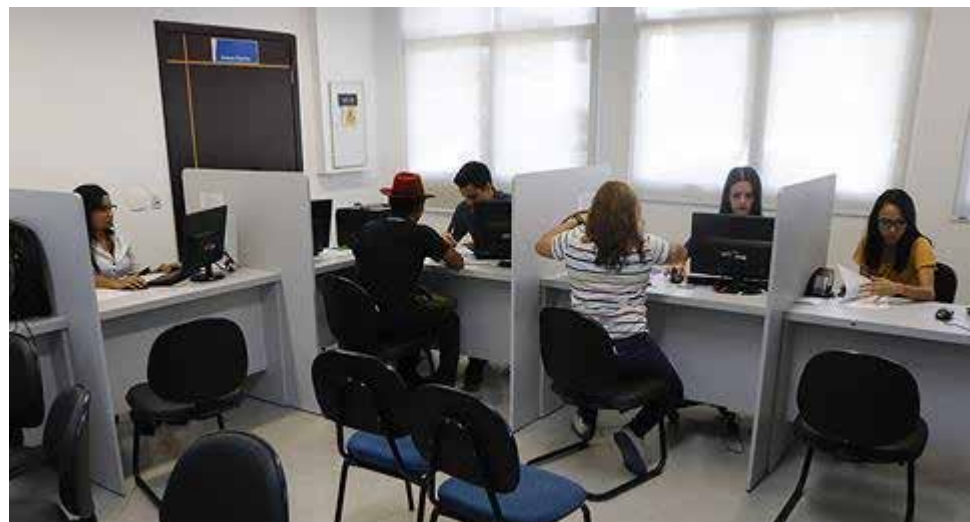
Os atendimentos estão à disposição da população no piso térreo do prédio do Fórum Trabalhista de Cuiabá