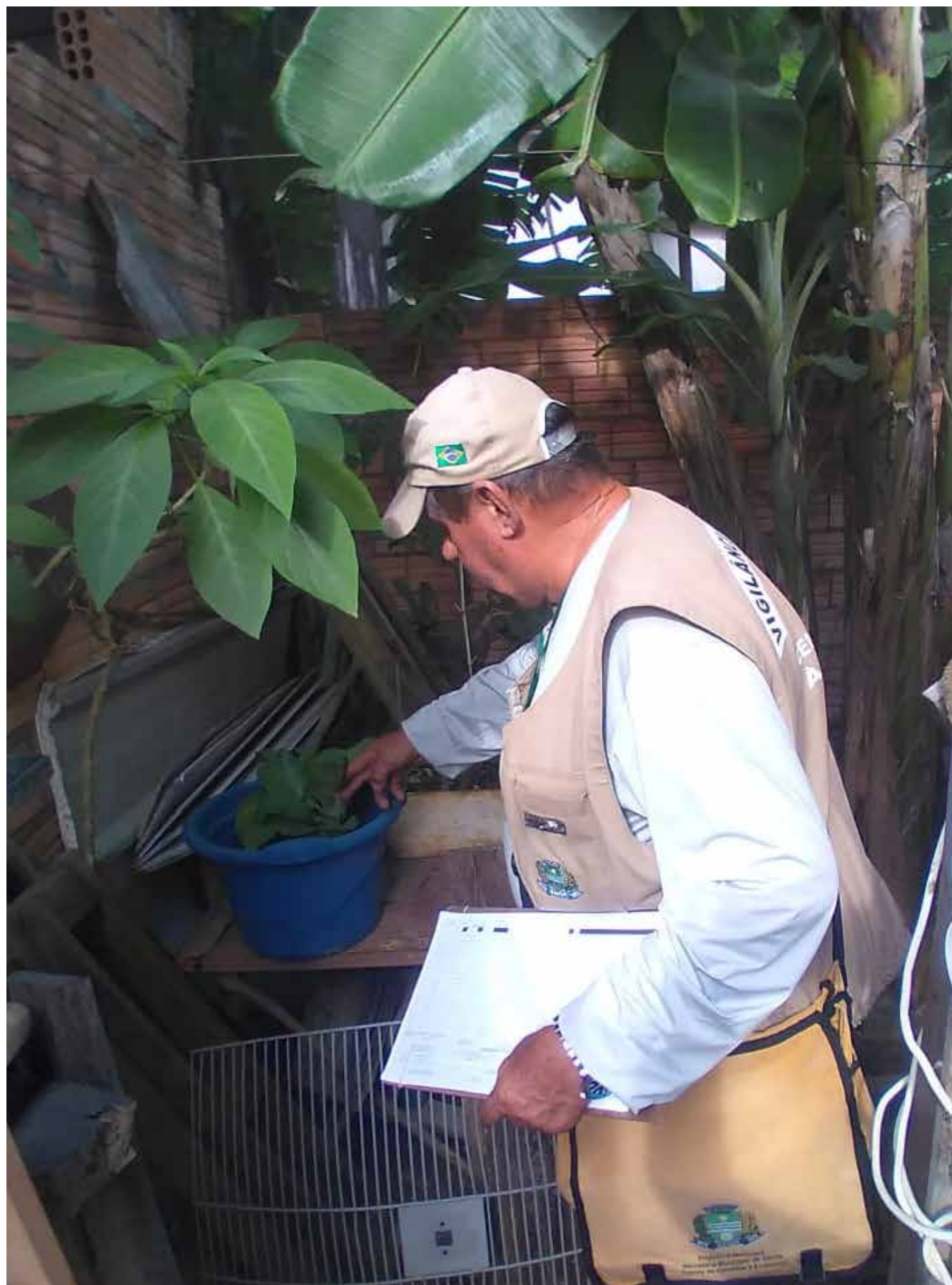
Diversas ações serão feitas em escolas, unidades de saúde, órgãos públicos, igreja e outros no combate ao Aedes aegypti , mosquito transmissor da dengue

Além disso, colocar no lixo todo objeto não utilizado que possa acumular água e manter as calhas limpas são recomendações dos especialistas, além do uso pessoal de repelente.