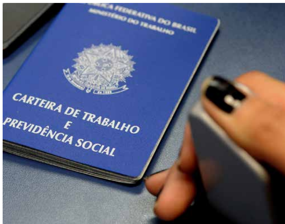
Foram registradas 10.491 novas contratações, o que representa um saldo de 176 novas vagas de emprego geradas em janeiro de 2024