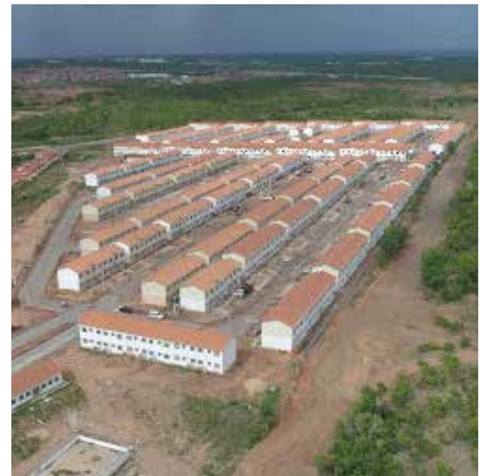
A previsão é de que até o final do mês de março ou início de abril as mil unidades do residencial sejam entregues às famílias

Por fim, o secretário afirma que a previsão é de que até o final do mês de março ou início de abril as mil unidades do residencial sejam entregues às famílias contempladas.