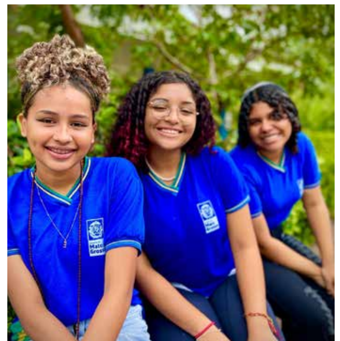
Só poderão acessar as dependências da escola os alunos devidamente uniformizados

de uniformes, entre as unidades escolares de sua circunscrição. Já o gestor da escola é quem deve manter o controle de entrega devidamente assinado pelos pais ou responsáveis e alunos. A portaria também estabelece regras para a conservação e responsabilidade dos uniformes e ressalta a importância da colaboração dos responsáveis legais dos alunos nesse processo. Eles deverão zelar pela higiene, uso adequado e manutenção dos uniformes escolares, incluindo pequenos reparos. Além disso, prevê a possibilidade de estudantes, por motivos religiosos, solicitarem autorização para adaptar as peças do uniforme. A iniciativa visa respeitar a diversidade cultural e religiosa dos estudantes e promover um ambiente