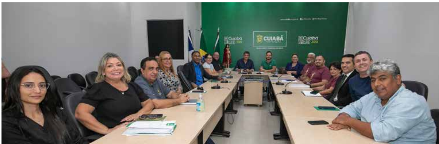
Uma comissão coordenadora foi instituída por meio do Decreto nº 10.059/2024 para organizar todas as atividades