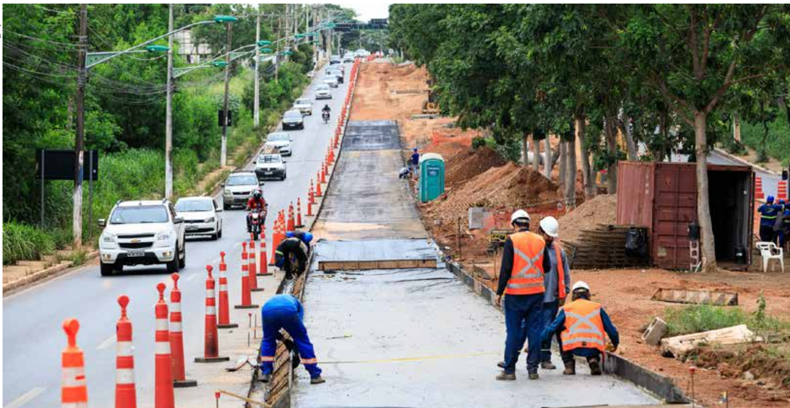
O projeto do novo modal de transporte visa melhorar o transporte público na região e oferecer mais qualidade aos usuários