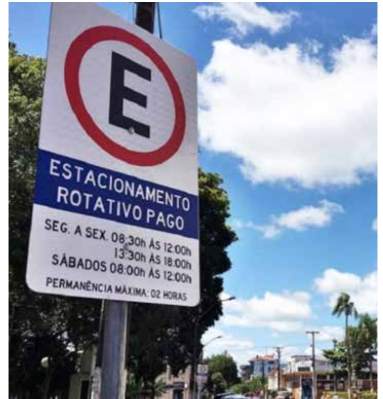
O estacionamento rotativo custa R$ 3,40 a hora/carros e R$ 2 a hora/motos, com a possibilidade de fracionamento para menos