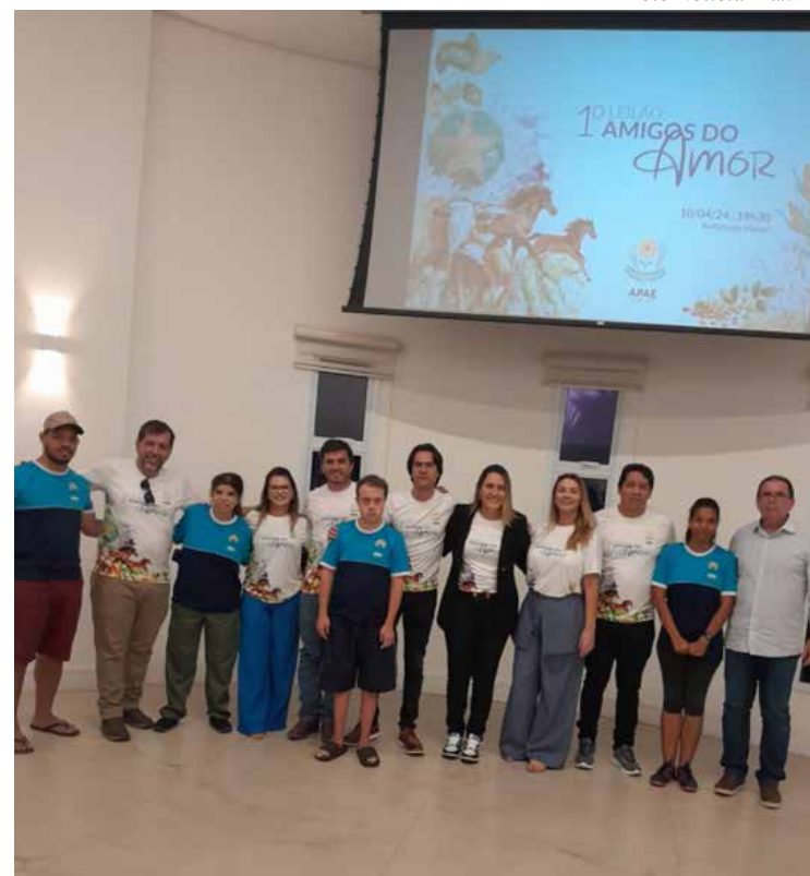
Apae Cuiabá promove leilão beneficente em parceria com diversos amigos e colaboradores