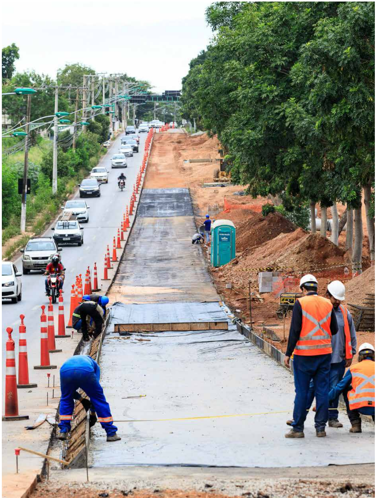
Neste primeiro momento, os trabalhos se concentram em um trecho de dois quilômetros entre a Avenida Leônida Mendes e a Rua Alenquer