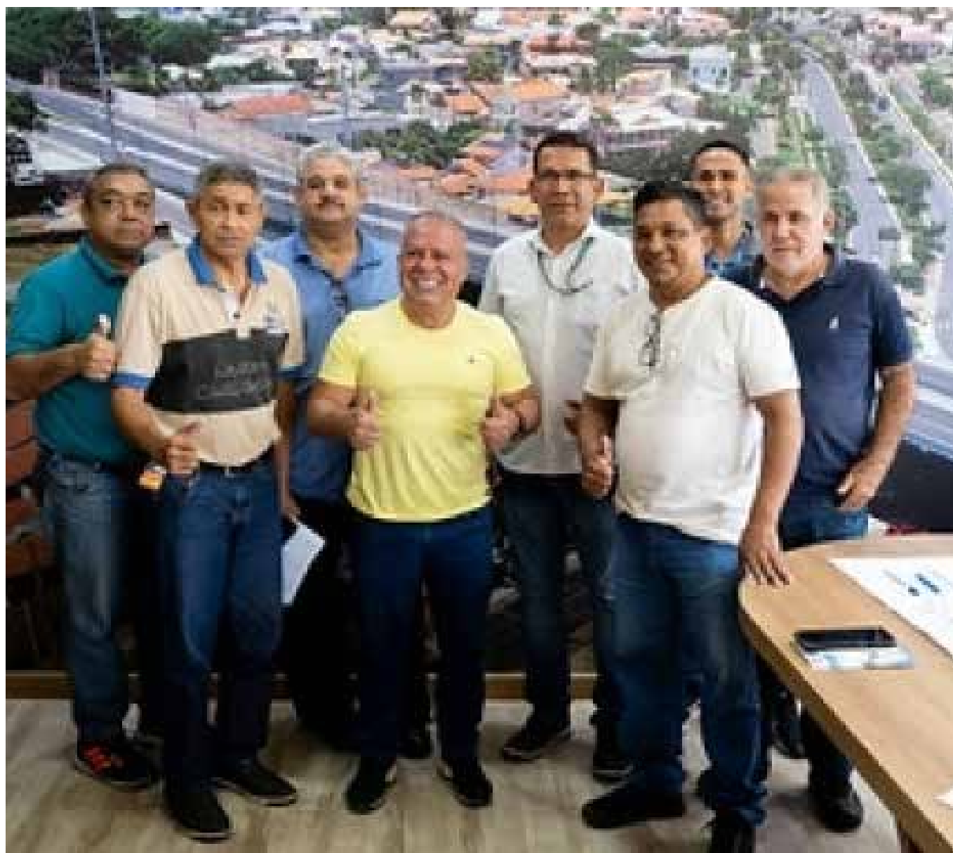
Presidente Chico 2000 alinhou detalhes de audiência pública durante encontro com líderes comunitários