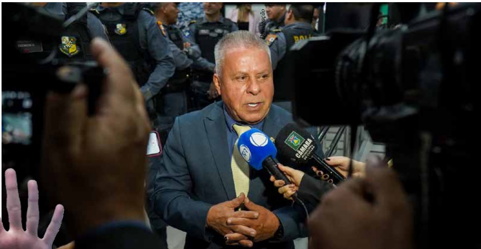
Presidente Chico 2000 alinhou detalhes de audiência pública durante encontro com líderes comunitários