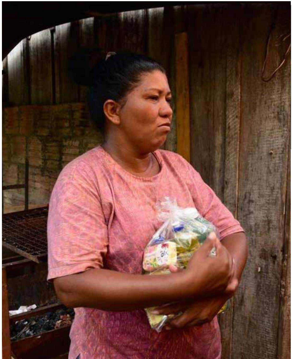
Equipes da Secretaria de Assistência Social estão no município para levar alimentos, leites e ajudar as famílias que ficaram desabrigadas