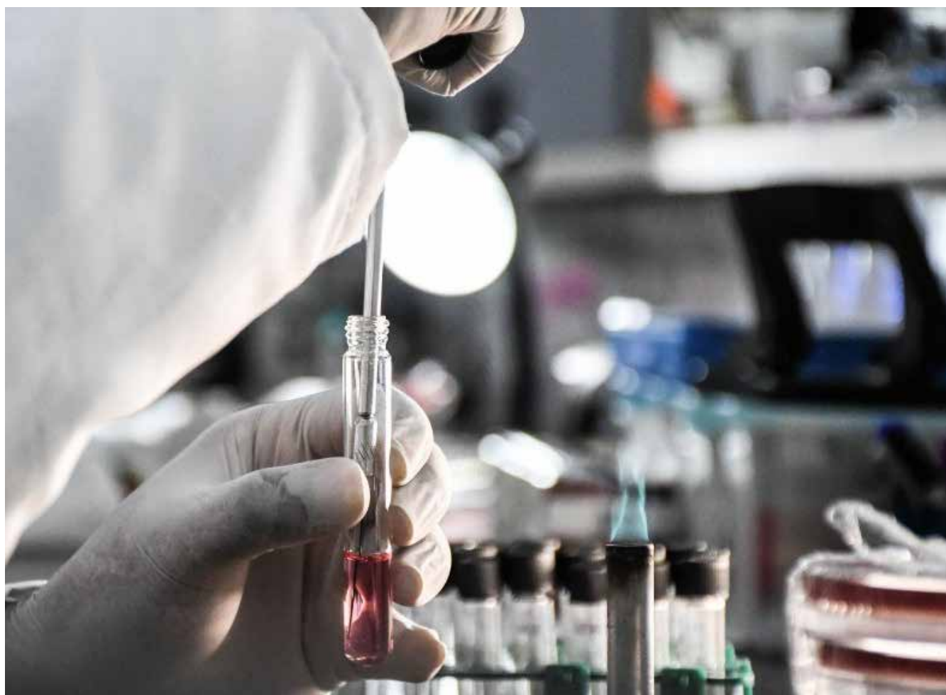
Laboratório de Biotecnologia e Ecologia Microbiana desenvolve método para avaliação de efeitos tóxicos

O coordenador do LABEM conta que a implementação de ensaios ecotoxicológicos no ano de 2018 utilizando um nematódeo de vida livre como modelo, o Caenorhabditis elegans . “Desde então, o LABEM implementou ensaios com outros organismos modelos, como algas ( Chlorella vulgaris e Scenedesmus obliquus ), insetos ( Galleria mellonella e Tenebrio molitor ) e protozoário ( Tetrahymena pyriformis ). Esses ensaios foram implementados para atender demandas de projetos de pesquisa da UFMT, de outras instituições mato-grossenses e de outros estados. Desde então, a equipe do LABEM realizou algumas centenas de análises ecotoxicológicas com esses modelos”, relata.