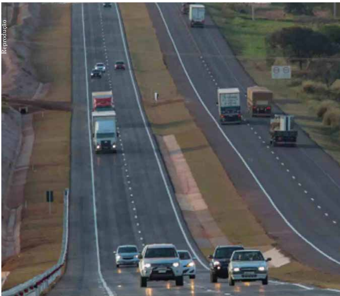
O monitoramento de velocidade média empregada pelos veículos é realizado pela área de Segurança Viária da Rota do Oeste

Diante desse cenário, a Campanha Desacelera se apresenta como um mecanismo para chamar a atenção de quem trafega pela BR-163.