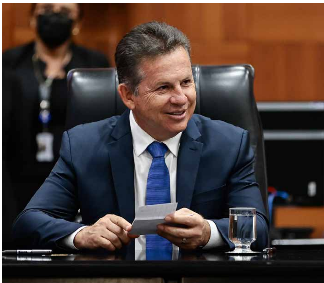
O governador de Mato Grosso, Mauro Mendes durante sessão solene de abertura dos trabalhos da segunda sessão legislativa da 20ª Legislatura na Assembleia Legislativa