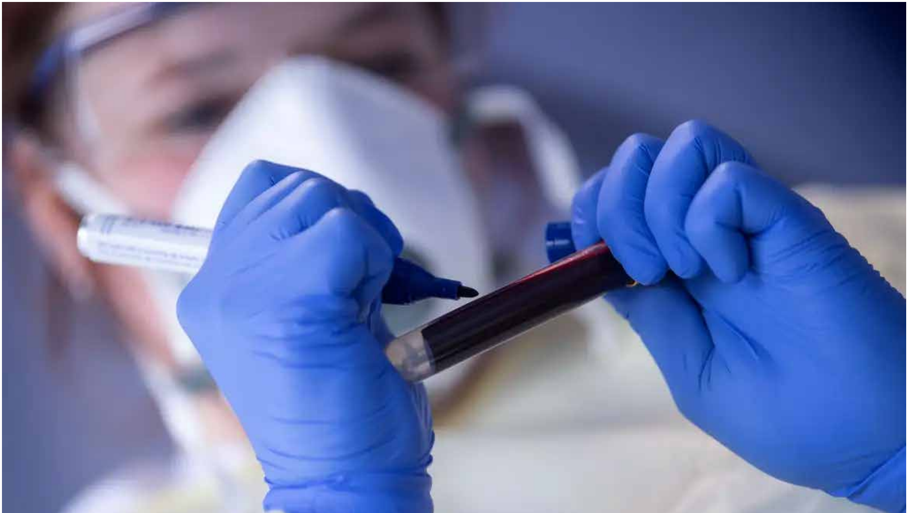
Segundo o painel de covid-19, 1.140 casos estão sendo monitorados e, dessas, 43 pessoas estão internadas