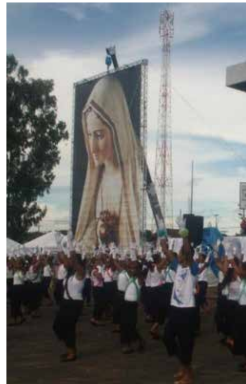
São esperadas cerca de 100 mil pessoas durante os quatro dias de evento