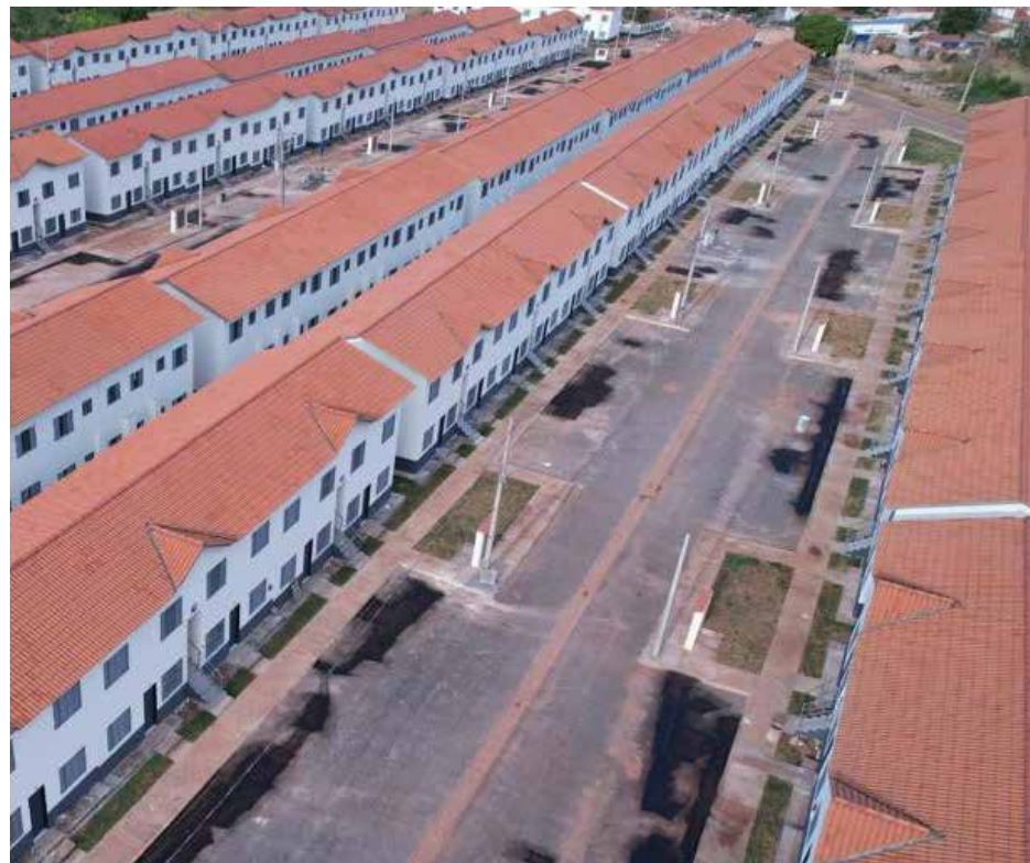
Quase 10% ou 95 pessoas ainda não entregaram a documentação para receberem as chaves do residencial Colinas Douradas