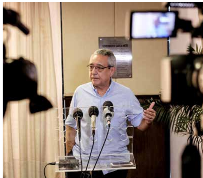
“Conseguimos em cinco anos fazer o que ninguém conseguiu fazer”, destacou o secretário de Estado de Infraestrutura e Logística, Marcelo Oliveira

“Não tivemos uma operação policial dentro da Sinfra onde no ano passado conseguimos demonstrar e cumprimos com o orçamento que nos mandaram, R$ 4,5 bilhões. Isso nunca aconteceu na história de Mato Grosso”, finalizou.