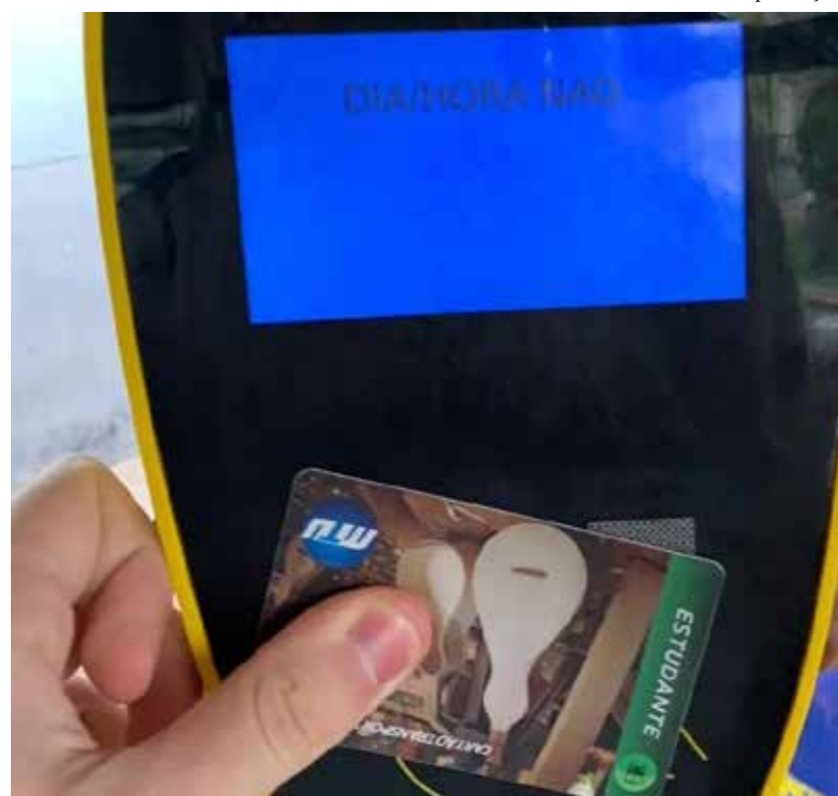
Todos os estudantes matriculados na rede pública ou rede privada de ensino têm direito ao passe livre