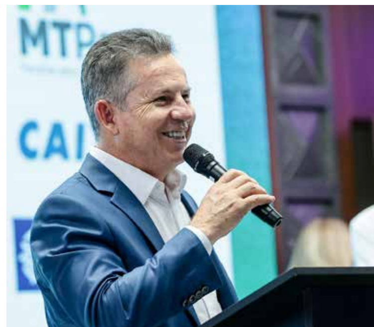
O governador Mauro Mendes afirmou que o novo Sistema Habitacional de Mato Grosso idealizado pela primeira-dama Virginia Mendes facilitará o acesso e a realização do sonho da casa própria