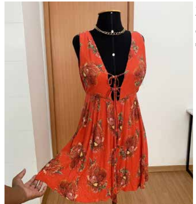
Nas redes sociais as peças estampadas e coloridas fazem parte da identidade visual do negócio

Ao contar sobre a história do seu negócio, a empresária destaca algumas etapas que foram fundamentais para se abrir o brechó: o processo de garimpagem das roupas, escolher e reciclar as peças certas, desenvolver uma identidade visual, contato com o público e a coletividade.