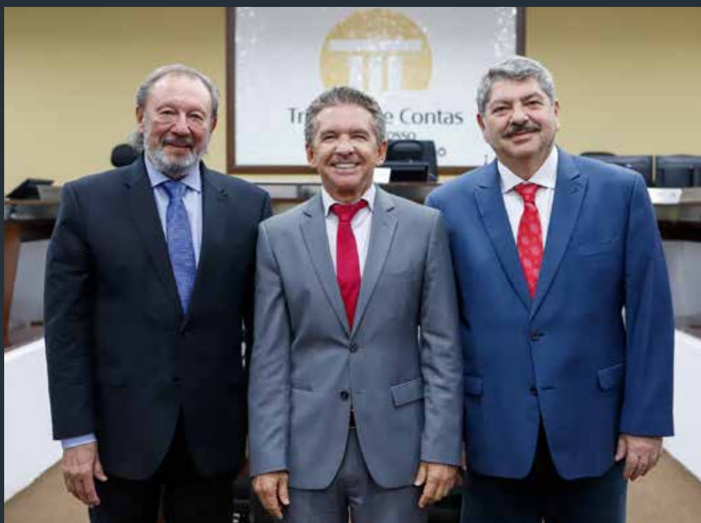
Novo presidente do Tribunal de Contas assumiu com o compromisso de se manter construtor de soluções e de um pacto pelo fim das desigualdades

“Que minha posse seja uma oportunidade de reforçar aquilo que todos nós já fazemos, que é trabalhar por MT”