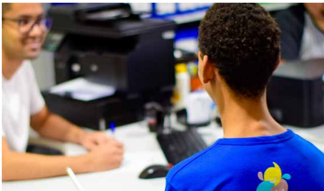
Seduc garante alternativas viáveis e inclusivas para que todos os alunos possam realizar a rematrícula

Ao todo, a rede estadual conta com 328.005 alunos, atualmente.