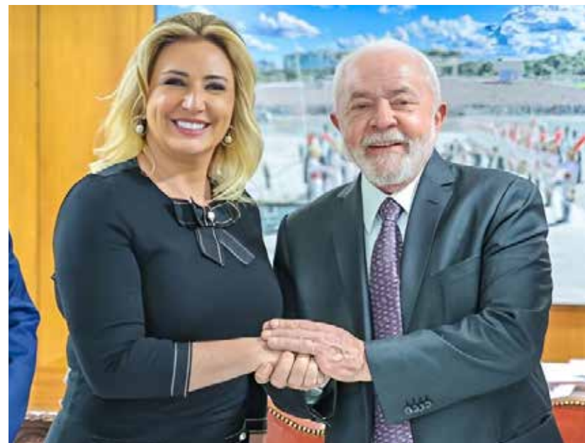
Lula sanciona lei baseada em iniciativa criada pela primeira-dama Márcia Pinheiro