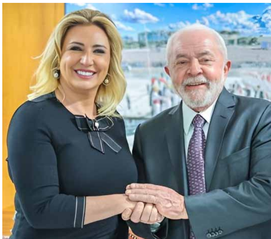
Lula sanciona lei baseada em iniciativa criada pela primeira-dama Márcia Pinheiro

“Essas famílias, de uma hora para outra, se veem na necessidade de oferecer um lar com segurança financeira, emocional e toda estrutura familiar. Esse salário mínimo ajuda em necessidades médicas, escolares e mesmo alimentares.”