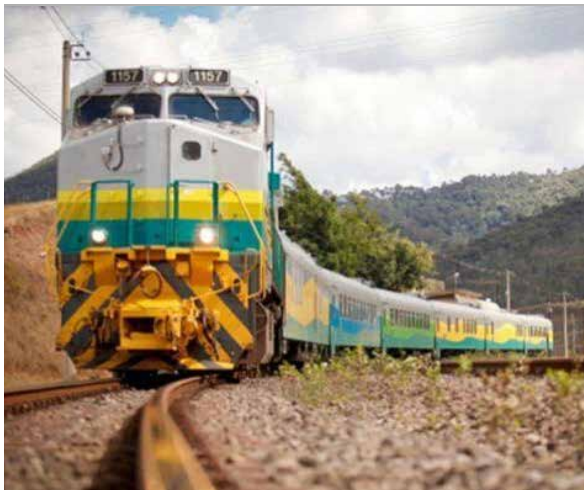
No setor ferroviário, destaque para a construção da Ferrovia de Integração do Centro-Oeste – Fico 1