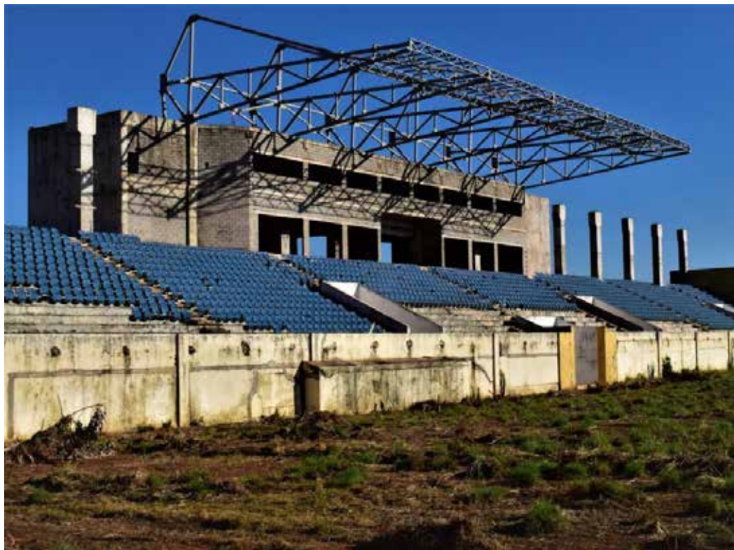
Com a retomada do COT do Pari, a atual gestão do Estado consegue dar andamento a todas as obras originalmente previstas para a Copa do Mundo