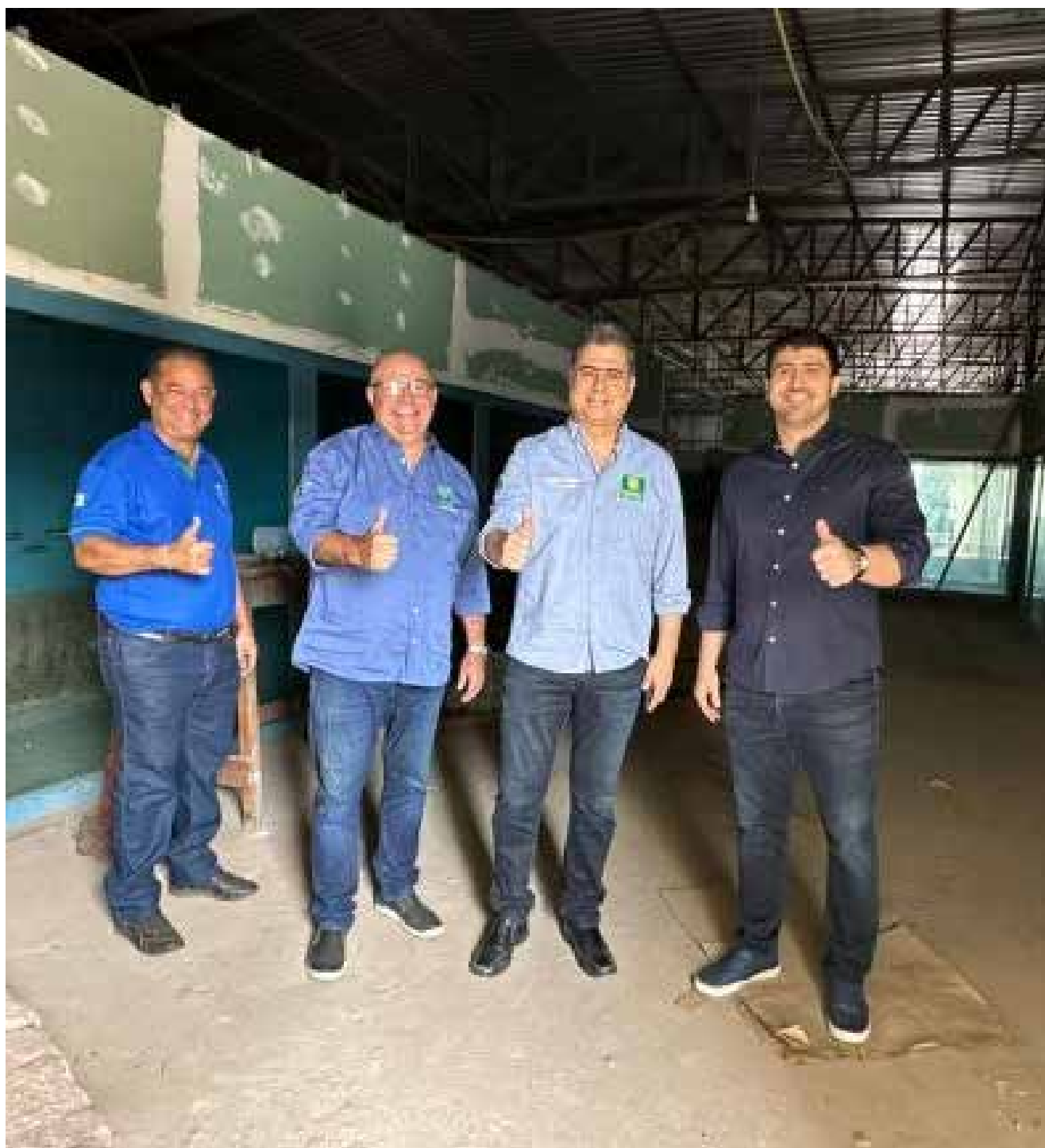
Prefeito Emanuel Pinheiro e deputado Emanuelzinho estiveram visitando o local na semana passada

“É mais uma excelente notícia para Cuiabá e, mais uma vez, Emanuelzinho viabilizou mais uma emenda especial que garantirá a conclusão desta obra, de extrema importância para a população cuiabana. Além de proporcionar prazer em termos de entretenimento, valoriza a região do Porto e a Orla. Estamos investindo nessa área, com a requalificação do Mercado do Porto e a Orla do Porto I. Estamos fazendo um grande investimento nessa região para que Cuiabá cresça voltada para o rio”, declarou o prefeito.