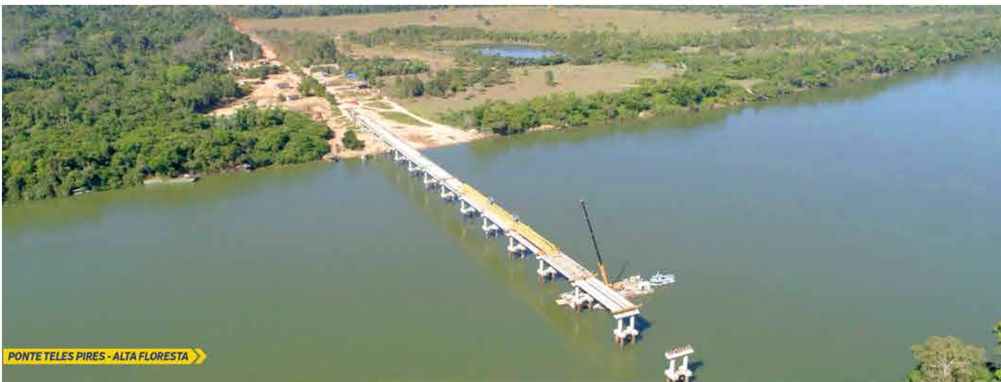
PONTE TELES PIRES - ALTA FLORESTA