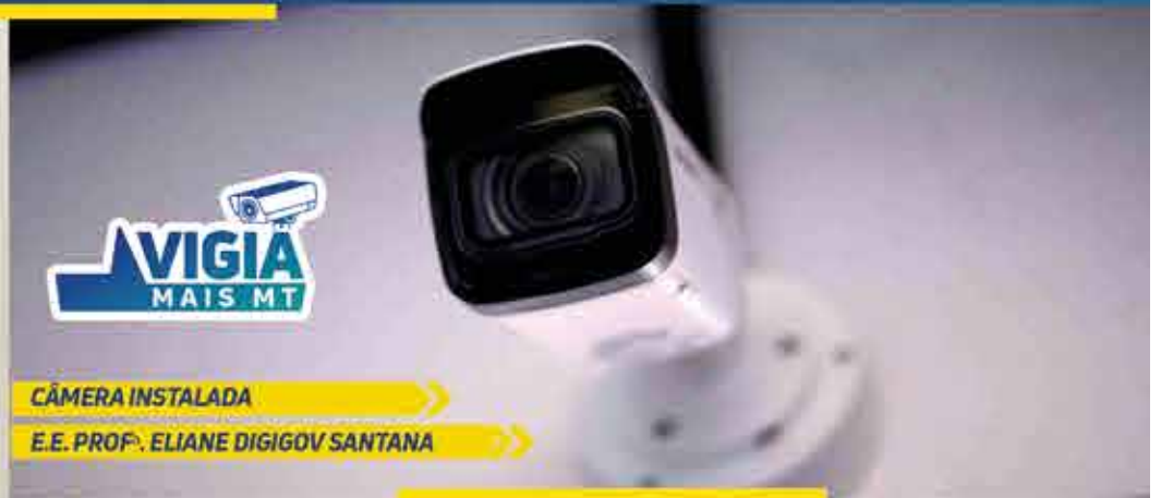
CÂMERA INSTALADA E.E. PROF. ELIANE DIGIGOV SANTANA