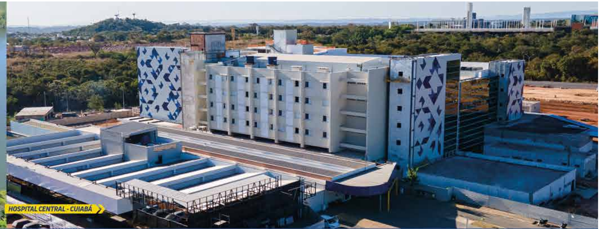
HOSPITAL CENTRAL - CUIABÁ