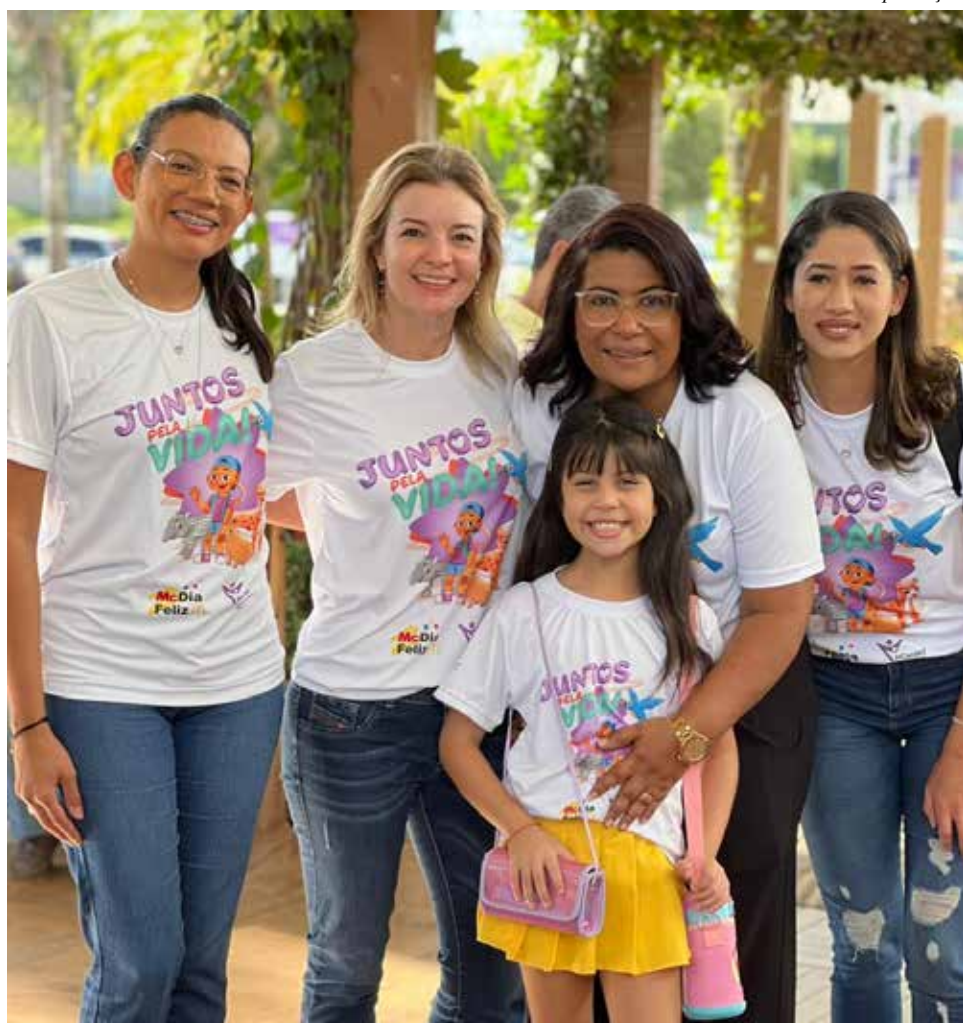
O McDia Feliz é o principal evento beneficente do McDonald's e, atualmente, é uma das maiores mobilizações em prol de crianças e adolescentes no Brasil