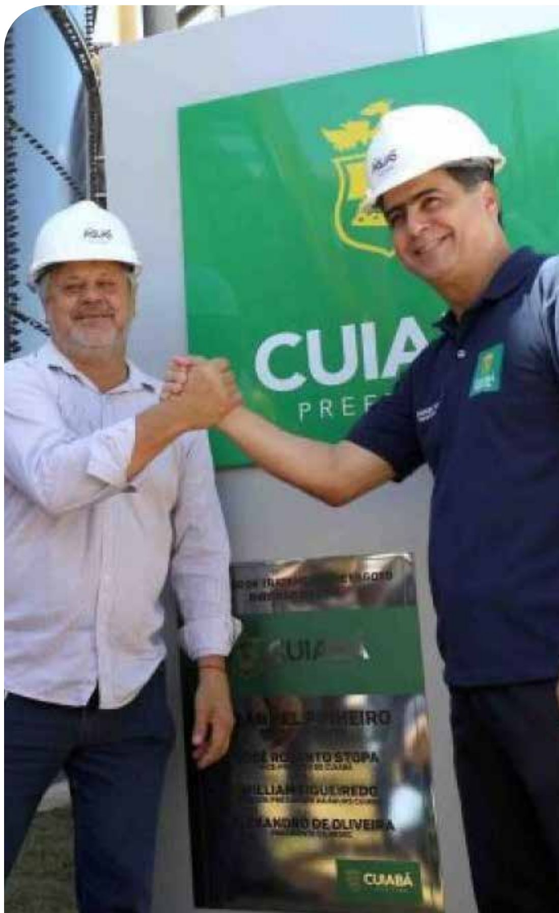
Prefeito Emanuel Pinheiro, ao lançar a nova etapa de obras do Sistema Ribeirão do Lipa de Esgoto