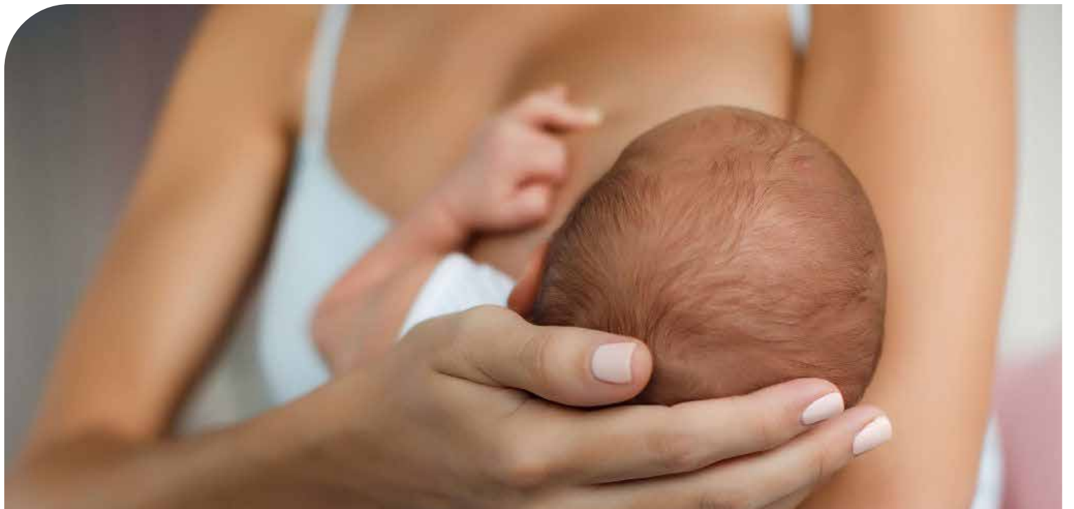
A Organização Mundial da Saúde recomenda que o aleitamento materno deva ser iniciado uma hora após o nascimento e se estender por até 2 anos

De acordo com pediatras especialistas em amamentação, o leite materno sacia a fome, contribui para a melhoria nutricional, reduz a chance de obesidade, hipertensão e diabetes, diminui os riscos de infecções e alergias, além de provocar um efeito positivo na inteligência e no vínculo entre mãe e bebê.