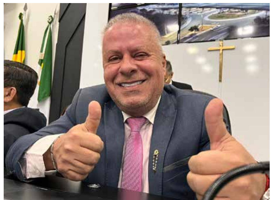
Como destaque da gestão o presidente Chico 2000 ressalta os investimentos em acessibilidade, demanda que partiu de uma comissão composta por servidores da Casa

O presidente da Câmara de Cuiabá, Chico 2000 (PL), fez um balanço de sua atividade parlamentar no primeiro semestre, quando apresentou mais de 665 indicações de melhorias aos bairros, 2 moções de aplausos, 14 projetos de lei, 2 projetos de lei complementar e 21 projetos de decretos legislativos.