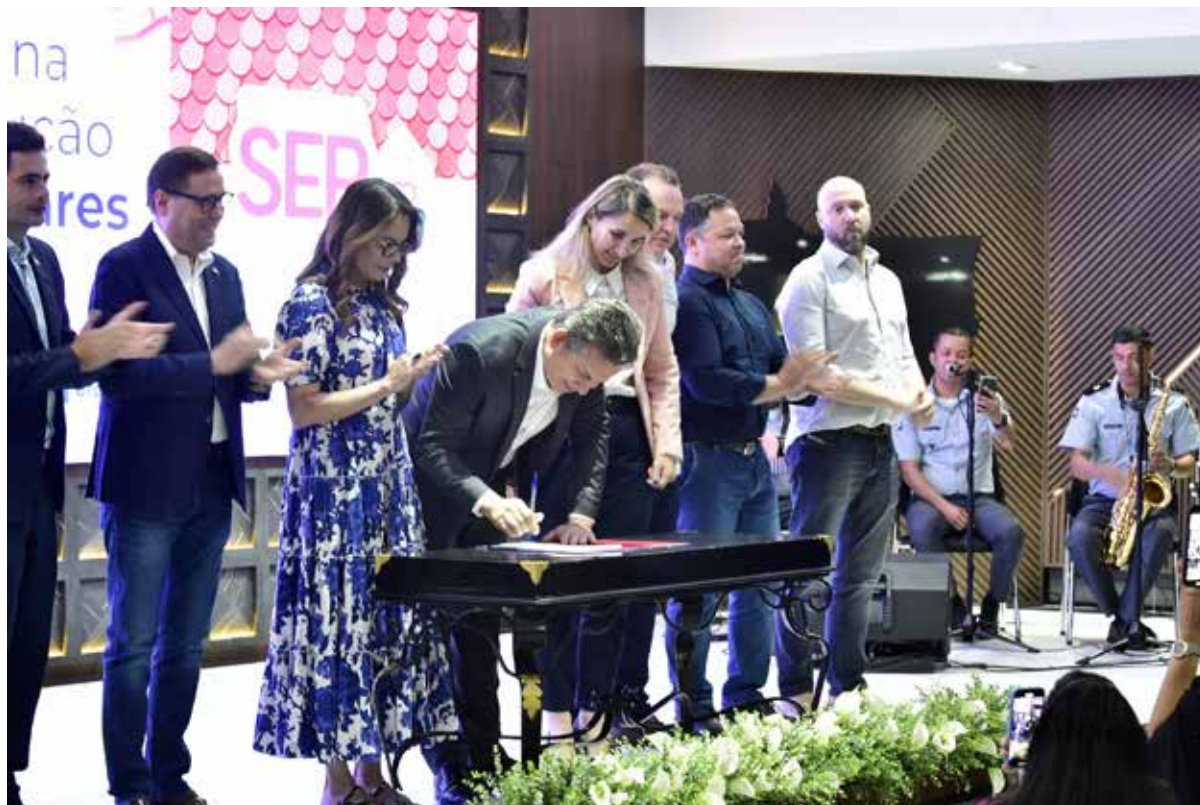
As famílias que possuam renda bruta mensal de até R$ 8 mil poderão realizar o cadastramento no SiHabMT