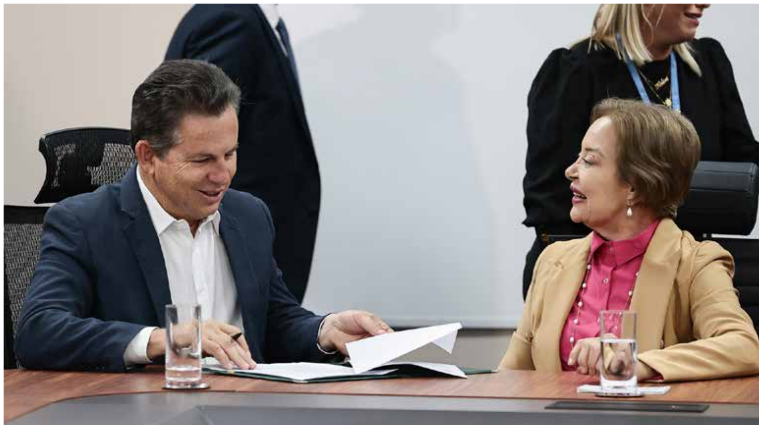
Termo de cooperação de técnica foi assinado pelo governador Mauro Mendes e a presidente do TJMT, desembargadora Clarice Claudino

“O título é um sonho de milhares de famílias em todo o Estado de Mato Grosso. São famílias que compraram suas casas, constituíram um lar, mas que não possuem um documento legal que comprove a titularidade. O título é um direito do cidadão e um dever do Estado”, afirmou o governador.