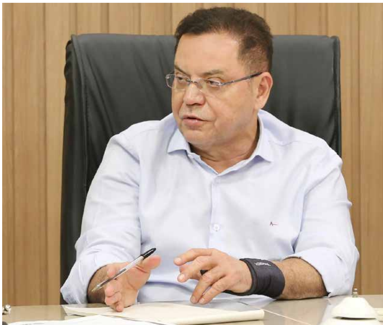
Deputado Eduardo Botelho retorna da licença e reassume presidência da Assembleia Legislativa

O PL ainda cria um tipo de auxílio pecuniário para atender aos pescadores profissionais, já que o projeto prevê a suspensão de suas atividades. O referido benefício teria duração de três anos, contados a partir de 2023, sendo um salário mínimo no primeiro ano, 50% do salário mínimo no segundo ano e 25% do salário mínimo no terceiro ano.