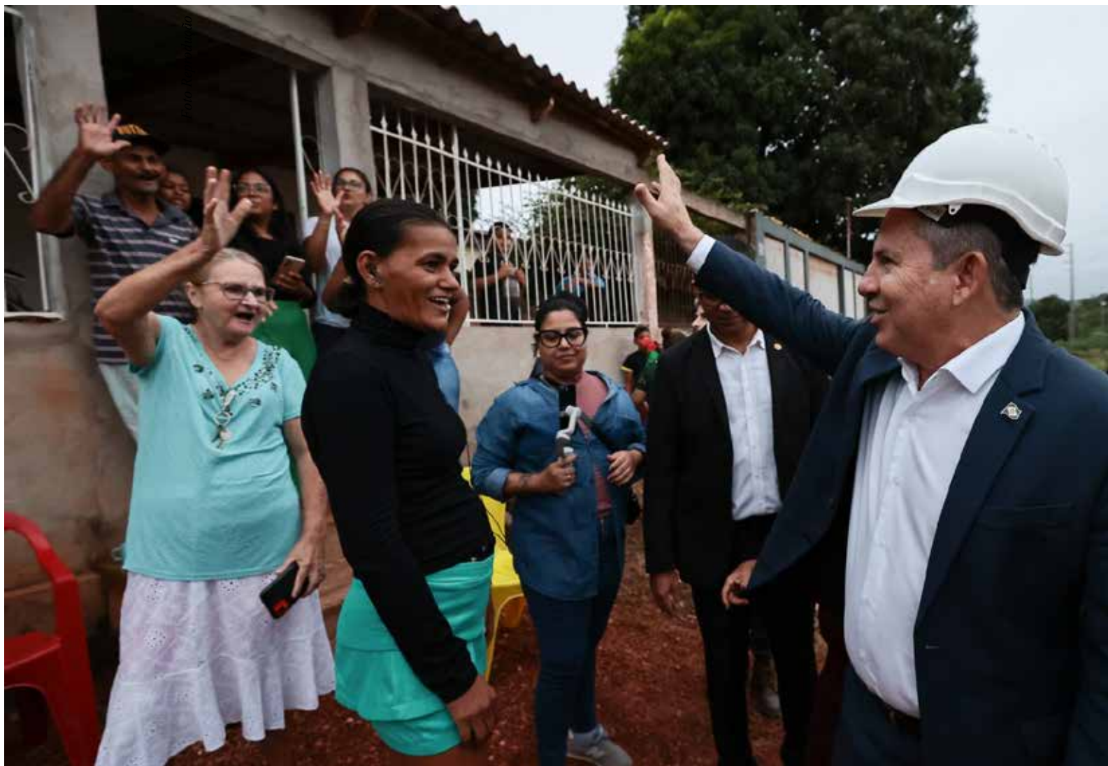
“Vamos acabar com esse sofrimento de conviver com a lama e poeira o ano todo”, relatou Mendes, durante visita a alguns bairros que serão beneficiados

Mauro Mendes registrou que as obras estão a todo vapor agora que o período de chuvas encerrou. “Foi uma longa batalha para que isso pudesse acontecer, mas o importante é que ao final nós estamos aí com as máquinas trabalhando e, se Deus quiser, nos próximos meses vamos entregar esse asfalto para a população desses bairros”, disse.