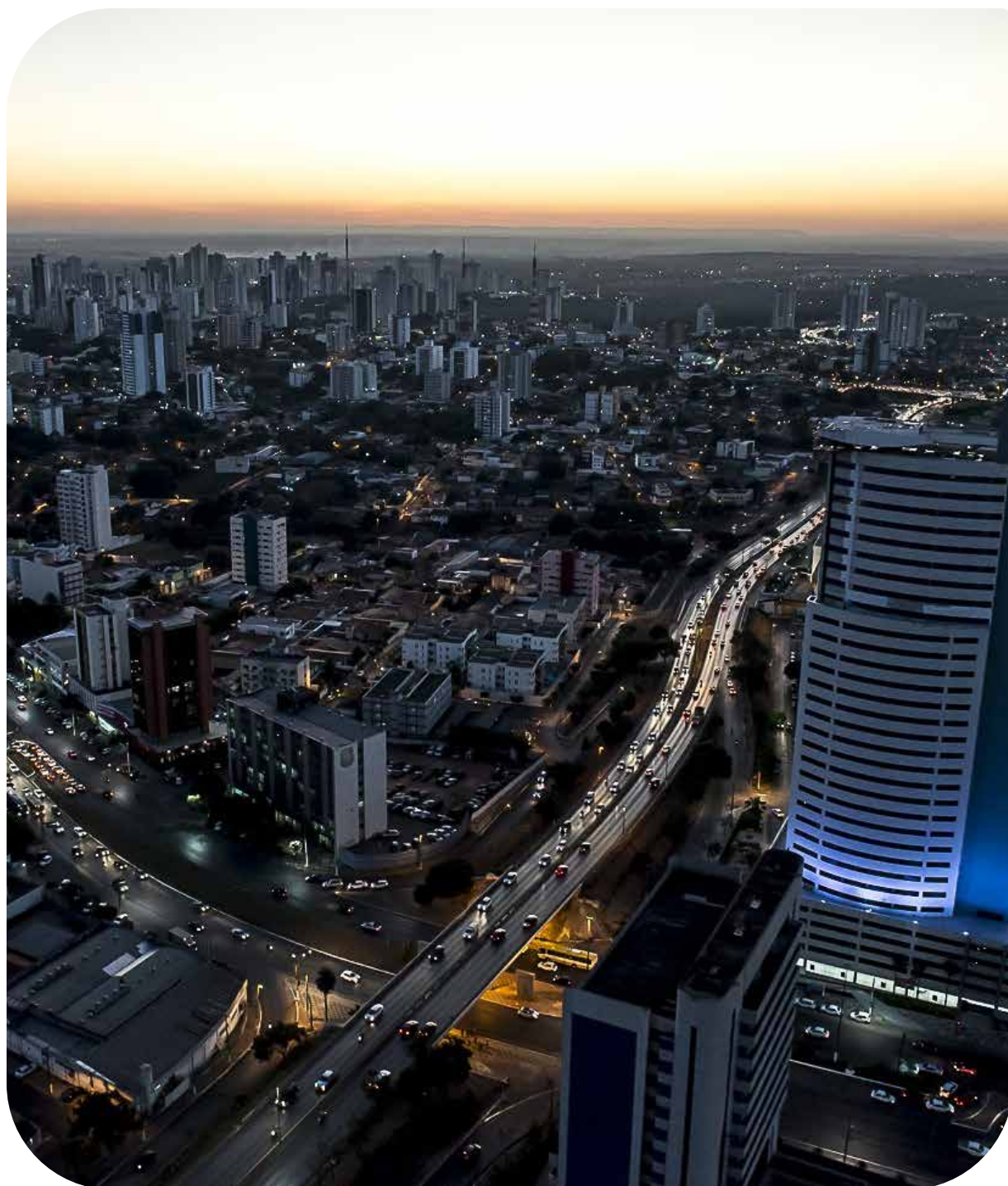
Agência de desenvolvimento global da ONU aponta a capital mato-grossense em 9º lugar no ranking

A área da Educação também tem recebido grandes investimentos, o que tem resultado em Índices de Desenvolvimento da Educação Básica cada vez melhores. A gestão entregou 16 unidades escolares novas, em substituição a antigos prédios, reformou 40 unidades, entre Centros Educacionais Infantis Cuiabano (CEIC), Creches e Escolas Municipais de Educação Básica (EMEB) e escolas do campo (EMEBC), além de cinco quadras poliesportivas e três bibliotecas públicas. Atualmente 15 obras estão em andamento. Em relação ao saneamento básico, Cuiabá é referência nacional.