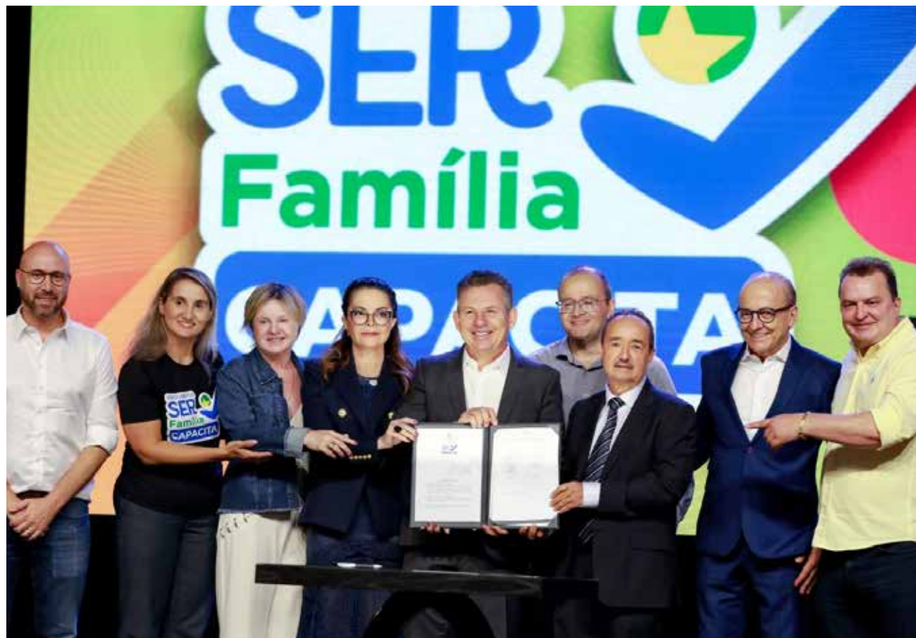
As vagas de qualificação vão ajudar a diminuir o déficit de vagas não-preenchidas, já que os cursos são voltados às 75 profissões

porém, na maioria das vezes não consegue pagar pela qualificação. Quando começamos a tratar sobre uma maneira de ajudar na capacitação profissional, a primeira coisa que veio à minha mente foi: tem que ser algo que de fato atenda tanto a necessidade das pessoas quanto do município em questão, e aí está o maior programa de capacitação profissional da história do nosso estado", pontuou ela. Durante o evento, foram apresentados os requisitos necessários para que o cidadão possa ser beneficiado pelo Programa Ser Família Capacita. São eles: ser preferencialmente beneficiário do Projeto Ser Família; mulheres em situação de vulnerabilidade social; profissionais empreendedores em busca de qualificação para geração de renda; jovens em busca do primeiro emprego; profissionais desempregados em busca de recolocação profissional; pessoas com deficiência; pessoas beneficiárias de políticas de inclusão social; pessoas desempregadas; comunidades tradicionais (indígenas, quilombolas e ribeirinhas); egressos do trabalho análogo ao escravo; e egressos do sistema prisional.