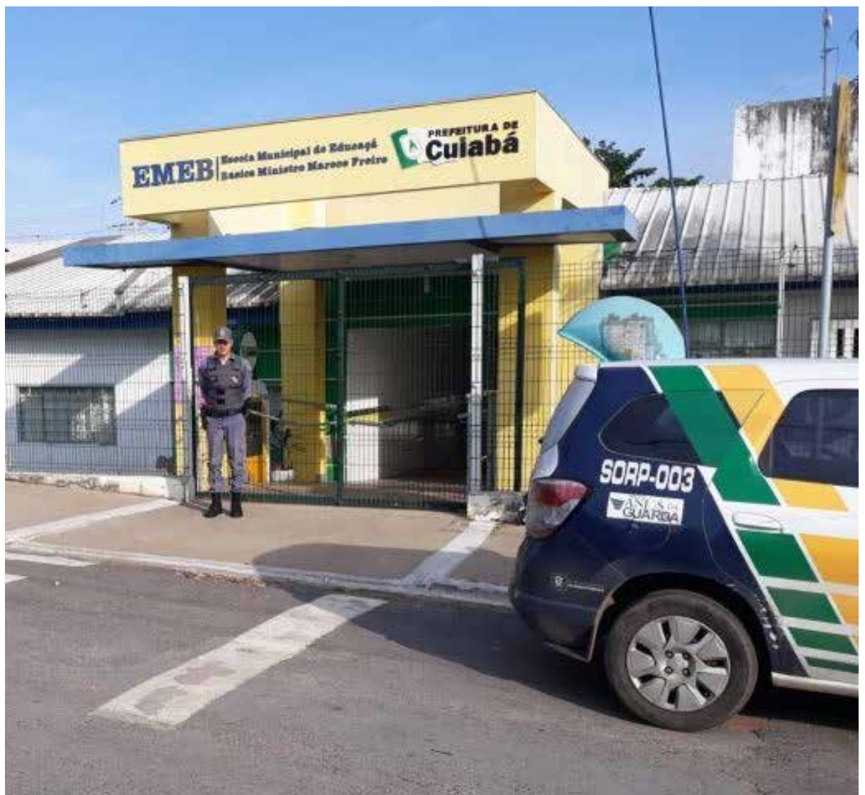
As alegações dos estudantes investigados por propagar mensagens falsas que causaram pânico e tumulto em escolas do estado era a de que se tratava de apenas uma brincadeira ou para impedir a realização de aulas

A orientação é que quem receber vídeos, fotos e mensagens de ameaças ou supostos ataques, que envie o material ao perfil oficial da Polícia Civi ( http://@policiacivil_mt ) nas redes sociais ou pelo WhatsApp para denúncias (65) 99973-4429, além do 197 ou 181.