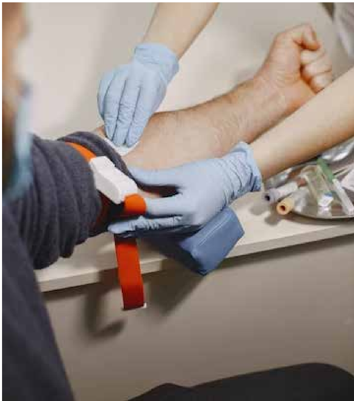
A doação de sangue é um gesto solidário de doar uma pequena quantidade do próprio sangue para salvar a vida de pessoas que se submetem a tratamentos e intervenções médicas

Homens podem fazer até quatro doações anuais, com prazo de dois meses entre cada uma. Já as mulheres podem fazer três doações por ano, com um espaço de quatro meses. Os candidatos precisam ter idades entre 16 e 69 anos, 11 meses e 29 dias. Em cada coleta é retirado um volume aproximado de até 450 ml de sangue. Recomendam-se, nas primeiras horas pós-doação, descanso e evitar atividade física e ingestão de bebida alcoólica.