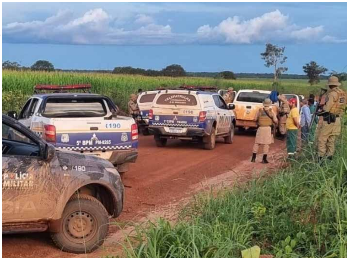
Foi criada uma força-tarefa composta por forças policiais do Tocantins, Mato Grosso, Minas Gerais, Pará e Goiás para caçar os criminosos

A s buscas continuam. Foram formados barreiras e bloqueios em várias regiões do estado para evitar que eles cheguem em alguma rodovia e fujam novamente.