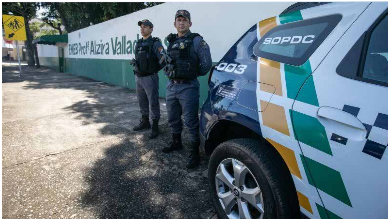
Governo e Prefeitura aumentaram as rondas escolares, garantindo maior segurança aos estudantes