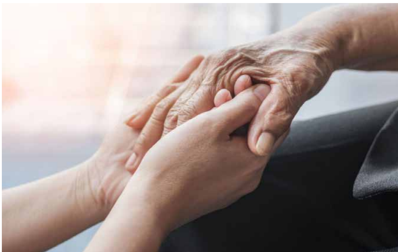
Trata-se de uma doença que leva à degeneração celular associada ao processo de envelhecimento

O DIAGNÓSTICO DO PARKINSON É FEITO APENAS COM EXAMES DE SANGUE E IMAGENS? Mito. A identificação do Parkinson decorre de uma boa análise clínica baseada no histórico do paciente. Ainda não existem exames específicos de rastreio da doença, mas é possível que o médico recorra à ressonância magnética para complementar o diagnóstico, pois conseguirá detectar alterações morfológicas no cérebro. Esse recurso também é uma forma de exclusão de outras condições.