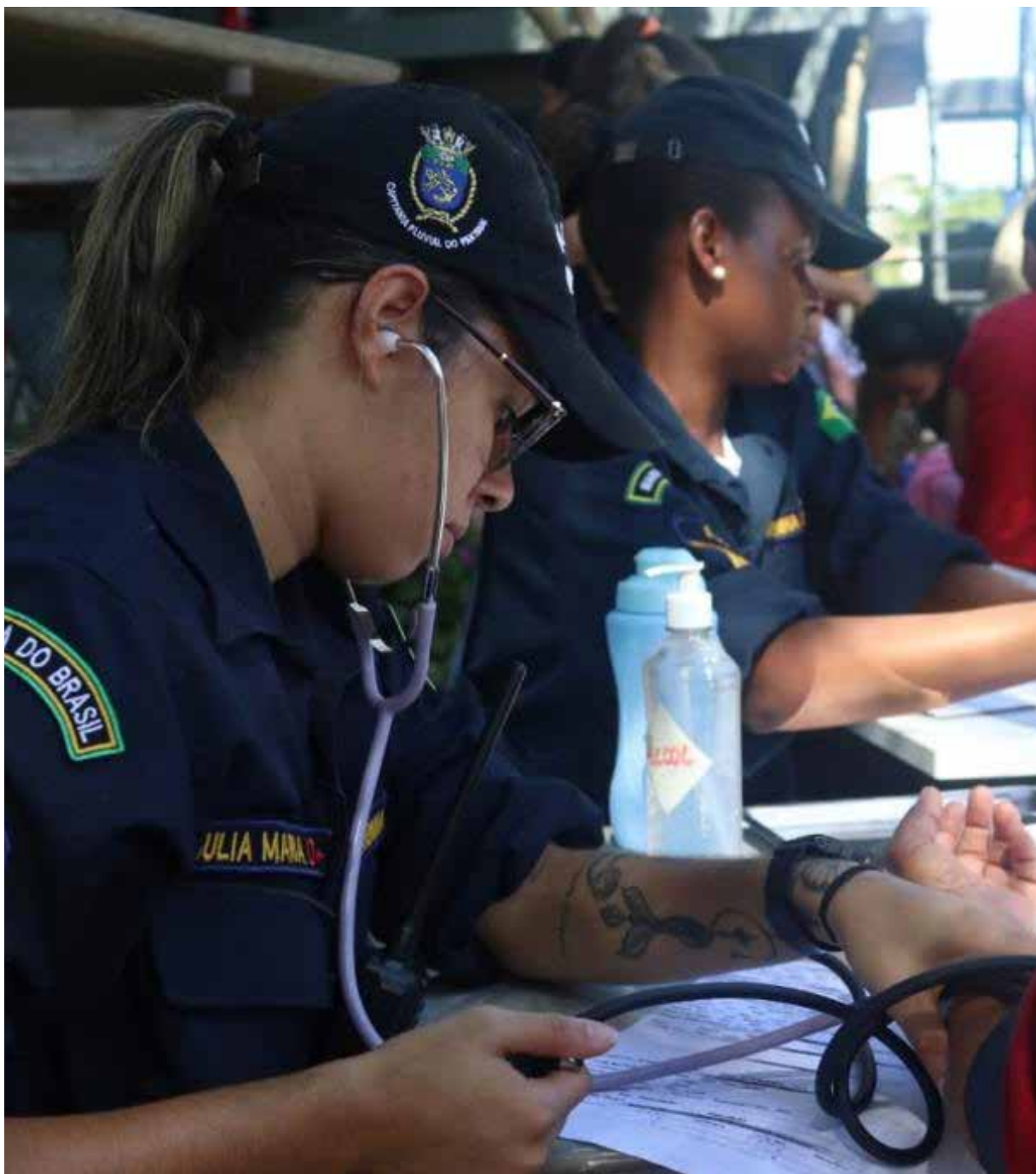
Projeto conta com embarcações da Marinha do Brasil, com a estrutura para atendimento nos rios e a prestação de serviços de saúde

estar munido de sua cidadania, com direitos que são garantidos pela Constituição Cidadã de 1988.