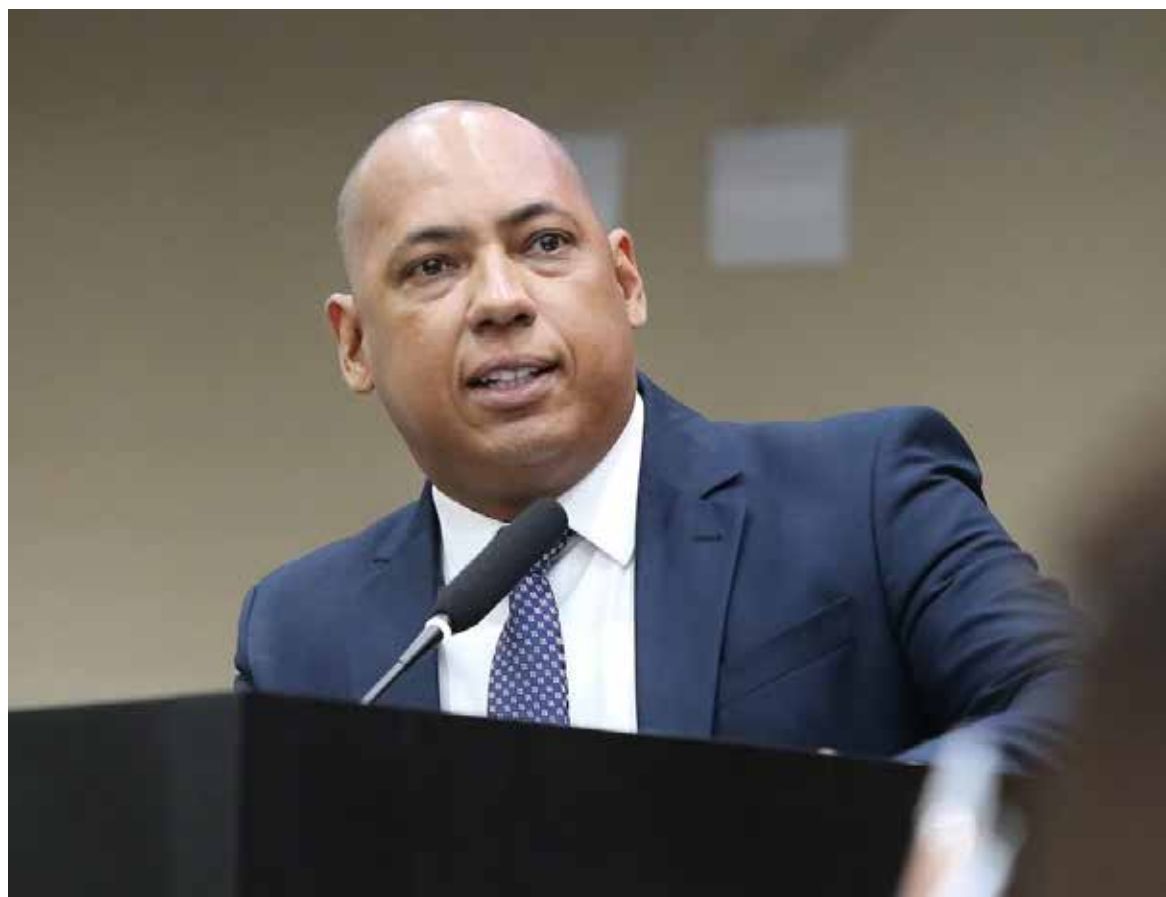
Segundo o parlamentar, ele não foi surpreendido do parecer de permanência no cargo