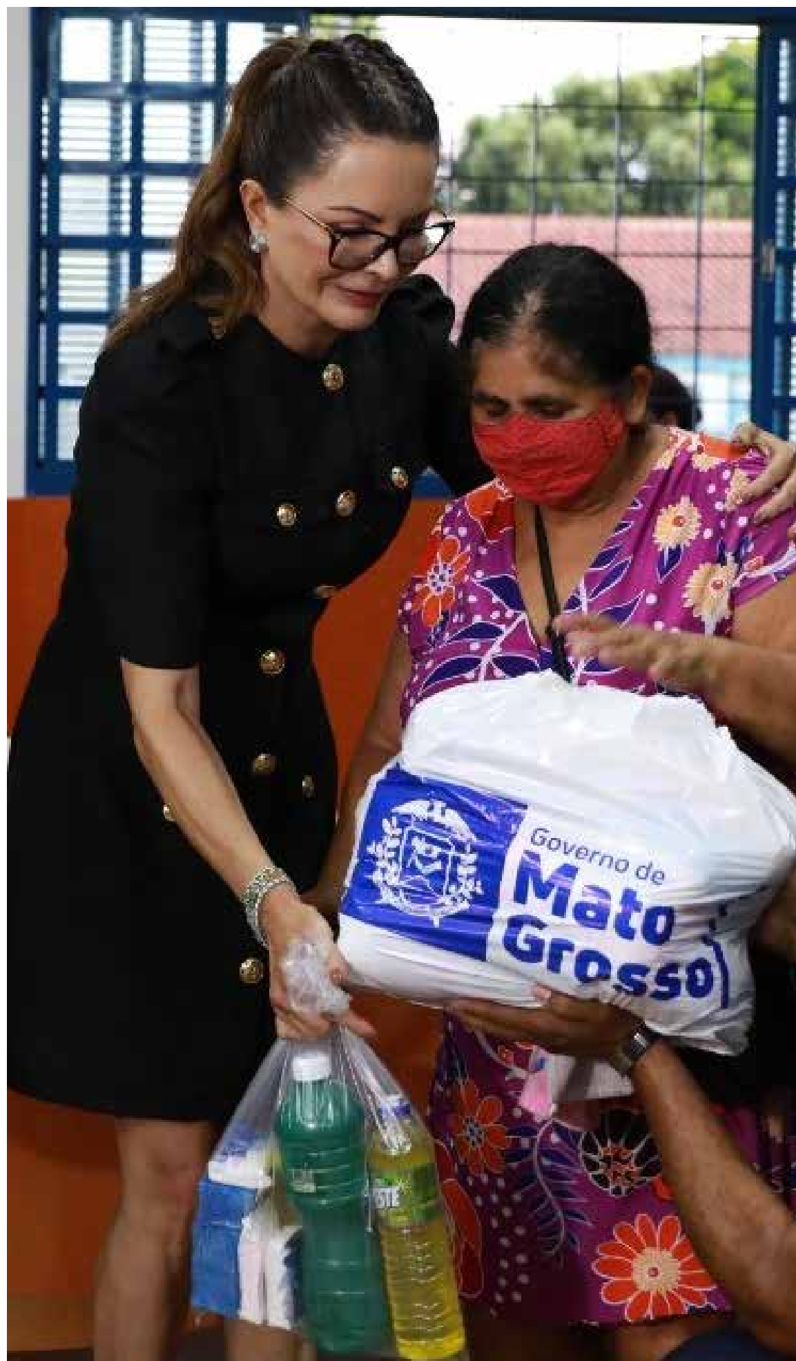
Além do programa SER Família Solidário, a primeira-dama do Estado garantiu a continuidade de outras ações, como é o caso do programa Aconcheço