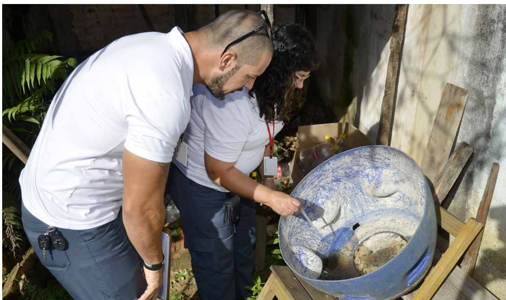
Secretaria de Saúde alerta para importância de reforçar o combate à dengue durante período chuvoso

A conscientização da população em medidas preventivas é apontado como meio mais eficaz para evitar a proliferação do mosquito e a formação de criadouros do Aedes aegypti , transmissor das doenças. Se faz necessário inspecionar os ambientes externos e internos de casa, manter a caixa d'água fechada e limpa, cuidar do lixo e dos vasos de plantas, trocar diariamente a água dos recipientes dos pets, colocar água sanitária nos ralos e tampá-los após secar e evitar a exposição de qualquer objeto que concentre água parada.