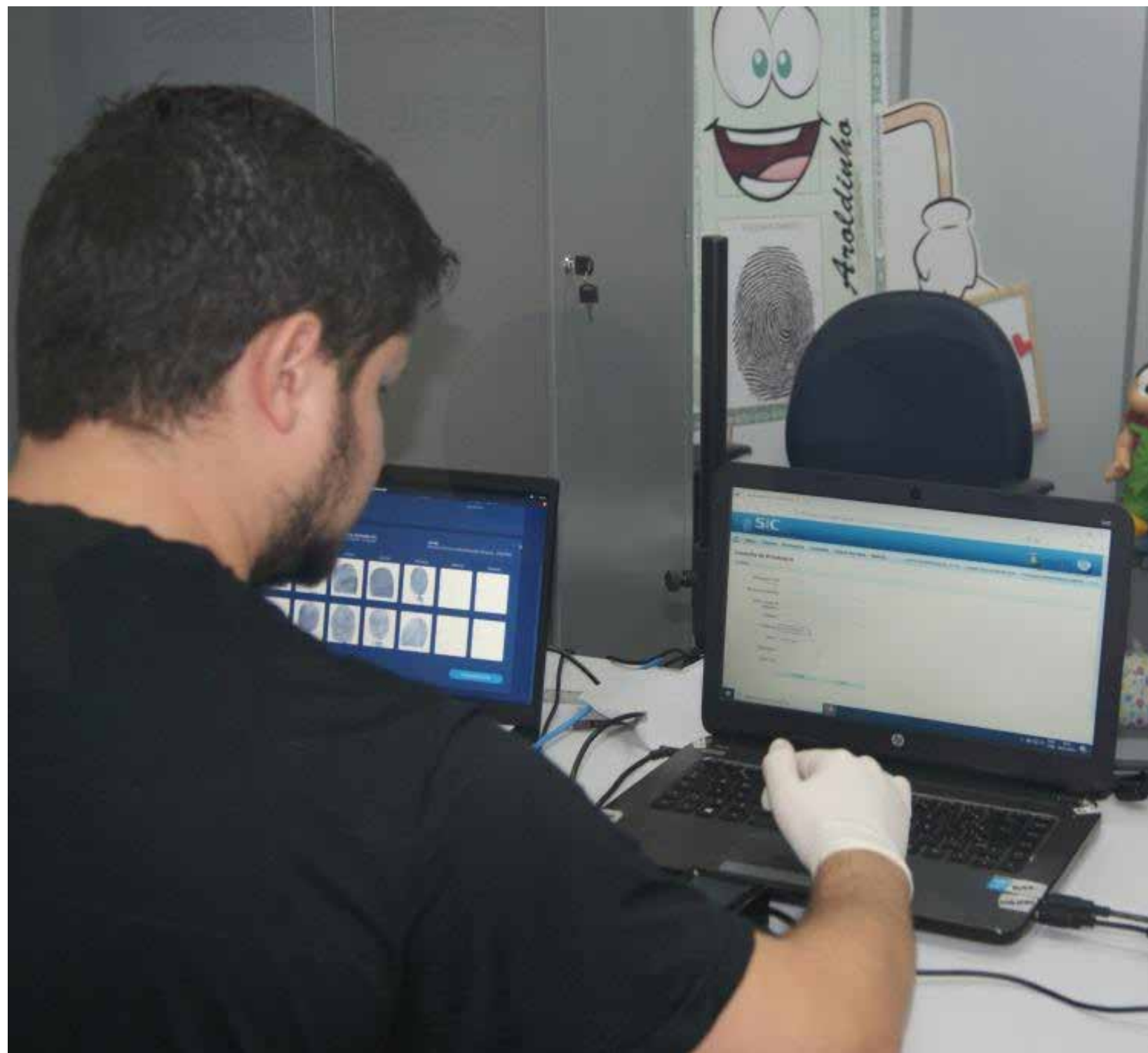
A coleta de impressões digitais é feita por um scanner de alta definição na solução de identificação biométrica Infant.Id

O espaço infantil está localizado na sede da Politec, na Diretoria Me-