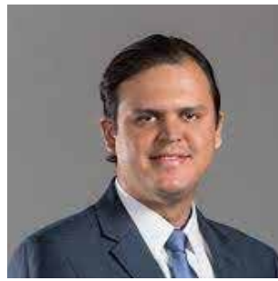
THIAGO SILVA (MDB)

Empresário e deputado estadual, 62. Foi secretário de Estado de Indústria, Comércio e Turismo no governo Dante de Oliveira; atuou como deputado em três ocasiões, na condição de suplente e assumiu uma vaga de deputado em 2019. Assumirá o segundo mandato.