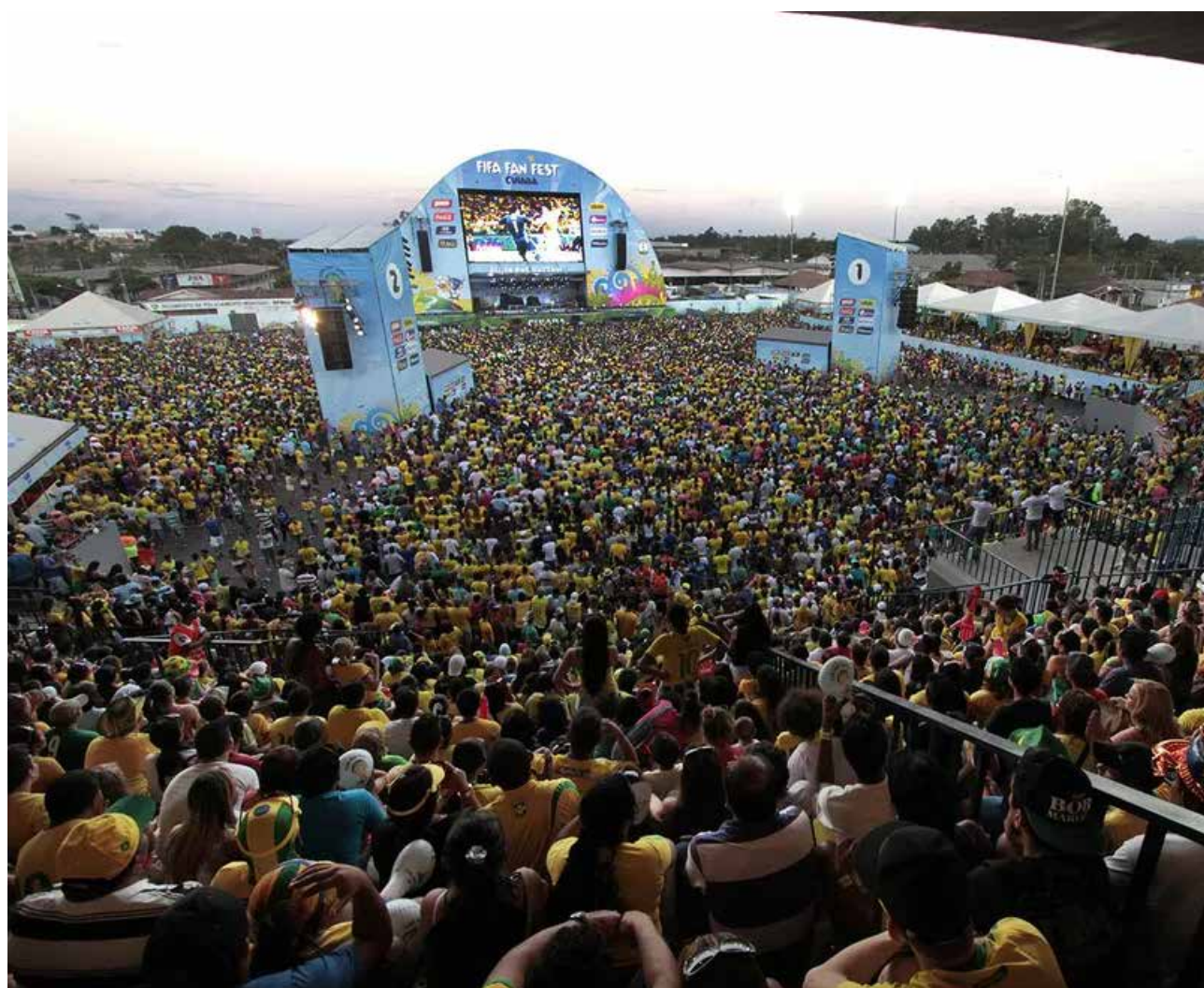
Cuiabá é uma das cinco capitais brasileiras selecionadas e autorizadas pela FIFA a disponibilizar um espaço cultural para a transmissão dos jogos