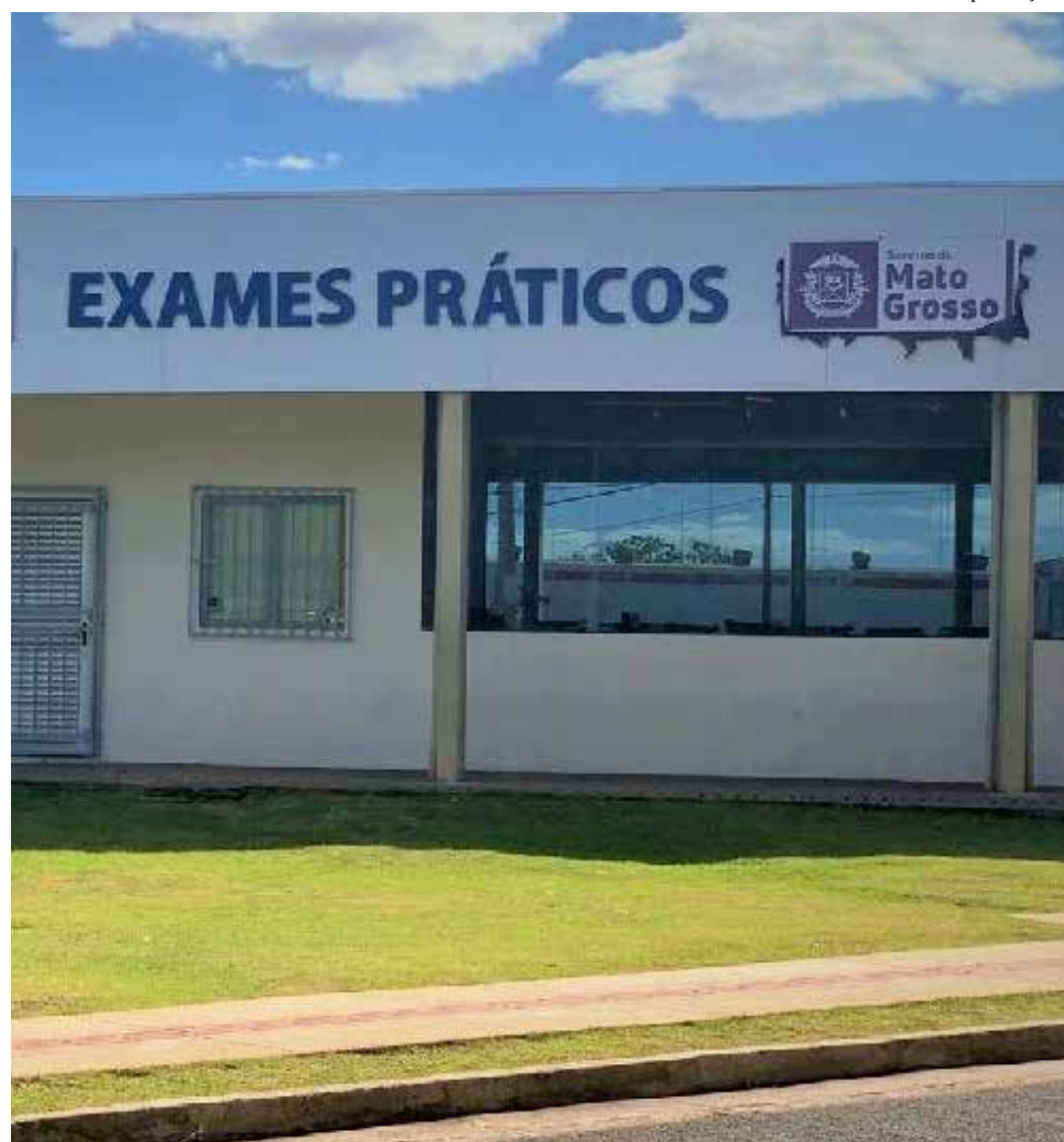
Detran intensificou a aplicação das provas práticas de direção para atender as pessoas que tiveram os processos abertos em 2019 e 2020

Os processos ficaram atrasados devido à pandemia, quando o serviço foi suspenso.