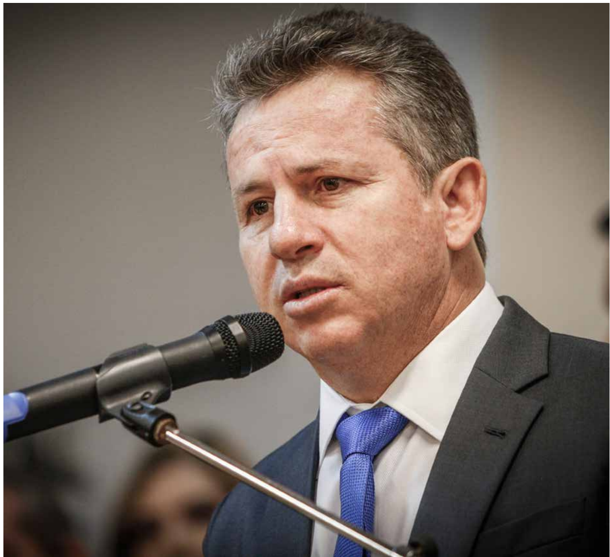
com respeito ao meio ambiente, e que põe em prática ações concretas e metas ousadas de redução de carbono

Um exemplo dessa potencialidade é que, mesmo sendo o maior produtor de soja, milho e algodão do país, Mato Grosso pode expandir e muito sua produção sem precisar derrubar novas áreas, por meio da conversão da área de pastagens e agricultura regenerativa.