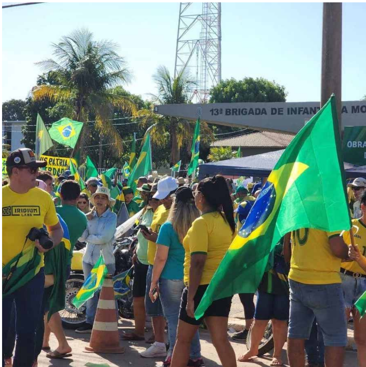
Em Cuiabá o protesto se localiza em frente da 13ª Brigada do Exército Brasileiro

Por sua vez, os comandantes das Forças Armadas disseram que defendem que os direitos dos brasileiros sejam respeitados, tanto o direito de manifestar o livre pensamento, como também o direito de transitar pelo país.