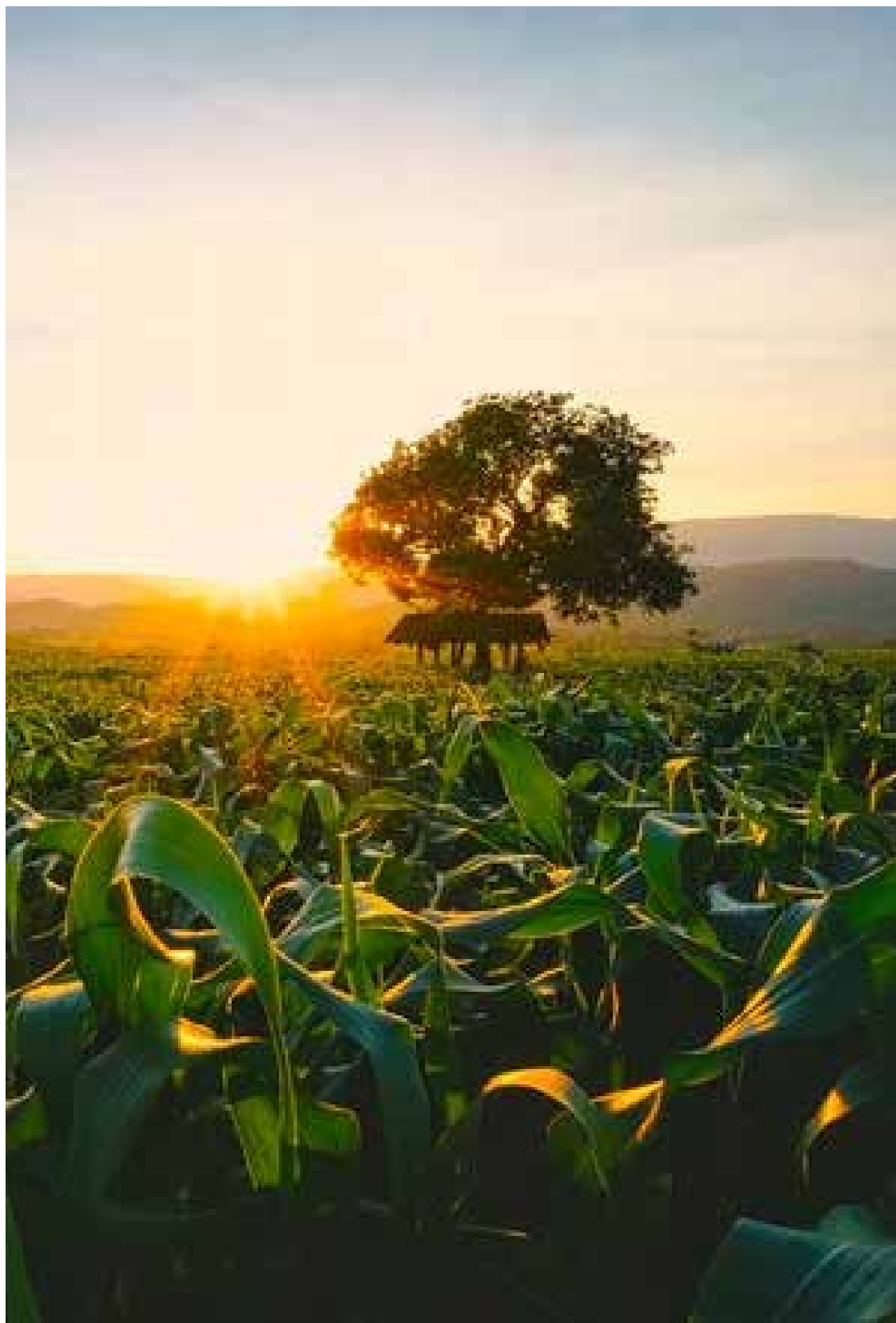
Os dados mostram que o estado detém o maior índice entre as demais unidades da federação

Além de Mato Grosso, o Ceará (3,7%), Pernambuco (2,0%) e Região Nordeste (0,6%) apresentaram bons resultados. Considerando somente o mês de setembro, na comparação com o mês anterior, a variação da produção industrial de Mato Grosso foi negativa em 0,4%.