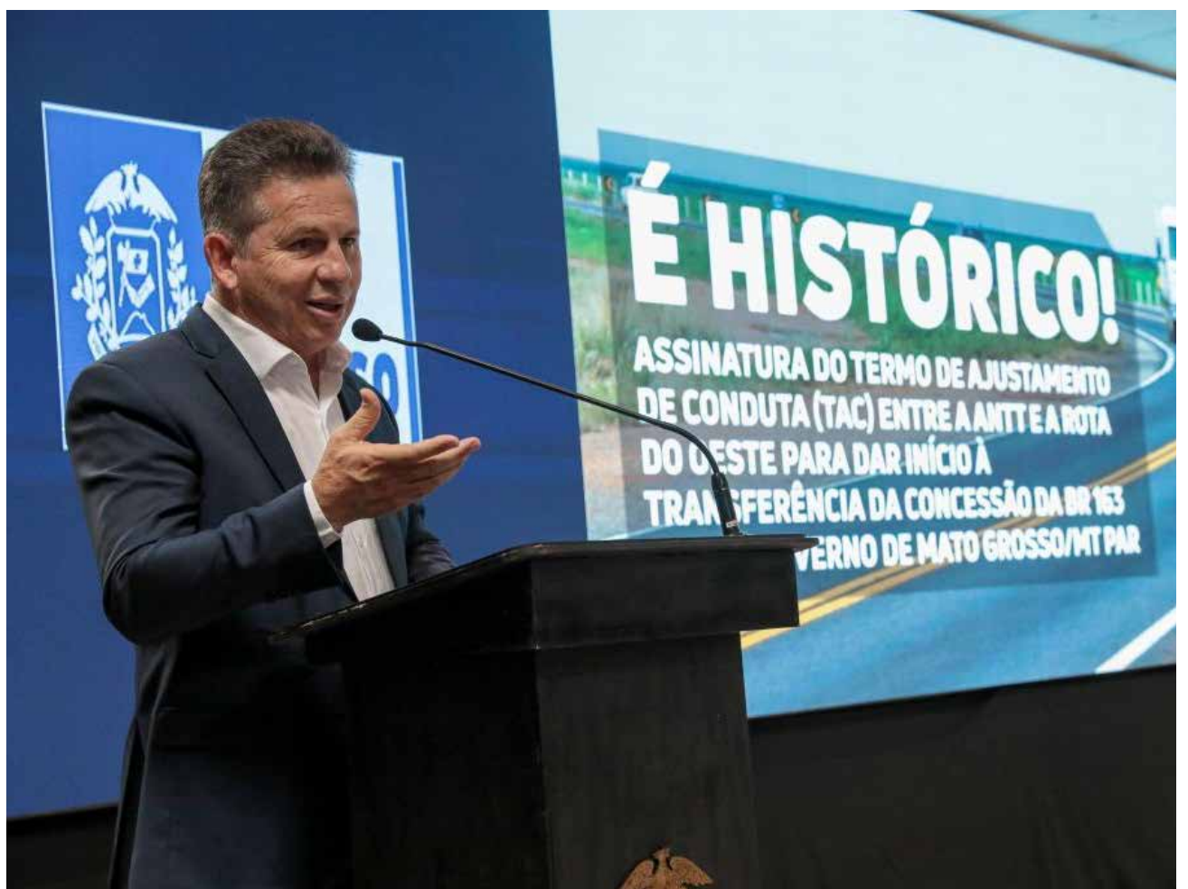
Mauro ao assinar o entre a ANTT e a Concessionária Rota do Oeste, um dos passos principais para que a concessão da BR-163 seja transferida ao Governo de Mato Grosso

“Nosso desafio é colocar Mato Grosso entre as dez melhores educações do país. Vamos também investir em ampliar escolas militares e escolas em período integral”, adiantou.