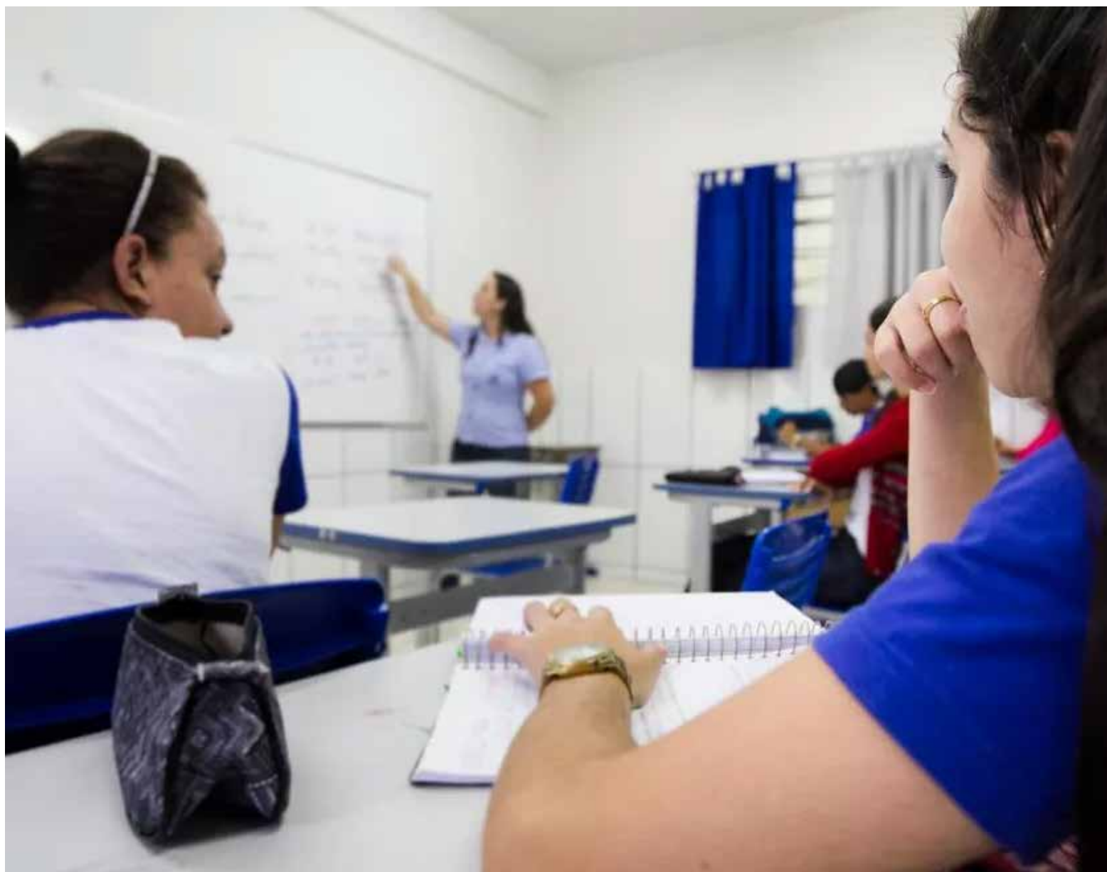
As matrículas devem ser feitas nas secretarias das unidades escolares