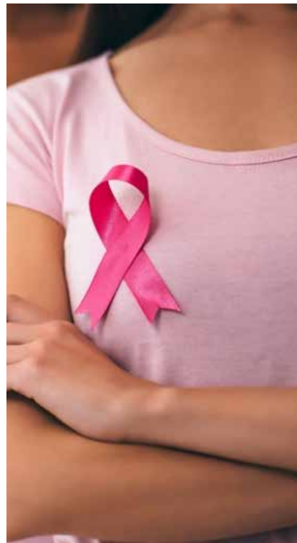
O movimento 'Outubro Rosa' tem o objetivo de chamar a atenção para essa doença e à necessidade da realização de exames rotineiros