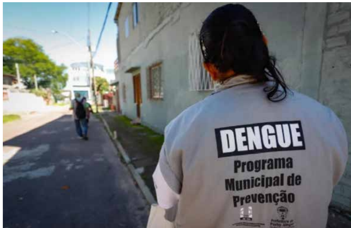
Secretaria Municipal de Saúde chama atenção para necessidade de se adotar medidas preventivas

Todos os moradores do Pedra 90 recebem as visitas com processo de orientação e prevenção, mas precisamos que a população colabore com o serviço público”, pontuou.