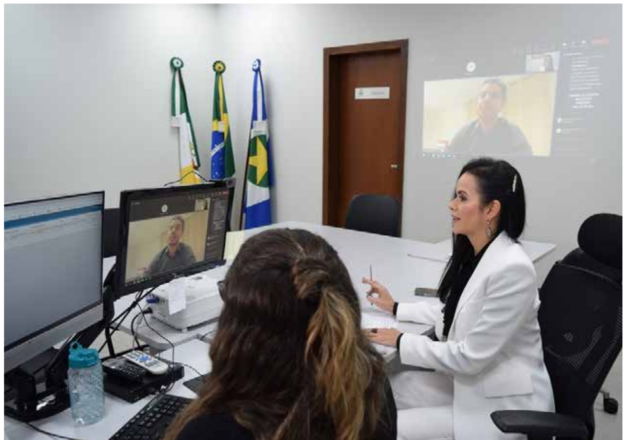
Dos 27 filhos e netos que tinham direito a divisão do patrimônio, apenas cinco participaram presencialmente no Fórum da Comarca de Primavera do Leste

afirma que após muito desentendimento a família se aproximou com a realização da audiência. “Agora a família voltou a se falar, graças a Deus. Ela é muito grande, então antes quando um concordava com algo, outro não concordava. Foi assim por longos anos.