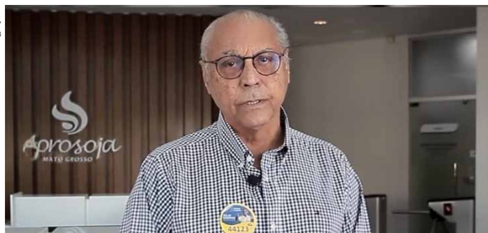
Candidato a deputado estadual Júlio Campos.