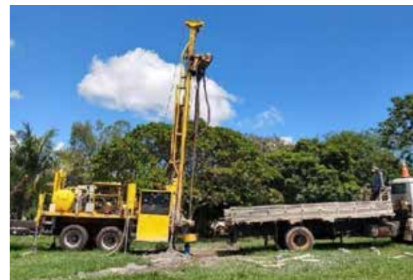
A Metamat vem perfurando poços e resolvendo a situação de centenas de famílias, que agora contam com água de qualidade em suas casas