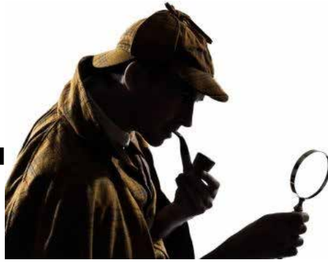
Personagem fictício que escreve inspirado em acontecimentos reais ou não...