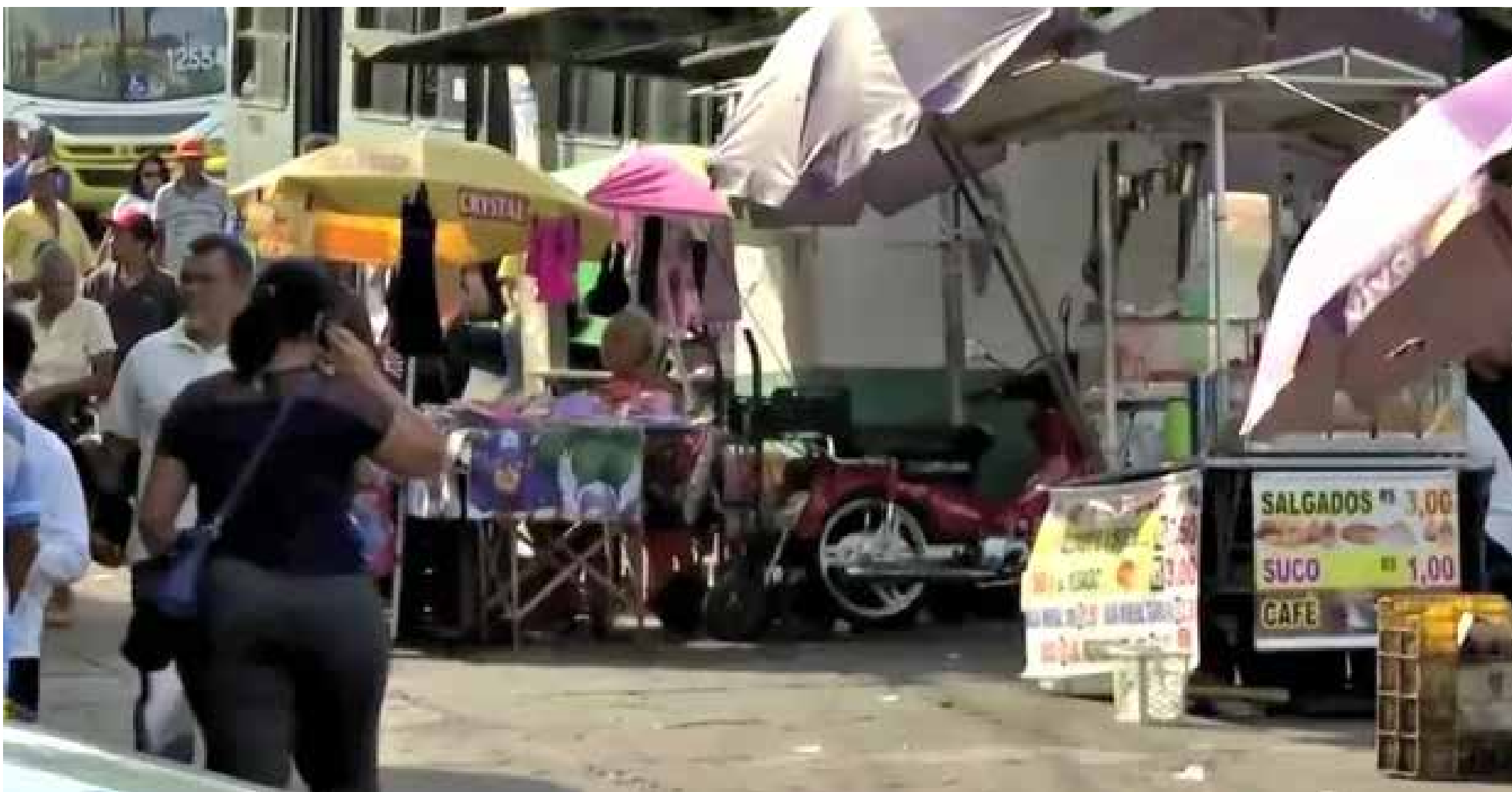
Ambulantes poderão ser remanejados para a Praça Rachid Jaudy