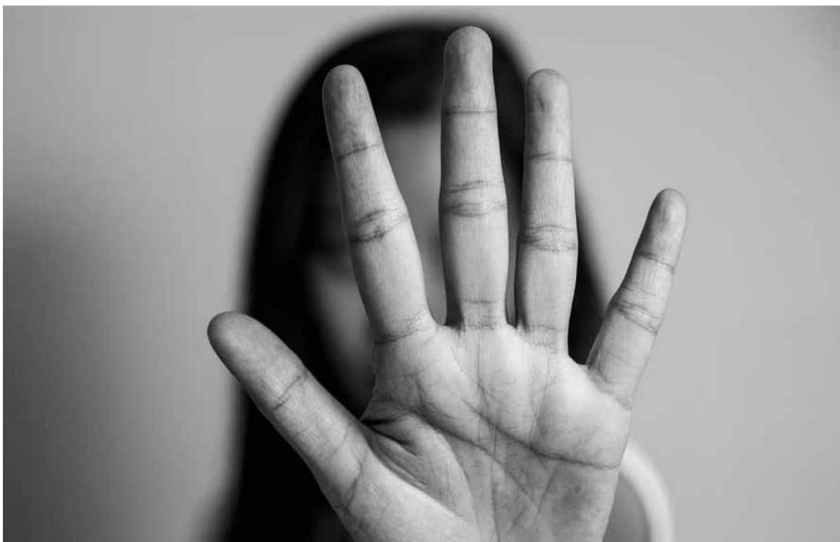
O objetivo do Agosto Lilás é intensificar a divulgação da Lei Maria da Penha, que completa 16 anos

O mês de agosto é marcado por muitas campanhas no Brasil. Além do 'Agosto Amarelo', que é em incentivo ao aleitamento materno, também têm o 'Agosto Lilás', uma campanha instituída por lei para enfrentamento à violência doméstica contra a mulher. O objetivo é intensificar a divulgação da Lei Maria da Penha, que completa 16 anos.