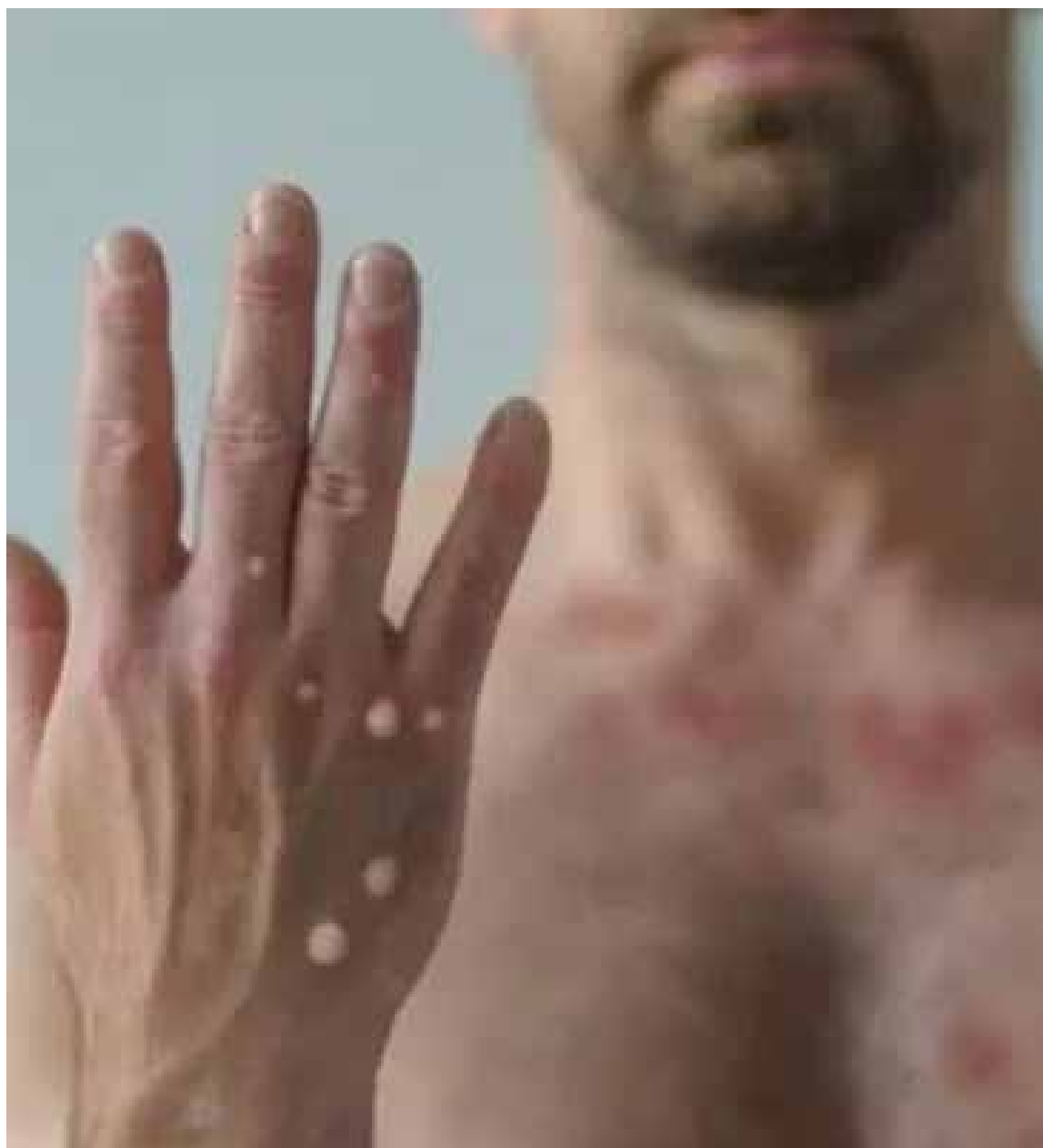
As principais manifestações da doença são febre, mal estar, dor no corpo, ínguas e lesões vesiculares (pequenas bolhas e pústulas) na região genital, mas que podem estar em qualquer outro lugar