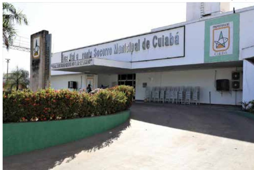
Todos os procedimentos serão feitos no Hospital e Pronto Socorro Municipal de Cuiabá

Estas cirurgias serão realizadas em pacientes de todo Mato Grosso, que aguardam na fila desde 2015 a junho de 2021. A coordenadora da Central de Regulação, Rafaely Metelo revelou que o programa MT Mais Cirurgias aprovou 11.500 procedimentos para Cuiabá, mas a Central de Regulação só encontrou 3.046 pessoas até a data de 1º de agosto. “Dos 3.046 que manifestaram interesse para passarem pelas cirurgias, 1.655 são de Cuiabá, 370 de Várzea Grande, 83 de municípios da Baixada Cuiabana e 938 de municípios do interior”, disse a coordenadora.