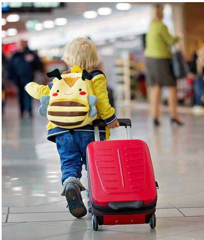
Para adolescentes com 12 anos ou mais é obrigatória a apresentação de documento oficial com foto

Não é necessária autorização dos pais e nem judicial para criança ou adolescente que apresentar passaporte válido, onde conste autorização expressa para que viaje desacompanhado ao exterior. Entretanto, os pais devem ir à Polícia Federal para fazer esse procedimento.