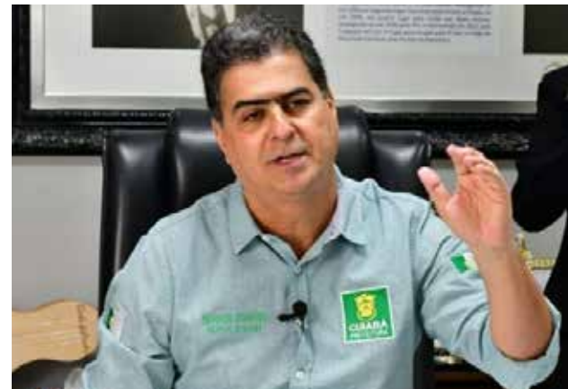
Prefeito Emanuel Pinheiro anunciou nova obra de mobilidade urbana durante live na semana passada

especialmente para os moradores da região Sul, do Parque Cuiabá, Cohab São Gonçalo, Residencial Coxipó, Santa Teresinha, Jockey Clube e quem busca outra ligação da Palmiro Paes de Barros com a Avenida Fernando Correa também vai ter uma nova avenida como opção”, pontuou.