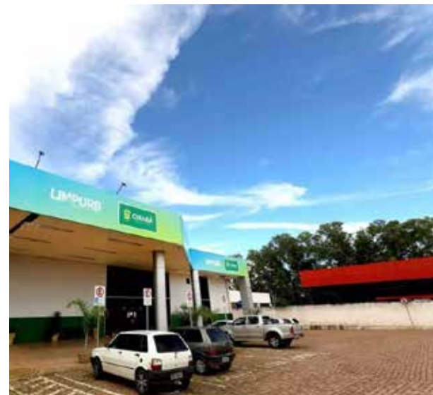
A seleção será feita em etapa única, por meio de prova objetiva de conhecimentos básicos, gerais e específicos

Nível técnico: Auxiliar Pública, Analista de RH, de Topógrafo, Desenhista/Projetista, Técnico em Arquiteto, Analista de Segurança no Trabalho e Controle Interno, Contador, Engenheiro Civil, Engenheiro Eletricista, Engenheiro Florestal e Engenheiro Sanitarista.