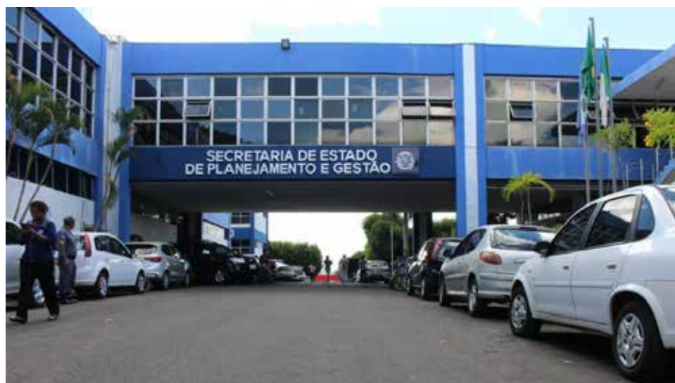
Seplag: dos 72.250 servidores aptos a declararem seus bens e valores, 11.562 não o fizeram dentro do prazo

A entrega só será concluída após o servidor realizar todas as etapas do sistema e emitir comprovante de envio.