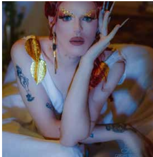
A bela Drag Flor de Lis arrasou em seu B'Day na Clan!! Parabéns!!