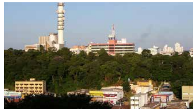
O último estudo feito pela secretaria de meio ambiente da capital catalogou mais de 1550 árvores de 50 espécies no Morro da Luz

O último estudo feito pela secretaria de meio ambiente da capital catalogou mais de 1550 árvores de 50 espécies.