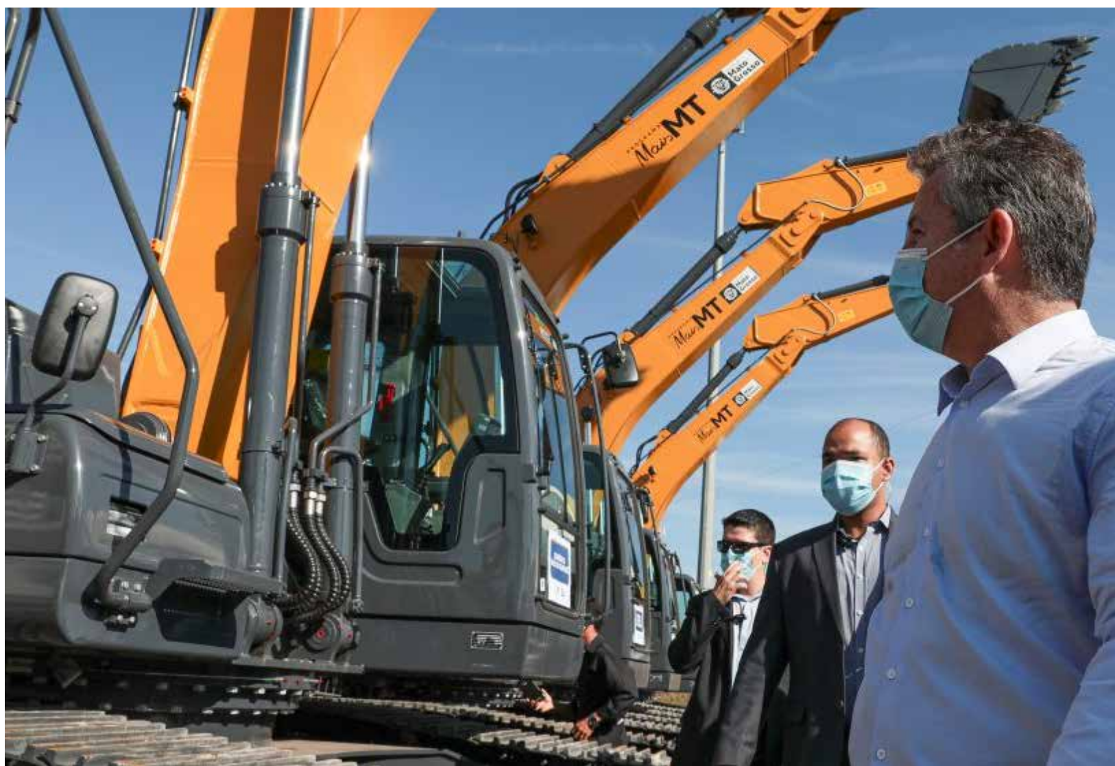
No ano passado o governador Mauro Mendes investiu R$ 209 milhões nas aquisições de dezenas de máquinas e equipamentos para a Agricultura Familiar e Infraestrutura dos 141 municípios

De acordo com o governador Mauro Mendes, a aquisição destas máquinas vai reforçar os trabalhos de conservação e manutenção nas rodovias estaduais não pavimentadas e também