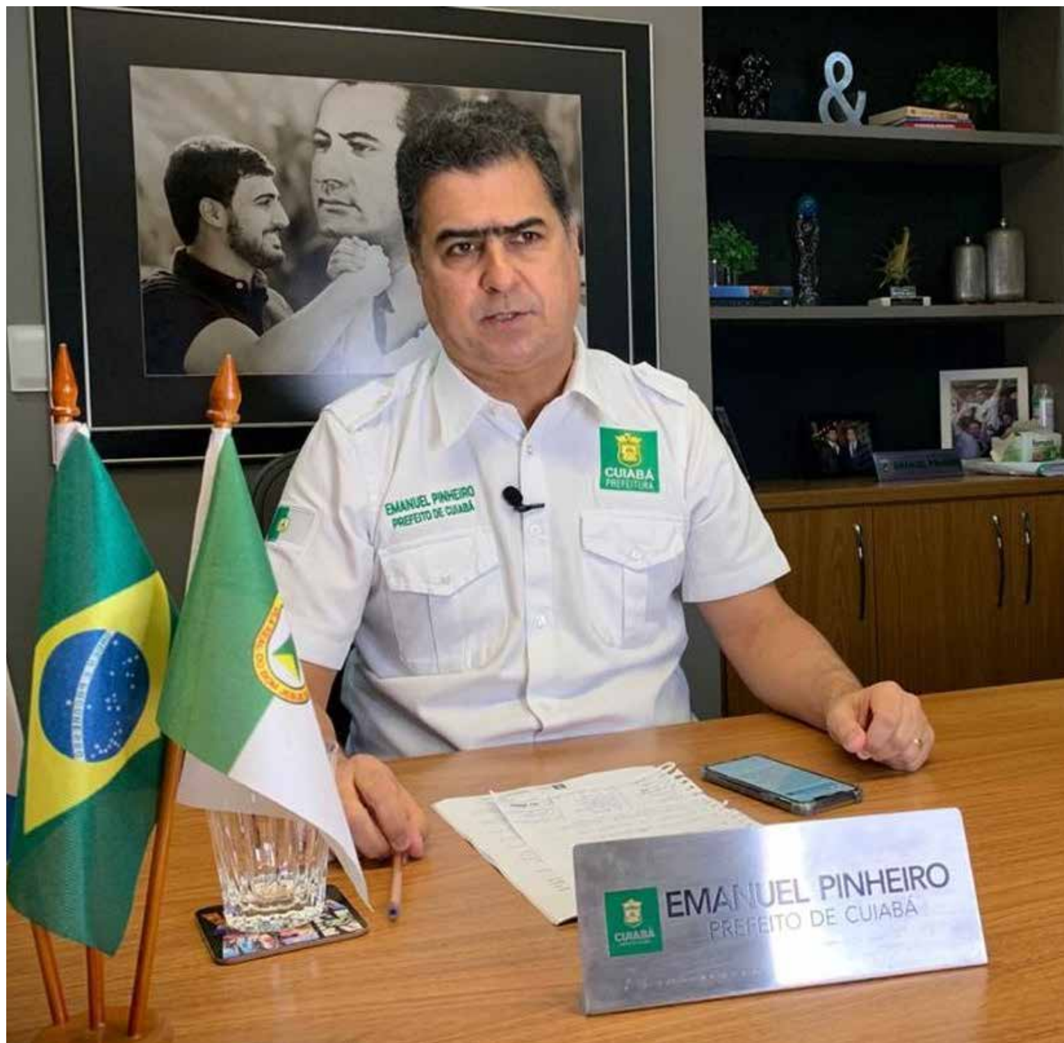
“Um retorno mais que esperado e comemorado por nós”, pontuou o prefeito, sobre o atendimento normal no Hospital São Benedito

que fazem na Empresa Cuiabana de Saúde Pública – HMC e São Benedito”, elogiou o prefeito.