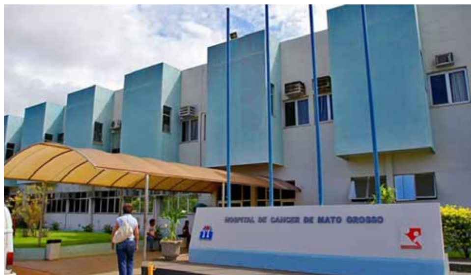
O HCanMT fornece refeições para pacientes, funcionários e acompanhantes

Mais informações pelo 3648-7567 ou pelo WhatsApp 65 9.8435-0386.