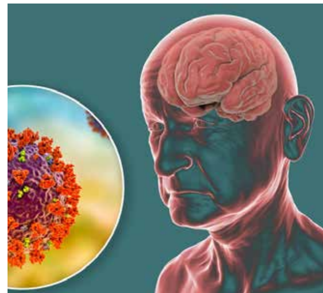
O coronavírus pode desencadear uma gama de sintomas no paciente mesmo após a recuperação

Se houver necessidade, o paciente é encaminhado para realização de exames complementares, que podem ser laboratoriais e de imagem, como tomografia ou ressonância de crânio. "Após as avaliações e, se for o caso, indicamos tratamento com fonoaudiólogo ou neuropsicólogo para ajudar na recuperação", explica.