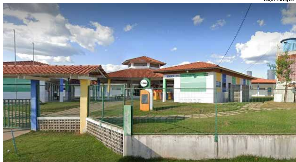
Diretoria da Escola Municipal de Ensino Básico explica que o menor é um aluno novo na rede municipal, por isso ainda não há um cuidador disponível para o atender, mas que já foi solicitado a título de urgência