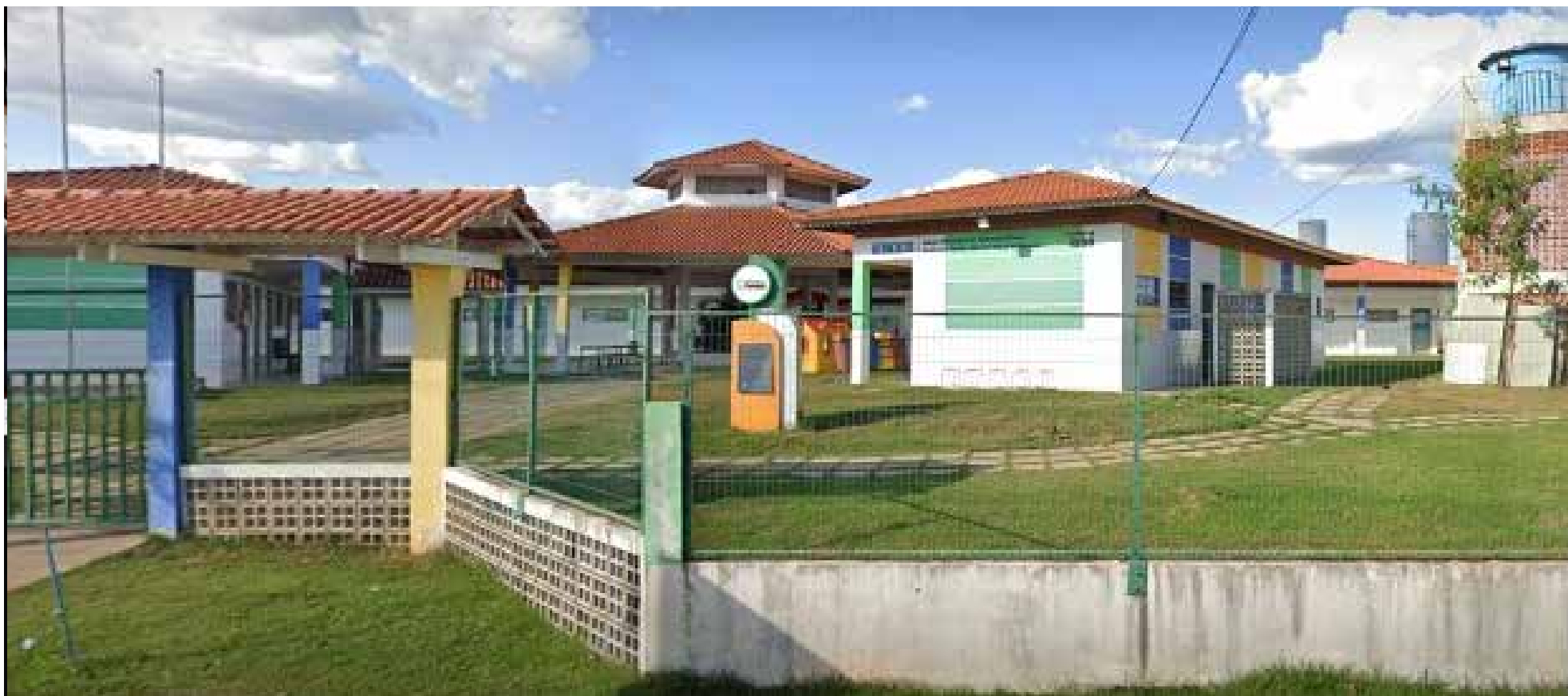
Diretoria da Escola Municipal de Ensino Básico explica que o menor é um aluno novo na rede municipal, por isso ainda não há um cuidador disponível para o atender, mas que já foi solicitado a título de urgência