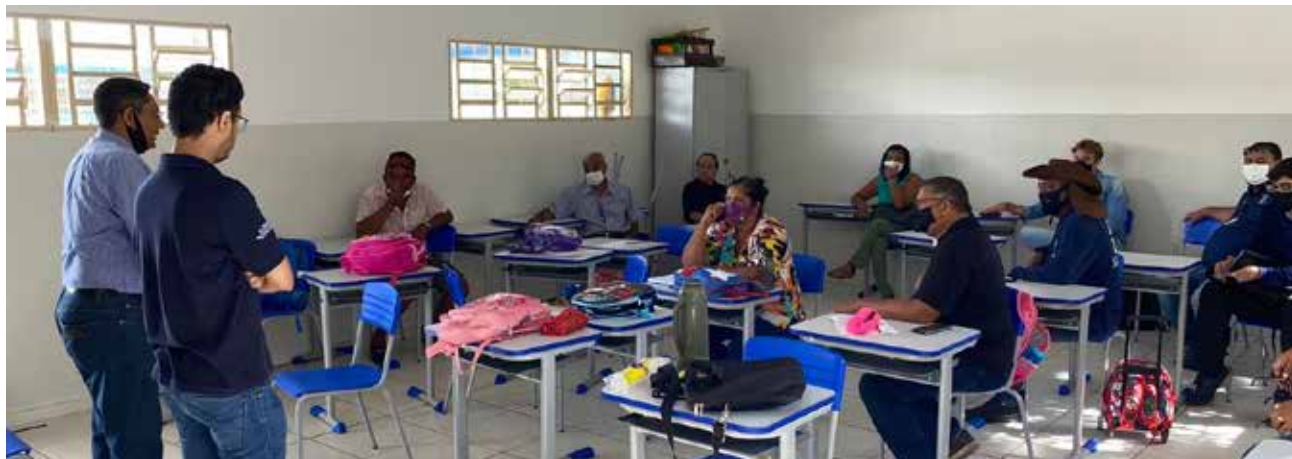
A primeira comunidade livramentense a ter seus dados inquiridos foi Mata-Cavalo e região