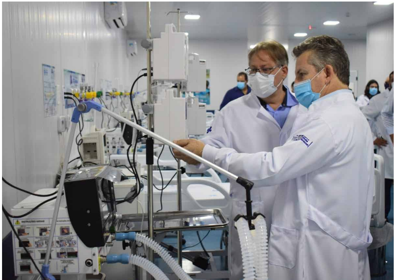
Abertura de novos leitos segue determinação do governador Mauro Mendes