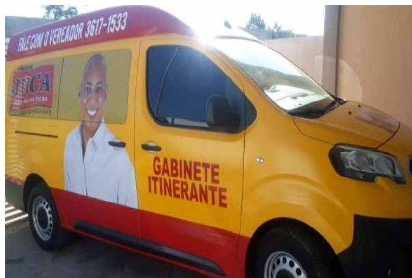
Gabinete Itinerante manteve trabalhos mesmo durante o recesso parlamentar

Um outro bairro que teve o acompanhamento do Gabinete Itinerante foi o Jardim Imperial, mais precisamente na Avenida das Palmeiras, que foi beneficiado com um serviço de limpeza das vias e canteiros centrais após pedido de moradores e intervenção junto à pre-