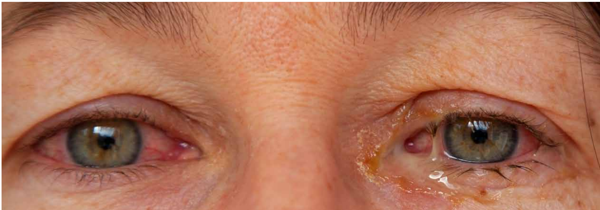
A doença inflama a conjuntiva, membrana que recobre a face interna das pálpebras e a esclera, parte branca do olho

O médico adverte que a conjuntivite viral também pode ser contraída através da nova cepa do coronavírus, a ômicron