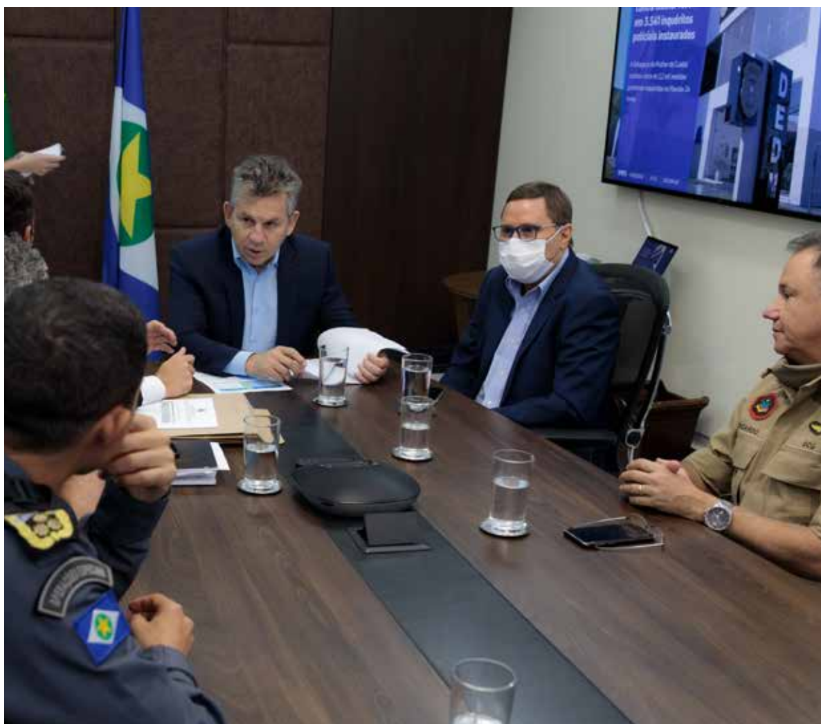
Mauro: “Apesar de o concurso ser para cadastro de reserva, todo aquele que atingir a nota mínima de corte estará entre os aprovados e poderá ser nomeado”

As provas serão em 20 de fevereiro nos municípios de Cuiabá, Várzea Grande, Rondonópolis, Sinop e Barra do Garças. O concurso terá validade de dois anos, podendo ser prorrogado por mais dois anos.