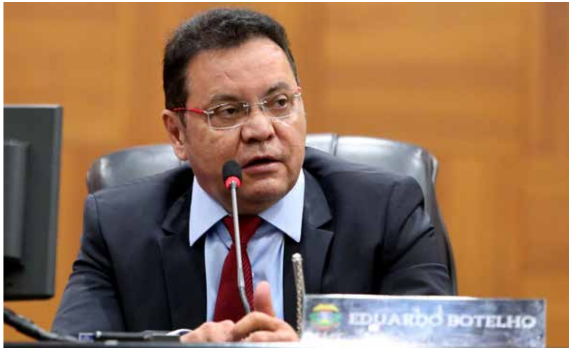
“Mato Grosso é o único Estado que está crescendo mais que a China”, destaca Botelho

A estimativa de investimentos para o próximo ano é de R$ 3,3 bilhões, dos quais R$ 2,9 bilhões são de receitas próprias do Estado.