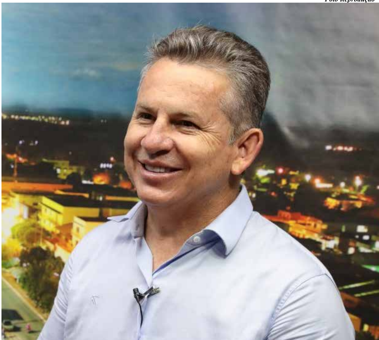
“Mato Grosso evoluiu em todas as áreas. Nunca foi visto tanto investimento do governo”, comemora Mauro Mendes

Mauro ainda resalta que tem muita coisa importante acontecendo, como a primeira ferrovia estadual, estratégica para Cuiabá, para a região médio-norte, para o agronegócio, para a competitividade da indústria e para a geração de emprego e qualidade de vida do povo mato-grossense.