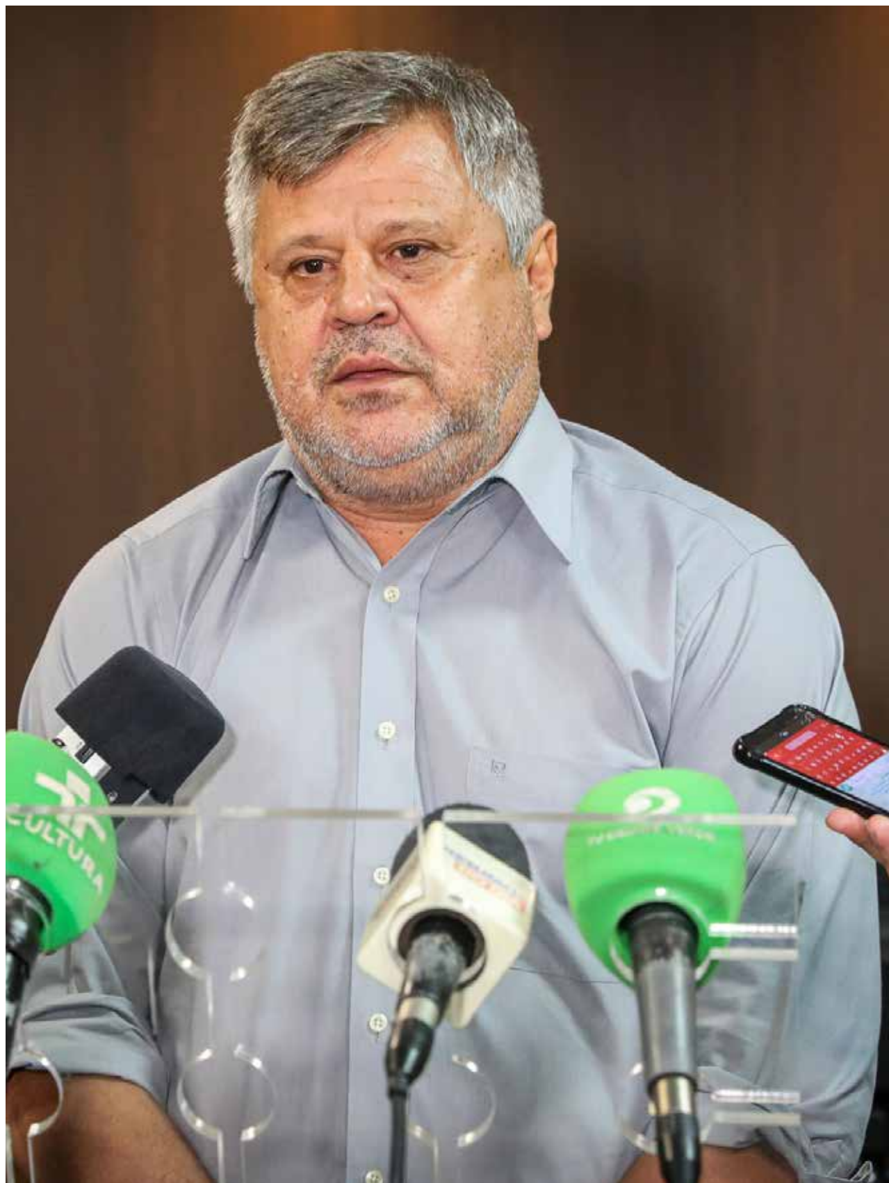
Stopa diz ainda que o servidor público deve tratar o cidadão como clientes, pois são eles que pagam os impostos e consequentemente os salários

Inicialmente eu pensei até em implantar na educação, porque no início o prefeito Emanuel Pinheiro havia me convidado a ir para Educação, mas acabei indo para Obras, mas enfim, eu sempre tenho estudado e procurado entender o que é meritocracia no poder público, e já existe em várias cidades brasileiras a meritocracia dando bastante resultados, dando o servidor feliz e também a população feliz”, finalizou.