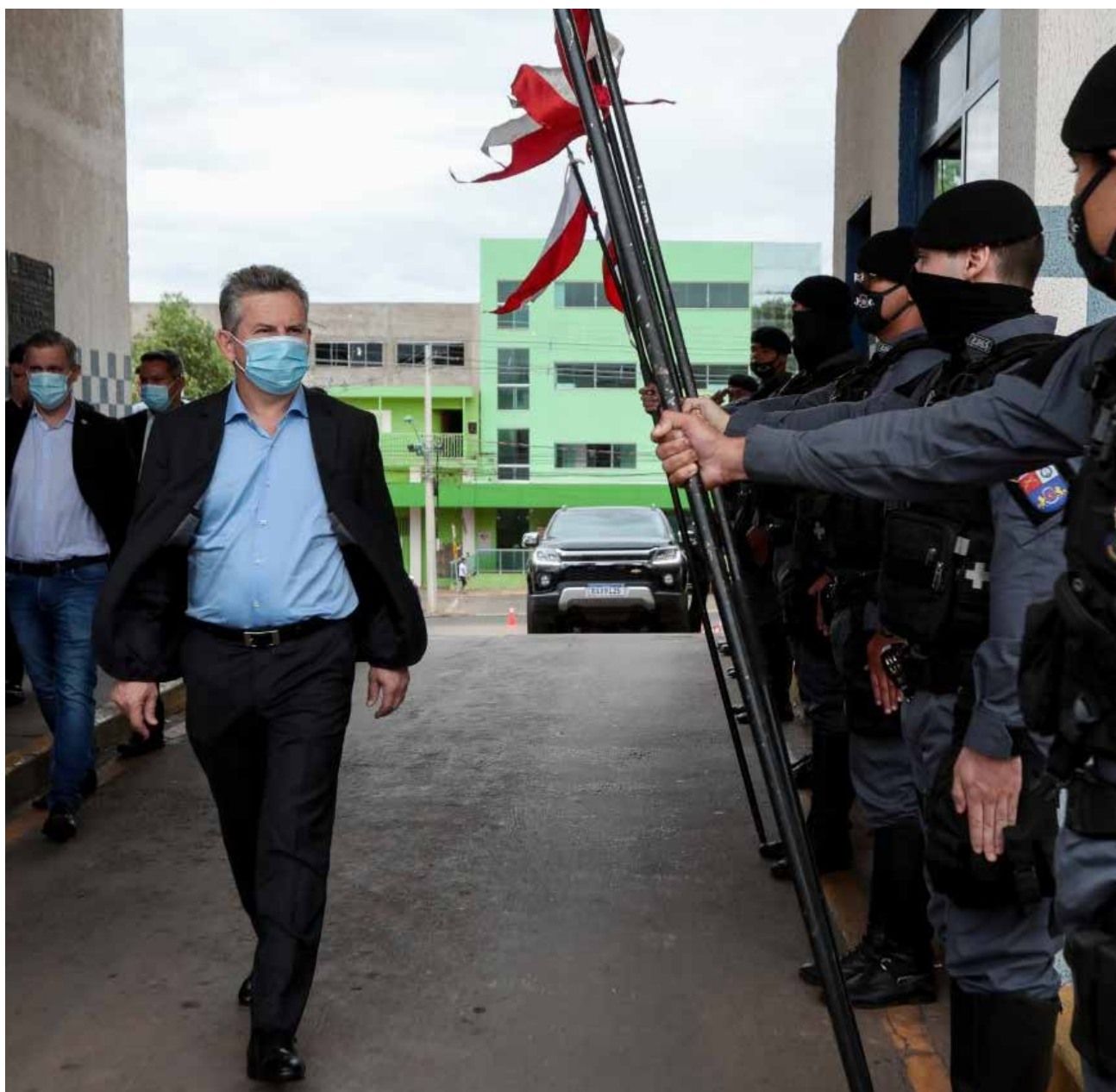
Mauro ressalta que neste ano a segurança pública recebeu investimentos em tecnologia e infraestrutura que contribuem para garantir a segurança do cidadão

O Governo de Mato Grosso vem cumprindo com o compromisso de investir pesado no setor de segurança pública. Na semana passada, o governador Mauro Mendes entregou na semana passada o novo helicóptero ao Centro Integrado de Operações Aéreas (Ciopaer) adquirido por R$ 20,8 milhões, além de cerca de R$ 3,4 milhões